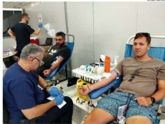
Voluntários participam da Campanha de Doação de Sangue e ajudam Itatiba a alcançar resultado recorde às vésperas do Carnaval

Em um gesto coletivo de solidariedade que marcou o último sábado, a população de Itatiba respondeu de forma expressiva ao chamado do Rotary Club e ajudou a estabelecer um novo recorde na Campanha de Doação de Sangue, com 152 bolsas válidas arrecadadas; o número representa 87% dos 175 voluntários cadastrados e ganha ainda mais relevância por ocorrer às vésperas do Carnaval,