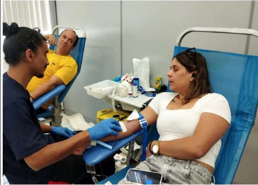
Trabalhos de coleta da equipe do Hemocentro da Unicamp Campinas, na 1ª Campanha de 2026

Foi realizada no último sábado, nas dependências da Secretaria de Ação Social, a 1ª Campanha de Doação de Sangue do ano, conjuntamente com o Cadastro da Medula Óssea, promovidas pelo Rotary Club de Itatiba. Dos 130 agendados antecipadamente, foram cadastrados 95, arrecadando 90 bolsas válidas, 18 pessoas doaram pela primeira vez e 10 foram cadastrados para doação da Medula Óssea.