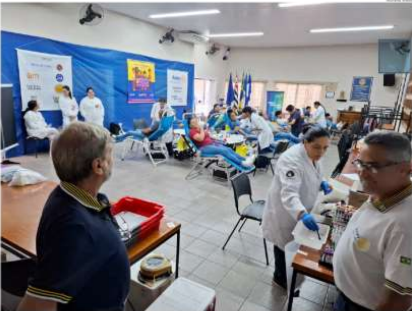
Após do Rotary Club em Itatiba, com apoio da imprensa local, reforçam a importância da doação e ampliam o cadastro de doadores de medula óssea na cidade.

O número de doadores de medula óssea segue em crescimento na região de Campinas, com aumento registrado pelo Hemocentro da Unicamp, mantida distante do ideal para atender a demanda de pacientes que aguardam transplante, reforçando a importância da mobilização contínua da sociedade; nesse cenário, Itatiba tem papel ativo por meio das campanhas promovidas pelo Rotary Club, com apoio do Jornal de Itatiba e da Rádio CBN, que incentivam a doação de sangue e ampliam o cadastro no Redome, contribuindo diretamente para salvar vidas, sempre nos três primeiros meses de 2025, foram 42 novos doadores cadastrados, sendo 10 em janeiro, 10 em fevereiro e 20 em março, números que já demonstram engajamento da população logo no início do ano; em 2025, ao longo dos 12 meses, as campanhas locais resultaram em 127 cadastros, evidenciando o impacto positivo das ações comunitárias; apesar disso, especialistas alertam que a compatibilidade genética ainda é rara e que é fundamental ampliar a base de doadores, especialmente entre jovens, para aumentar os chances de encontrar doadores compatíveis; o comprometimento para cadastro é simples, seguro e pode representar a única esperança de cura para pacientes com doenças graves do sangue, tornando cada novo cadastro um gesto concreto de solidariedade e vida.