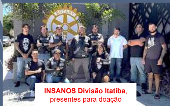
INSANOS Divisão Itatiba, presentes para doação