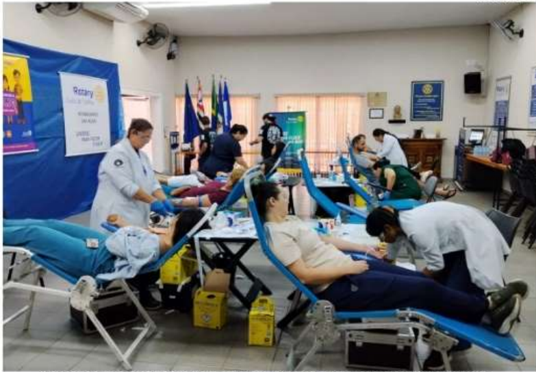
Pessoas em processo de coleta de sangue na sede da Apami no último sábado

Por um grande esforço dos rotarianos, a 3ª Campanha de Doação de Sangue e o cadastramento da Medula Óssea, que estavam marcados para a