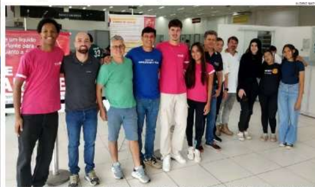
Equipe do Rotary de Itatiba celebra o resultado recorde da Campanha de Doação de Sangue, que arrecadou 152 bolsas e mobilizou a solidariedade da população itatibense às vésperas do Carnaval