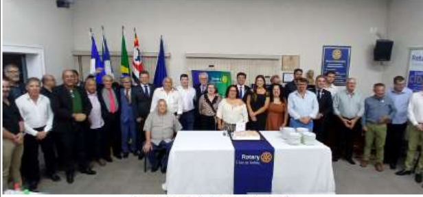
Companheiros do Rotary Clube Itatiba

O evento ocorreu na noite da última terça-feira, 10, na sede da entidade. Na ocasião foram empossados 2 novos companheiros, além de homenagens