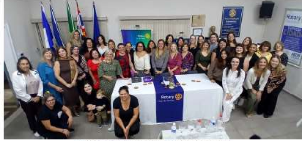
Associação das Senhoras dos Rotarianos de Itatiba