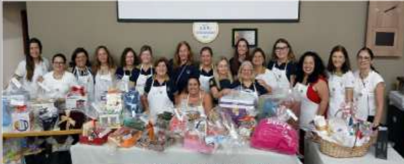
Associação das Senhoras das Rotaristas de Itatiba

O primeiro "Chamiga" deste ano foi realizada na tarde da última quinta-feira, 05, na sede do Rotary Clube Itatiba. A ação é destinada para a compra de cadeiras de roda, de banho, muletas e andadores do banco de empréstimos