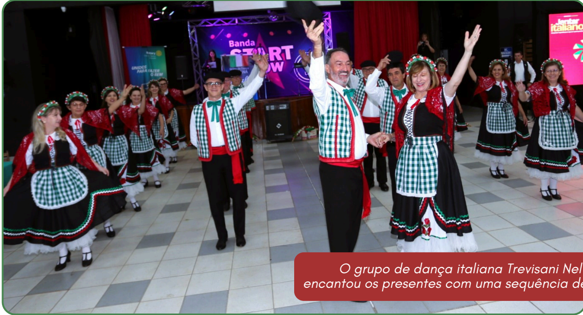
O grupo de dança italiana Trevisani Nel Mondo, de Cordeirópolis, encantou os presentes com uma sequência de danças típicas italianas

Agora, o Rotary segue para a próxima etapa: o fechamento do caixa do evento. Com os recursos arrecadados, será realizada a compra dos cobertores já nas próximas semanas, que posteriormente serão destinados às ações coordenadas pelo Fundo Social de Solidariedade do município.