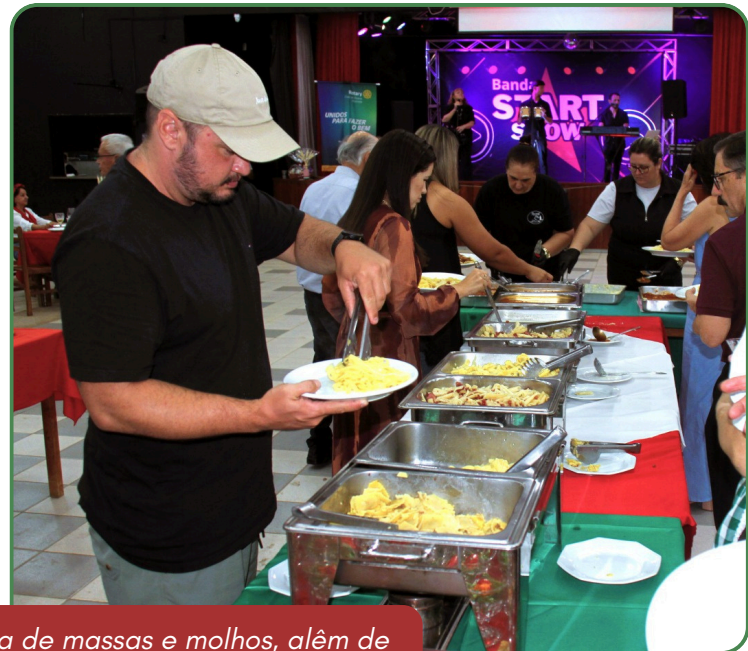
Buffet contou com uma sequência de massas e molhos, além de entradas e antepastos que trouxeram sabor à noite