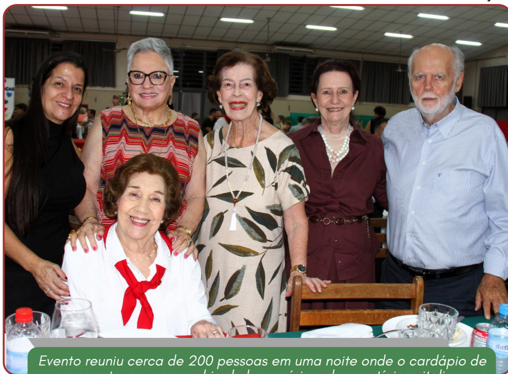
Evento reuniu cerca de 200 pessoas em uma noite onde o cardápio de massas teve a companhia de boa música, danças típicas italianas e muita solidariedade pela Campanha do Agasalho.

O Rotary Clube de Araras-Alvorada realizou, no dia 25 de abril, o tradicional Jantar Italiano, marcando o primeiro evento de 2026 em prol da Campanha do Agasalho no município. A iniciativa, realizada no salão social da Apae, reuniu cerca de 200 pessoas e abriu o calendário de ações solidárias que irão contribuir com a arrecadação de recursos para a compra de cobertores destinados às famílias em situação de vulnerabilidade. Promovido pelo clube desde 2011, o evento, que anteriormente acontecia no formato de almoço e hoje é realizado como jantar, mantém o mesmo propósito ao longo dos anos: transformar a tradição e o encontro comunitário em solidariedade concreta. Mais do que uma noite festiva, o jantar foi resultado do forte envolvimento dos companheiros do clube, que atuaram diretamente em todas as etapas da realização: desde a venda dos ingressos, passando pelos preparativos prévios, até a recepção e acolhida do público durante o evento. O engajamento coletivo foi determinante para o sucesso da ação. A programação cultural foi um dos pontos altos da noite. A animação ficou por conta da Banda Start Show, que garantiu um ambiente alegre e envolvente. Outro destaque foi a apresentação do grupo de dança italiana Trevisani Nel Mondo, sediado no bairro do