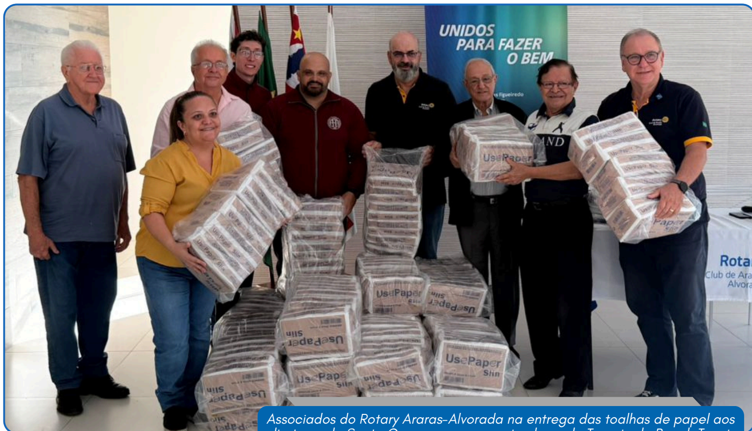
Associados do Rotary Araras-Alvorada na entrega das toalhas de papel aos diretores da Santa Casa, com os organizadores do Torneio de Beach Tennis

Doação foi viabilizada com recursos do torneio Neon Night de Beach Tennis, realizado pela Associação Atlética Ararense e atende a uma demanda direta do hospital