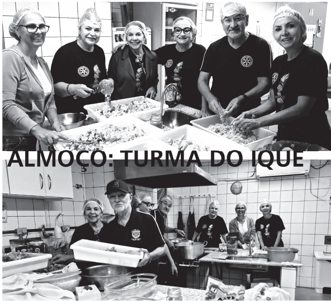
ALMOÇO: TURMA DO IQUE