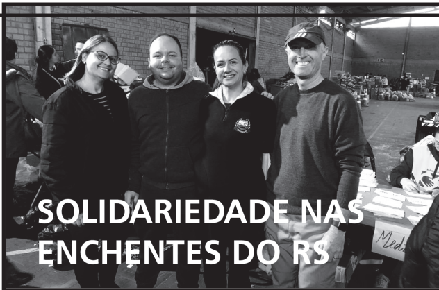
SOLIDARIEDADE NAS ENCHENTES DO RS