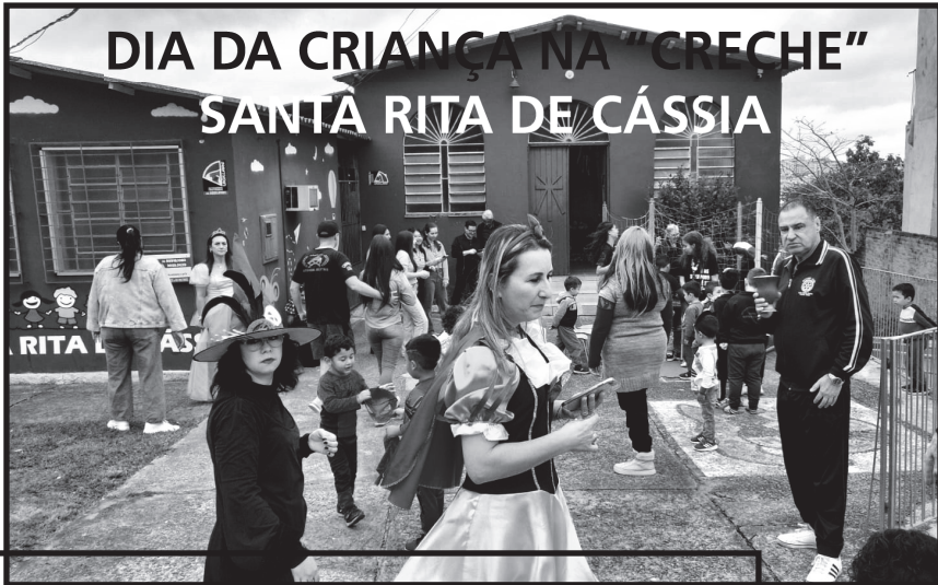
DIA DA CRIANÇA NA "CRECHE" SANTA RITA DE CÁSSIA