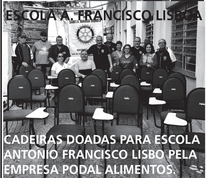
ESCOLA ANTONIO FRANCISCO LISBOA