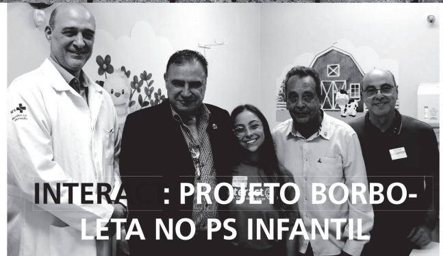
INTERAÇÃO: PROJETO BORBOLETA NO PS INFANTIL