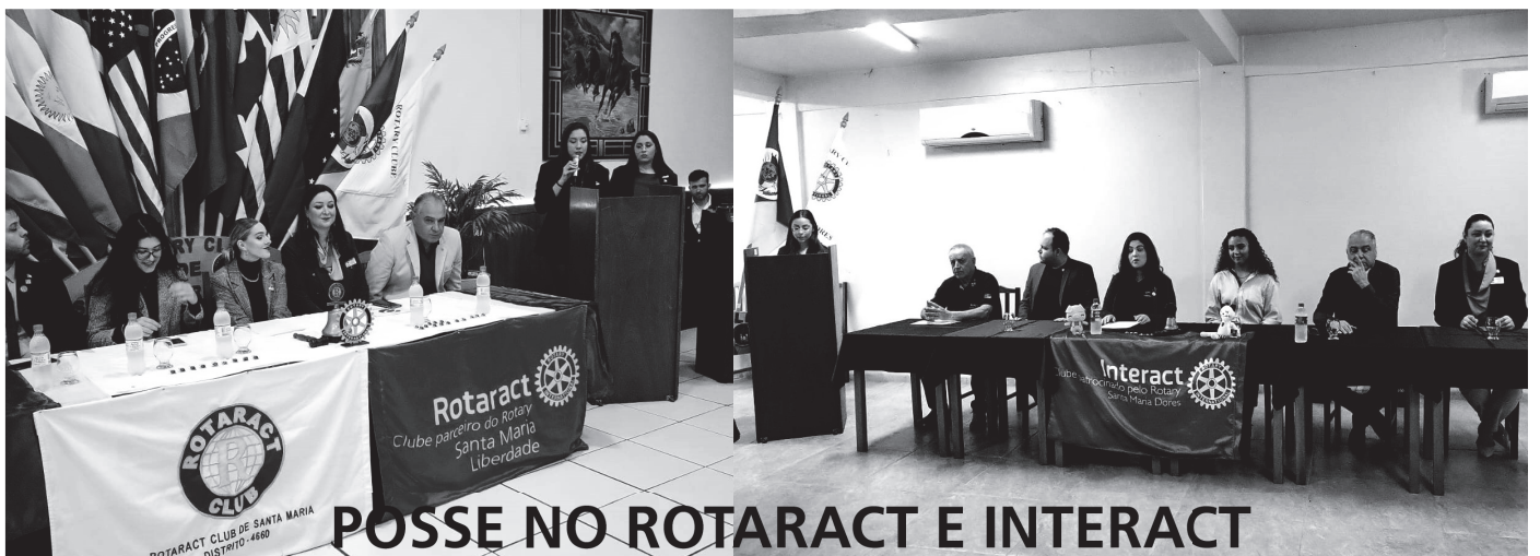
POSSE NO ROTARACT E INTERACT