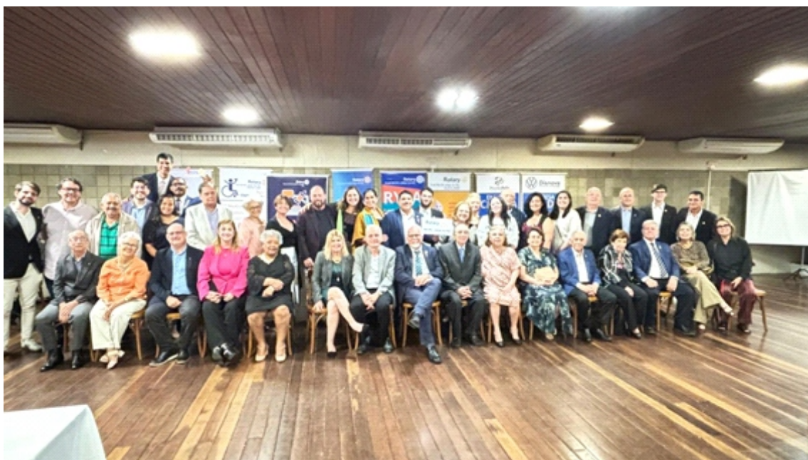
Registro Oficial de todos os participantes da Solenidade de Posse