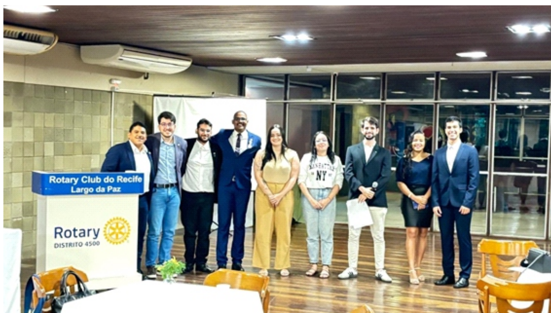
Conselho Diretor do Rotaract Recife Largo da Paz 2025-26