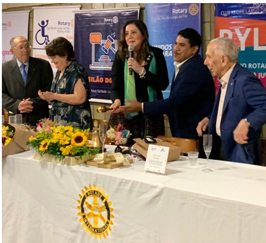
Os Presidentes do Rotary e do Rotaract Clubs Recife Largo da Paz no encerramento da Festiva de Posse