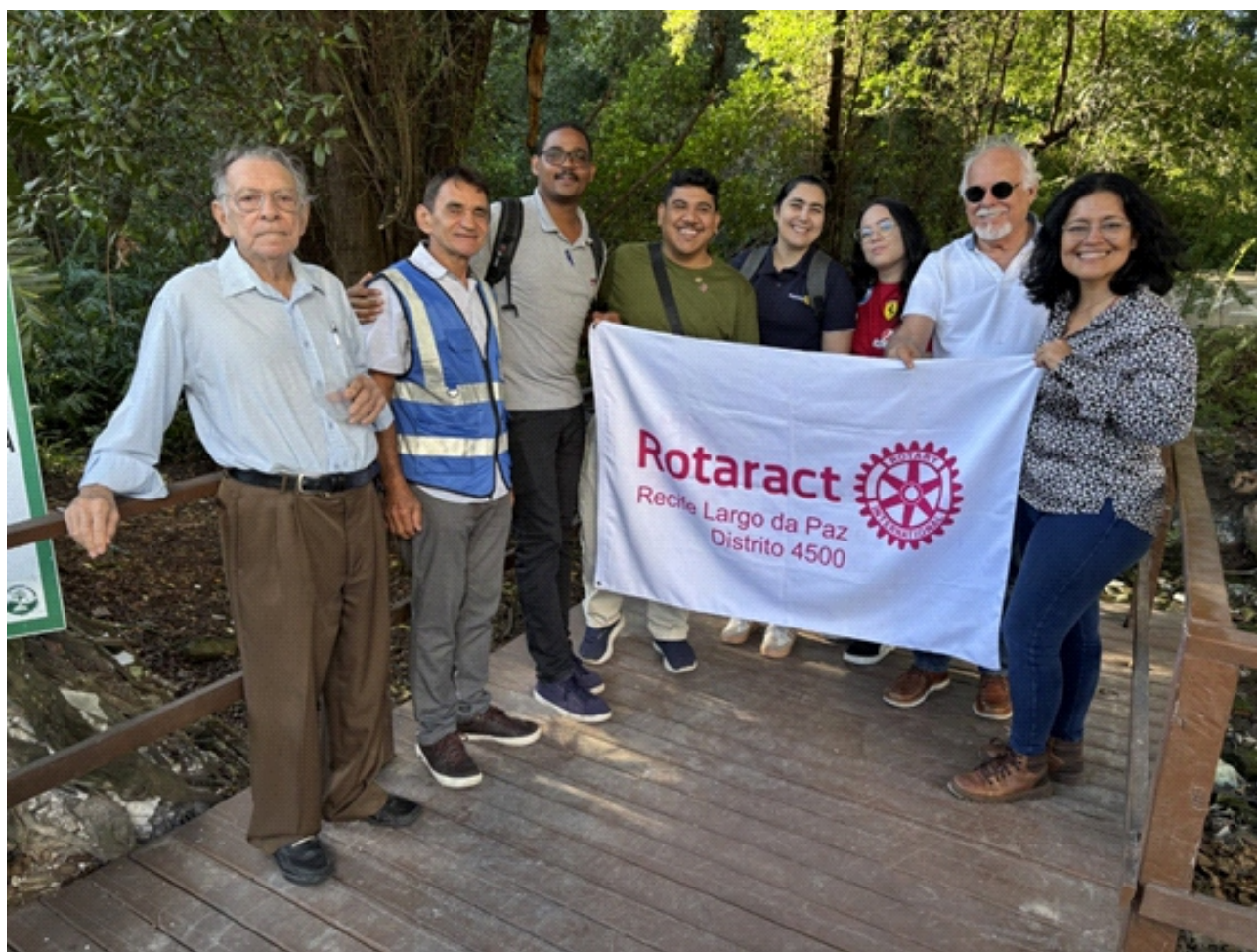
VISITA AO PROJETO SOS MANGUE REALIZADA PELO ROTARY CLUB E ROTARACT CLUB NO DIA 16.7.25 ÀS 15H