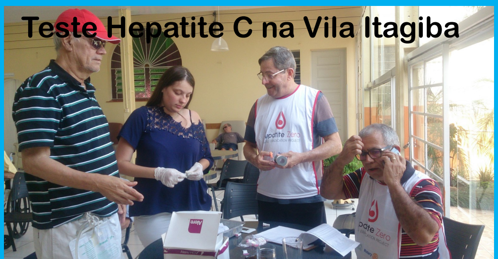
Teste Hepatite C na Vila Itagiba