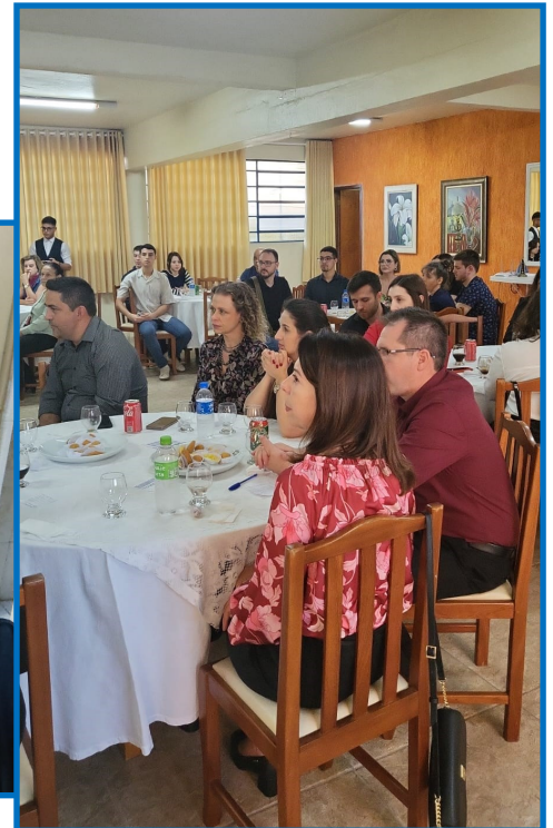
Familiares e amigos prestigiaram a festa de posse da nova diretoria do Interact.