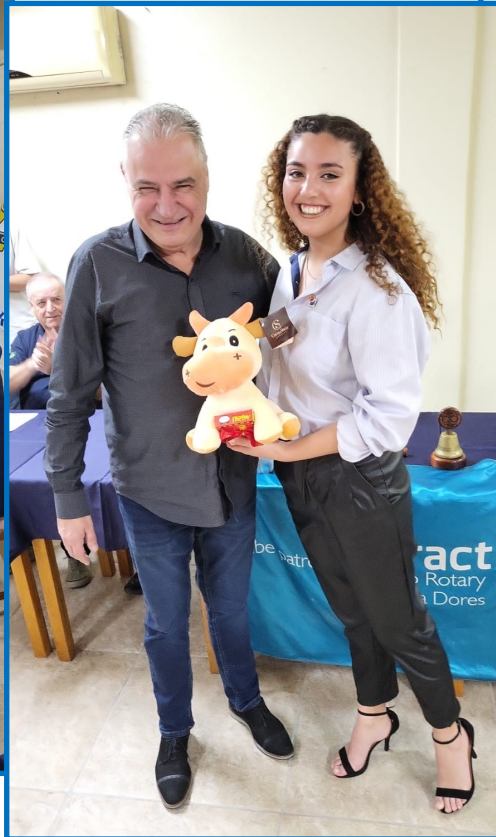
A presidente empossada recebeu do clube padrinho um bicho de pelúcia, adotado como mascote do clube e que o acompanhará em todos os eventos em que participar. Ter um mascote é tradição entre os Interact Clubs.