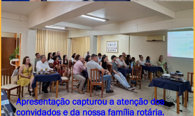
Apresentação capturou a atenção dos convidados e da nossa família rotária.

ultrapassa e forma redes de conhecimento e de perspectivas. Este encontro foi ontem na reunião do Rotary, que fui convidado a participar e do qual meu filho faz parte em Tupanciretã, encontrei o lema 2023-2024: Crie Esperança no Mundo. Achei esta chamada fantástica, se todos nós pudermos de qualquer forma ou maneira contribuir um pouco com essa ideia estaremos contribuindo para um FUTURO melhor para todos. ” (Destaque da Redação)