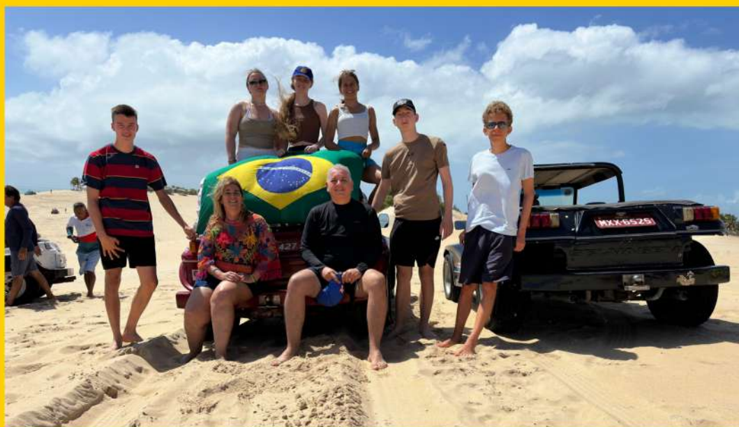
Passeio Dunas de Genipabu