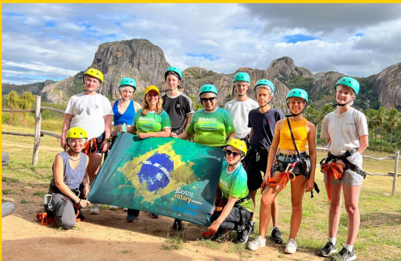
Tirolesa Arena Vertical - Parque Estadual da Pedra da Boca

A programação incluiu: Fim de semana em Araruna/PB e Sítio Novo/RN, com trilhas e tirolesa no Parque Estadual Pedra da Boca; passeio a Pipa/Tibau do Sul, dunas de Genipabu, piscinas naturais de Perobas, cajueiro de Pirangi, fim de semana em Galinhos, além de city tour em Natal. Os intercambistas também puderam conhecer o trabalho do PROJETO AMAR, na Vila de Ponta Negra, onde passaram uma manhã. Rotarianos de vários clubes da cidade se integraram à programação ao longo da semana, como equipe.