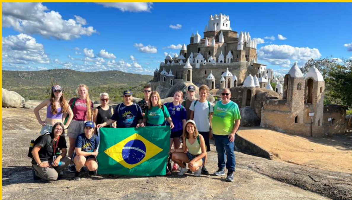
Castelo Zé dos Montes - Sítio Novo/RN