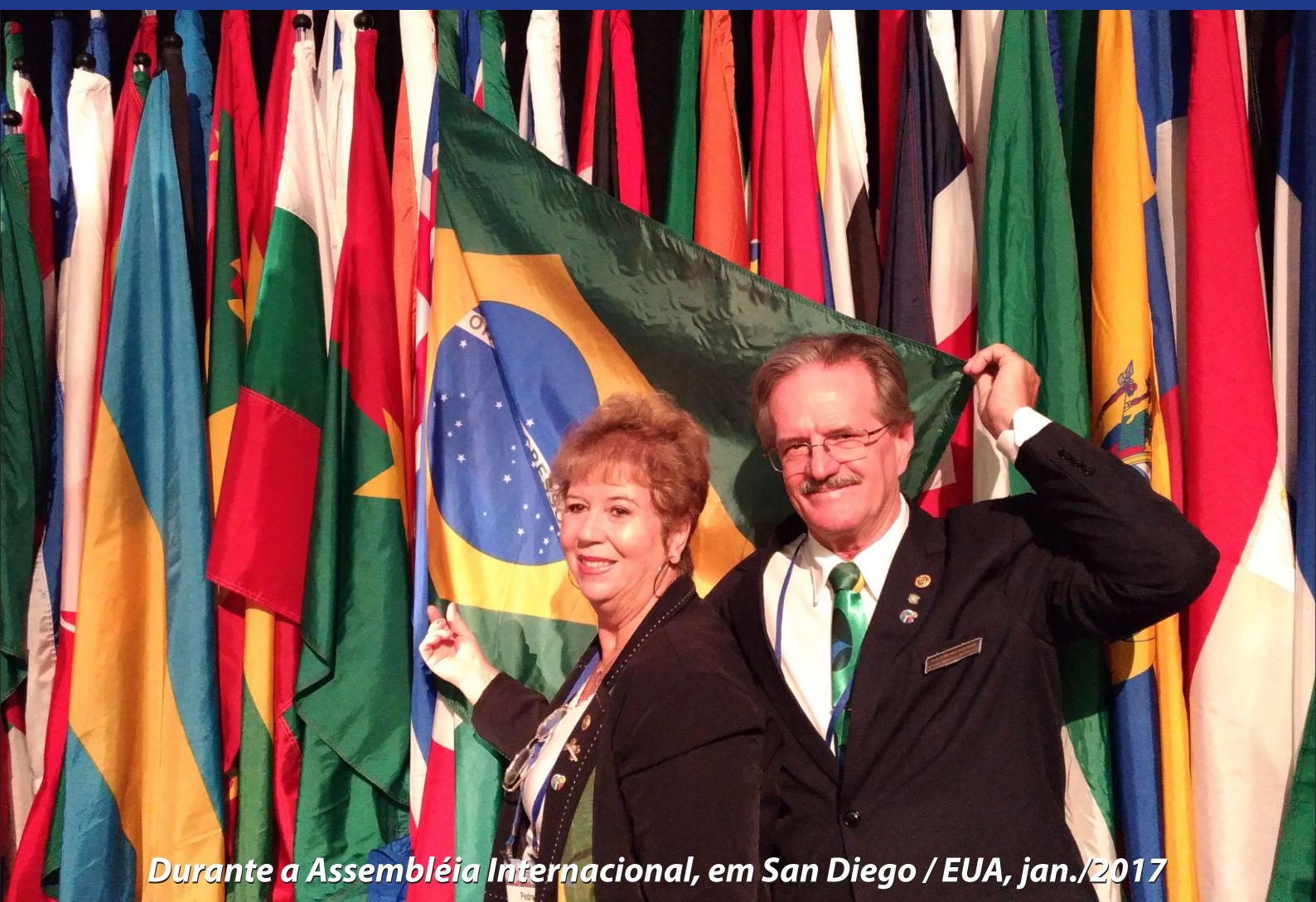
Durante a Assembléia Internacional, em San Diego / EUA, jan./2017

INFORMATIVO ROTARY • DISTRITO 4651 Nº 10 • ABRIL DE 2018 - SC - BRASIL