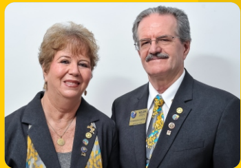
Gov. Noldin e Pedra (In memoriam)