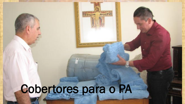
Cobertores para o PA