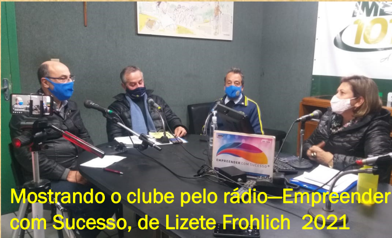
Mostrando o clube pelo rádio—Empreender com Sucesso, de Lizete Frohlich 2021