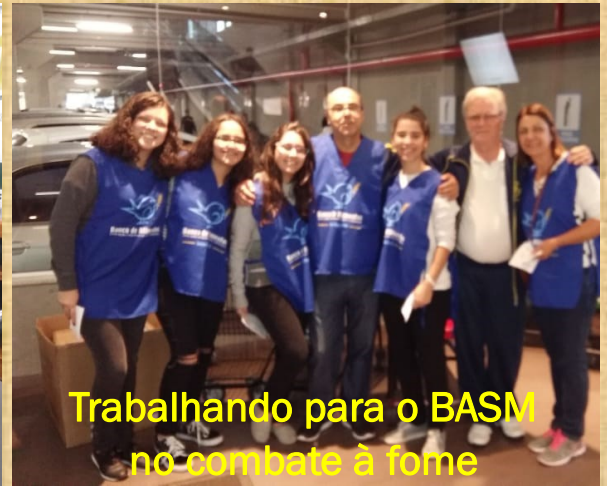
Trabalhando para o BASM no combate à fome