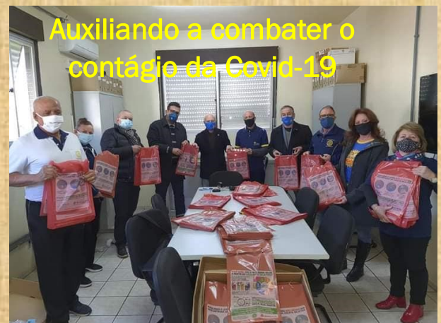
Auxiliando a combater o contágio da Covid-19