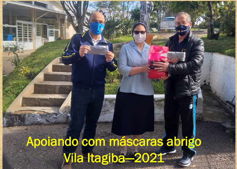
Apoiando com máscaras abrigo Vila Itagiba—2021