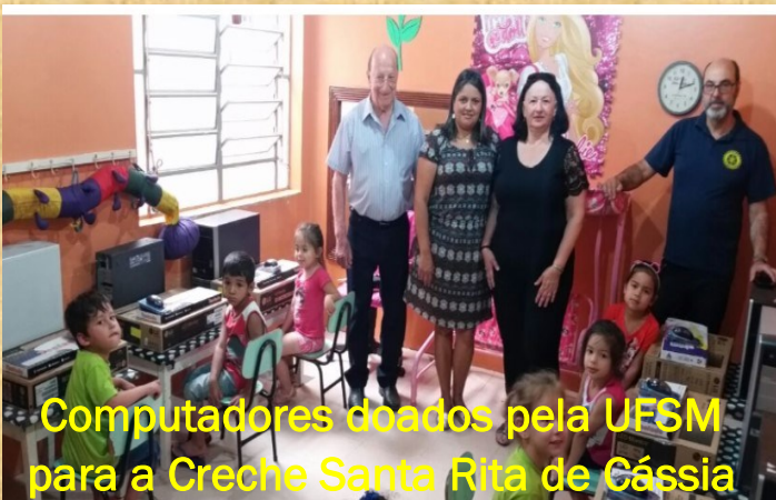
Computadores doados pela UFSM para a Creche Santa Rita de Cássia