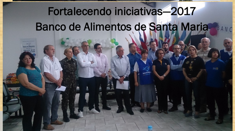
Fortalecendo iniciativas—2017 Banco de Alimentos de Santa Maria