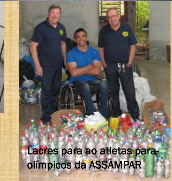
Lacs para ao atletas para- olímpicos da ASSAMPAR