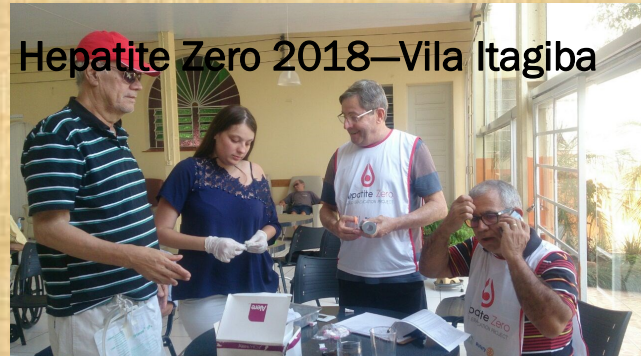
Hepatite Zero 2018—Vila Itagiba