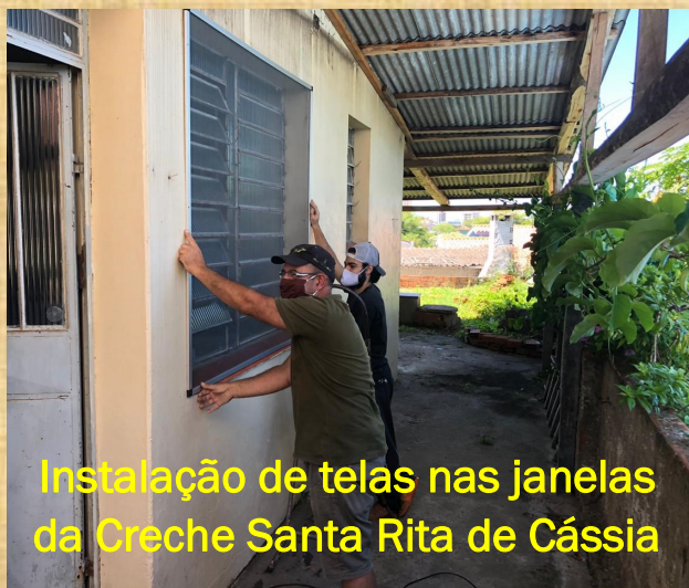
Instalação de telas nas janelas da Creche Santa Rita de Cássia