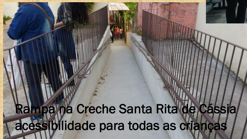
Rampa na Creche Santa Rita de Cássia acessibilidade para todas as crianças