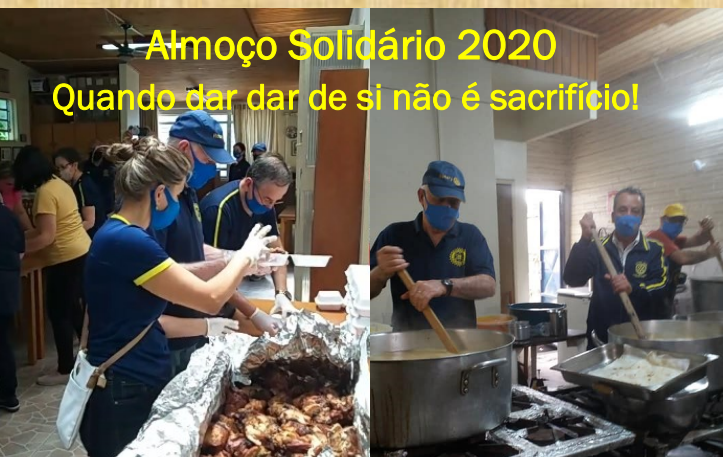
Almoço Solidário 2020 Quando dar de si não é sacrifício!