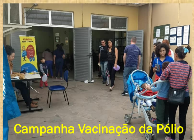
Campanha Vacinação da Pólio