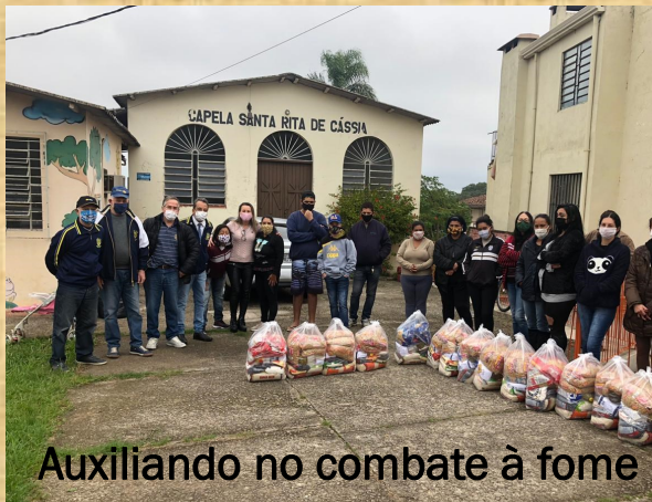
Auxiliando no combate à fome