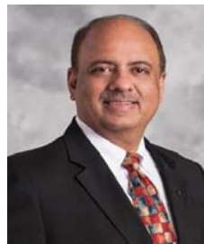
Shekhar Mehta Presidente, 2021-22

Ao nos concentrarmos no aumento do quadro associativo neste mês, peço a vocês que imprimam sua marca na história. Por mais de 20 anos, nosso quadro associativo permanece estagnado em 1,2 milhão de associados. O Rotary é uma organização vibrante com 116 anos de história, associados em mais de 220 países e áreas geográficas, e um rico legado de trabalho na erradicação da pólio e em outros programas. O Rotary mudou muito nossas vidas e as vidas de outras pessoas. Como Servimos para Transformar Vidas , vocês não acham que o Rotary poderia ter um impacto ainda maior no mundo se mais pessoas estivessem praticando nossa máxima de Dar de Si Antes de Pensar em Si?