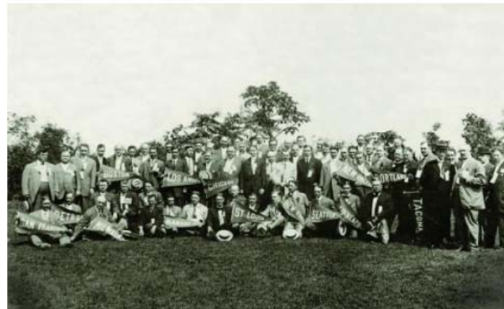
Participantes da primeira Convenção dos Rotary Clubs da América, realizada em 1910 em Chicago. O primeiro ano fiscal do Rotary começou no dia seguinte ao encerramento desta Convenção.

Já parou para pensar por que o ano rotário começa no dia 1º de julho? Isso se deve, em grande parte, à Convenção do Rotary. No princípio, a Convenção tinha um papel crucial no estabelecimento do início do ano fiscal e administrativo.