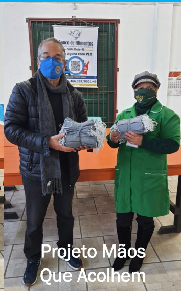
Projeto Mãos Que Acolhem