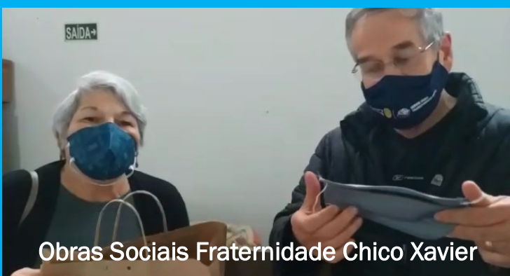
Obras Sociais Fraternidade Chico Xavier