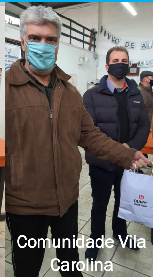
Comunidade Vila Carolina