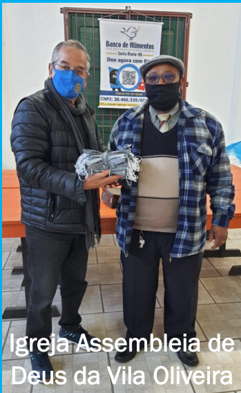
Igreja Assembleia de Deus da Vila Oliveira