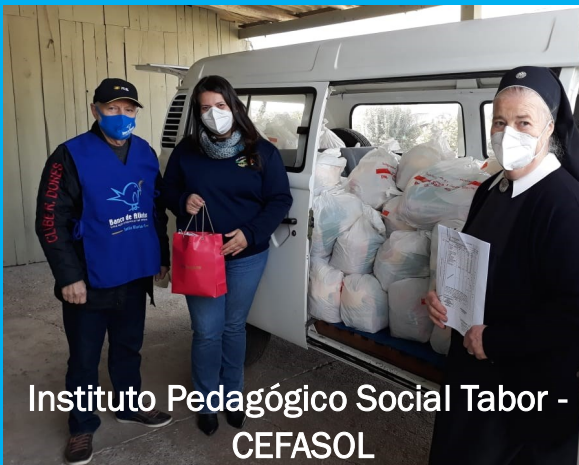
Instituto Pedagógico Social Tabor - CEFASOL