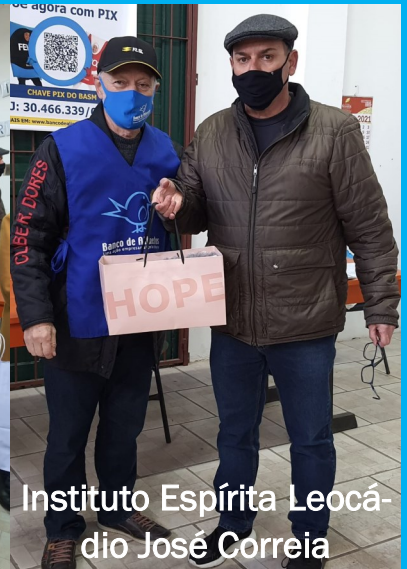
Instituto Espírita Leocáudio José Correia