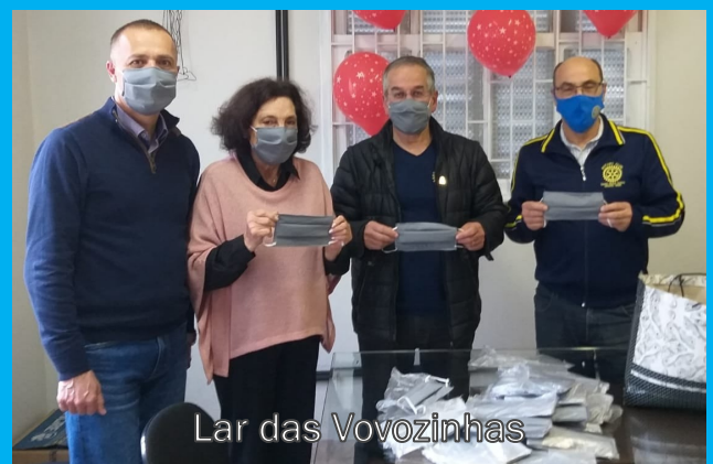
Lar das Vovozinhas