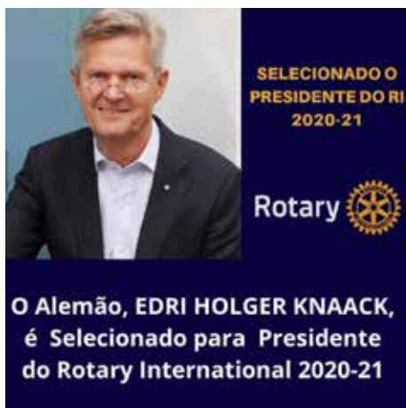
Foto Presidente RI 2020-21