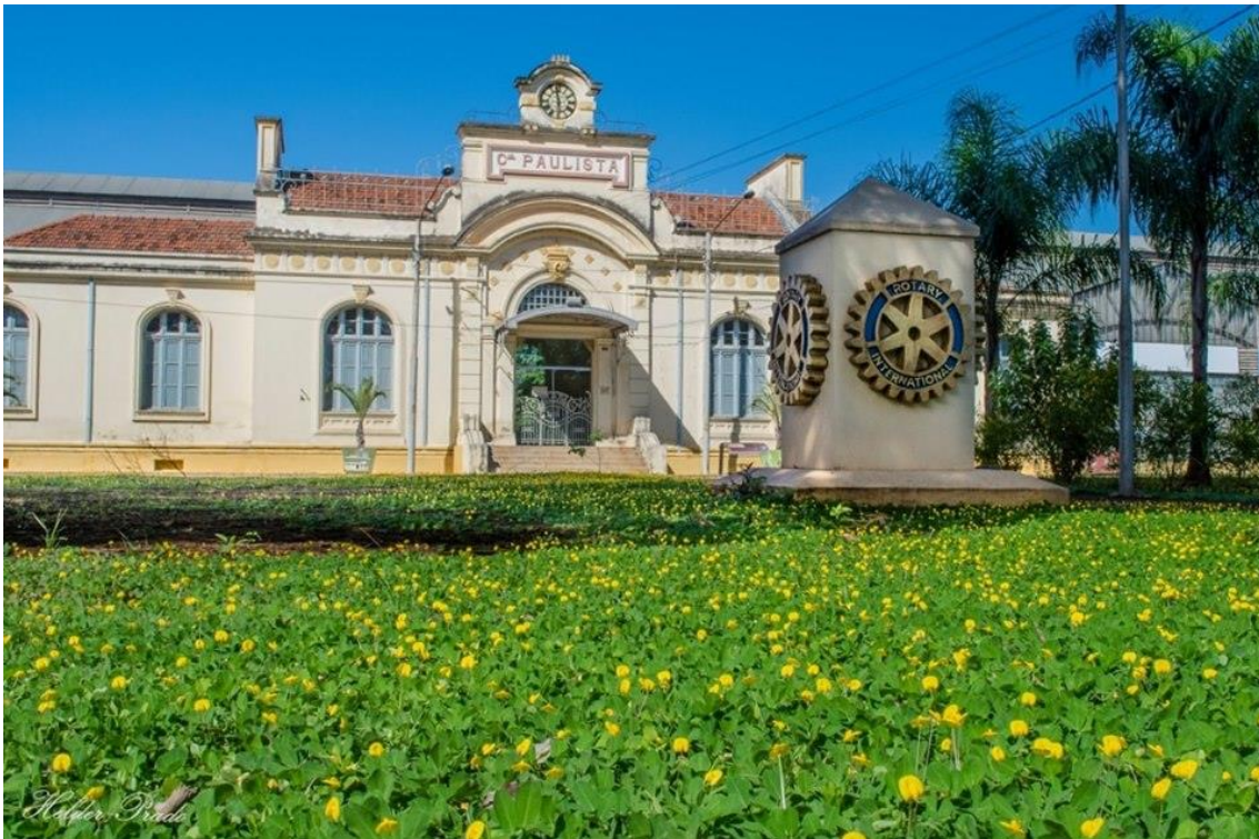
informações enviadas pelos companheiros do @rcpiracicabapaulista