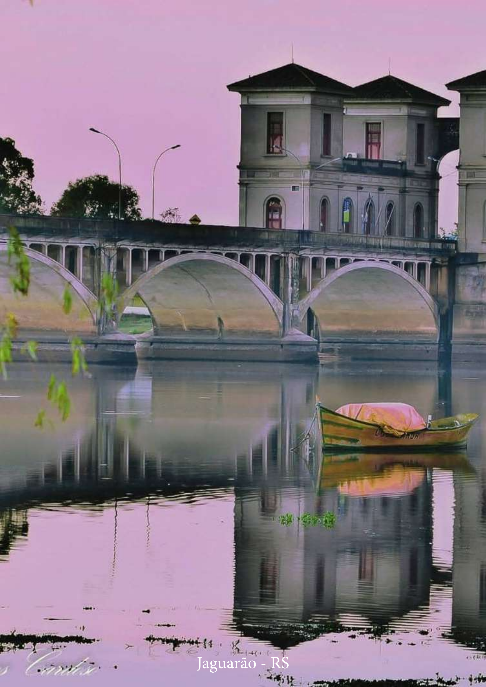
Jaguarão - RS