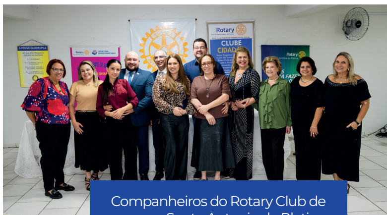
Companheiros do Rotary Club de Santo Antonio da Platina

Ela também ressalta que acompanhar mais de perto o impacto das ações fortalece o sentimento de pertencimento dos associados e aproxima ainda mais os clubes do propósito rotário.