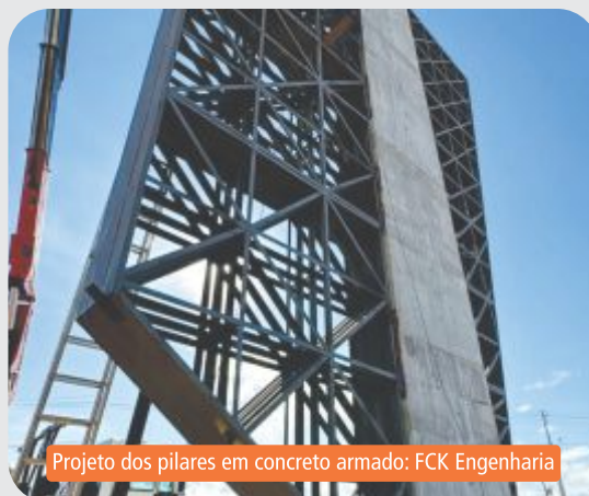
Projeto dos pilares em concreto armado: FCK Engenharia