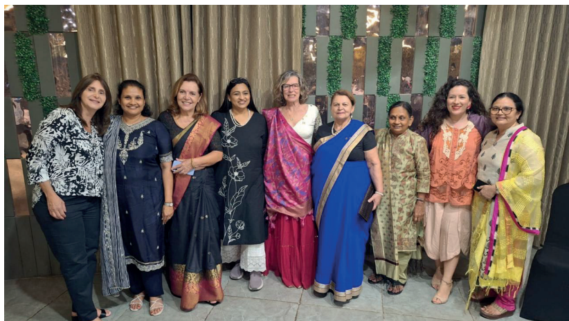
Mulheres do Distrito 4710 com Rotarianas da Índia

O Intercâmbio da Amizade vai ao encontro dos princípios do Rotary International fortalecendo amizades, gerando conexões e conhecimento sobre outras culturas na proposta do servir. O Intercâmbio possibilita um revezamento entre os distritos dos países, sendo que está prevista a ida de companheiros do 4710 aos EUA, em setembro próximo.