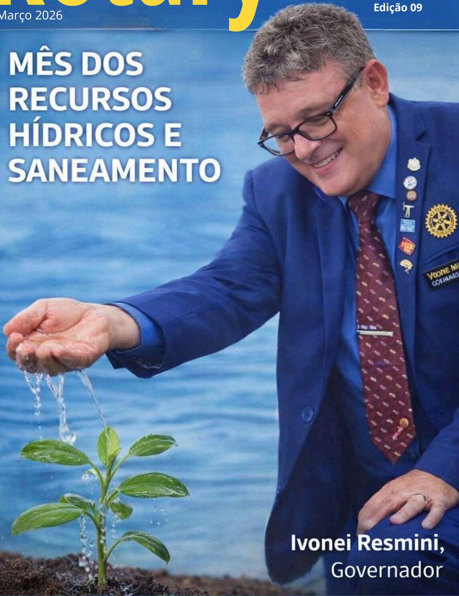
Ivonei Resmini, Governador