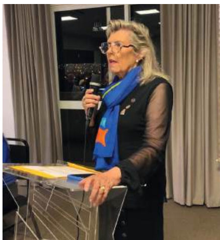
INÉDITO: Governadora convida para o Fórum do Idoso