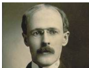
Paul Harris aos 28 anos, em 1896

O Rotary começou com a visão do advogado Paul Harris. Ele criou o Rotary Club de Chicago no dia 23 de fevereiro de 1905, com o objetivo de reunir diversas categorias de profissionais para a troca de ideias e fazer amizades duradouras. Com o passar do tempo o Rotary aumentou seu alcance e visão para serviços humanitários. Hoje, os associados atuam em trabalhos sociais, atendendo às necessi-