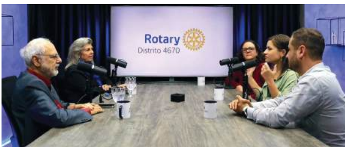
ROTARY CAST: transmissão por mais de uma hora

Outras transmissões disponíveis: Seminário de Imagem Pública; Seminário Distrital sobre o Meio Ambiente; Fórum Cerimonial e Protocolo entre outros eventos: Intercâmbio de Jovens do Rotary e ainda os cortes das coberturas.