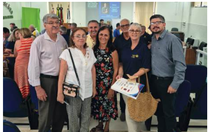
PRESTÍGIO: participações que engrandecem