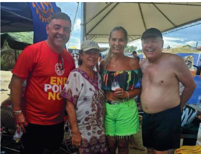
PRESENCAS: companheiros dos Clubs de Nova Santa Rita e Cachoeirinha