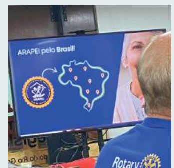
Associação Rotariana de Amparo à Pessoa Idosa - Arapei