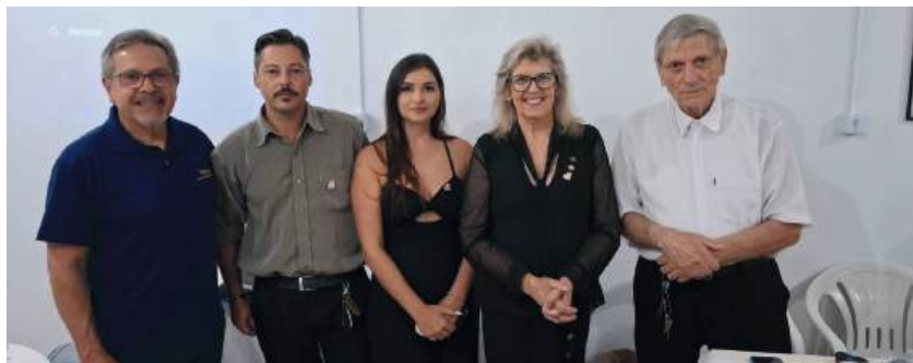
SANGUE NOVO: com o aumento do quadro social