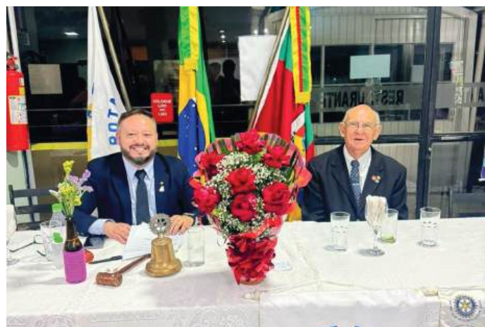
UNIDOS: companheiros comemoram a visita da Governadora