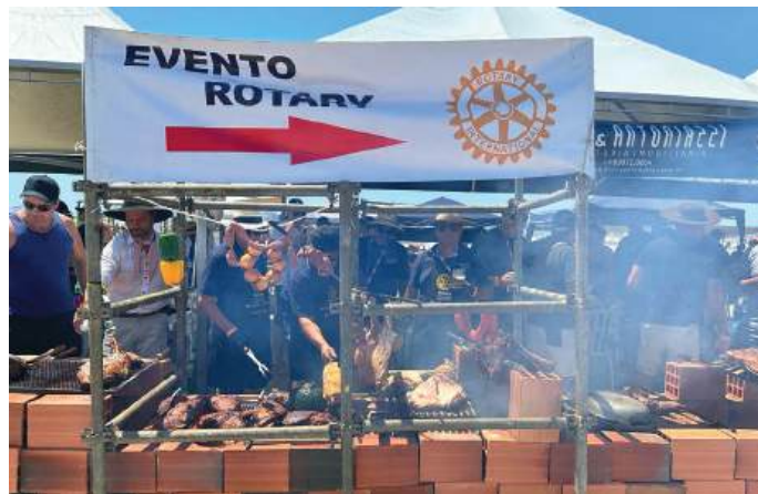
CHURRASCO: garantia de reunião de todos

Entre as atrações de palco que marcaram presença, destacou-se a animação de um DJ que garantiu a trilha sonora perfeita para momentos inesquecíveis. A novidade foi a música criada pelo Presidente do Empreendedor Germann, em homenagem ao Rotary.