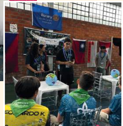
IMAGEM PÚBLICA: demonstrando alcance do Rotary

INCENTIVO: escoteiro pode ser intercambista