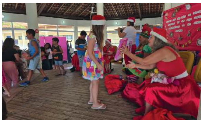
NATAL: brinquedos e guloseimas