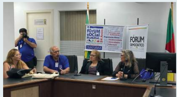
ESTREIA: Rotary instituição com experiência na causa tema do fórum

No Brasil, a OPAS/OMS atua com base na Estratégia de Cooperação do País (RCP) para o período de 2022 a 2027.