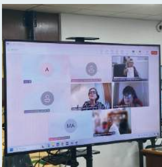
HÍBRIDO: participação on-line