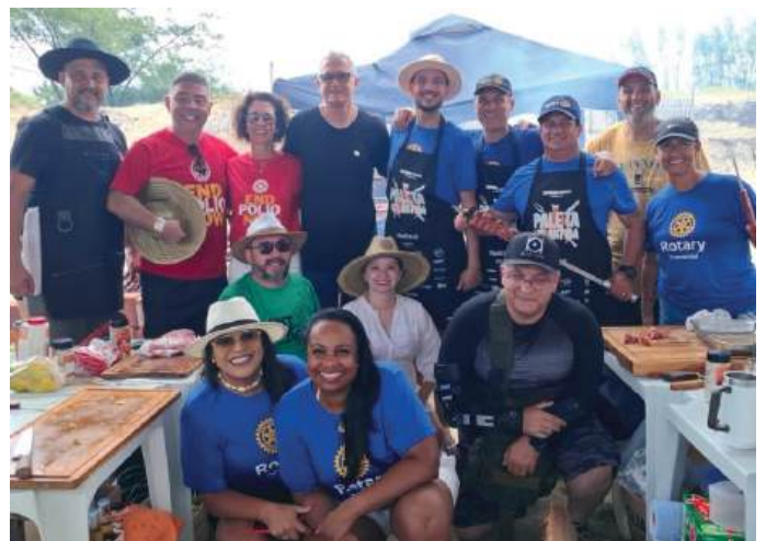
DISTRITO 4670: união dos Rotary Clubs de Canoas-Empreendedor, Tramandaí, Porto Alegre – Centenário, Cachoeirinha – Industrial e Nova Santa Rita