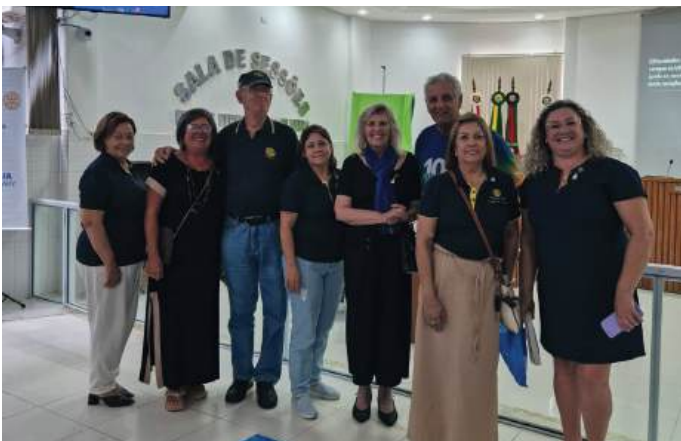
LINHA DE FRENTE: os rotarianos