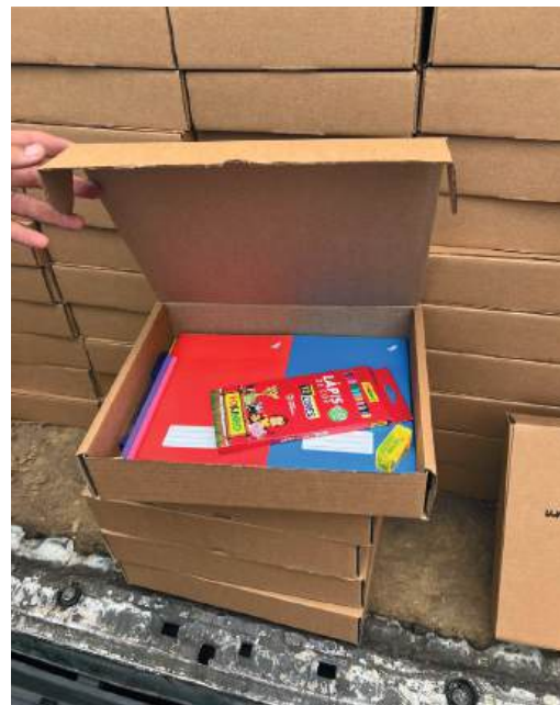
KITS: para a volta às aulas em Canoas