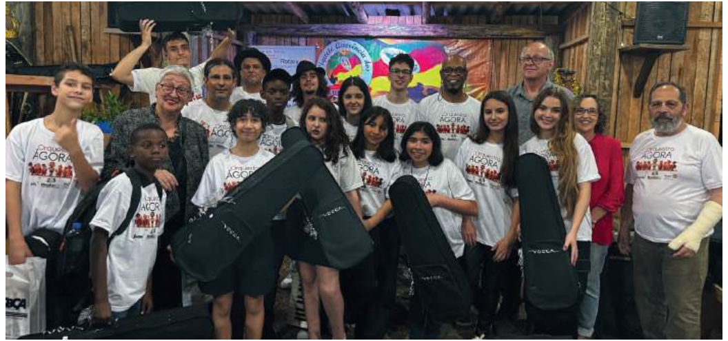
JOVENS: no caminho da música