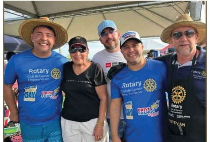
COMPANHEIRISMO: diversão garantida