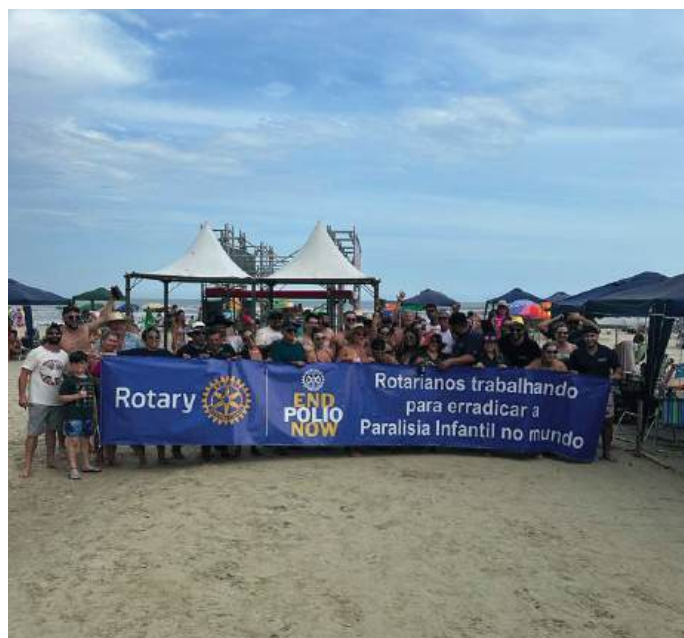
IMAGEM PÚBLICA: visibilidade e diversão

Amigos de fé, unidos pra lutar, No Paleta e na vida, prontos pra recomeçar. Rotary EMPREENDEDOR um exemplo de valor; na enchente ou na festa, o mais forte é o amor.