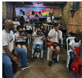
TALENTOS: proporcionaram uma noite mágica