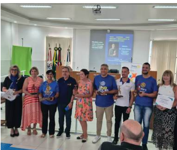
RECONHECIMENTOS: orgulho que estimula e inspira