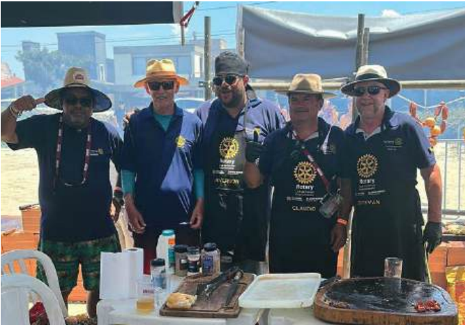
ROTARIANOS: preparam churrasco como todo o bom gaúcho