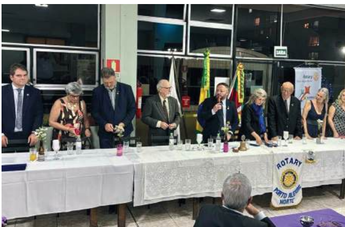
PRESTÍGIO: para receber a Governadora