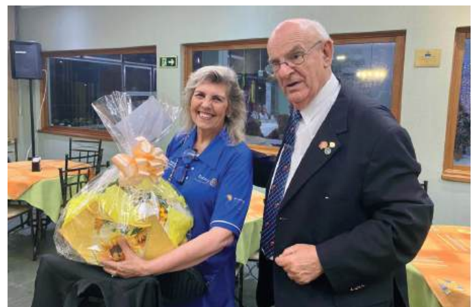
MIMO: agradecimento à Governadora