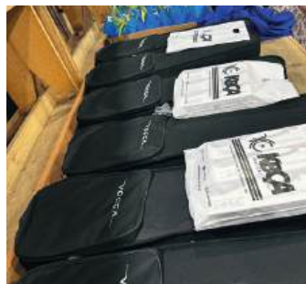
INSTRUMENTOS: para crescer o número de estudantes