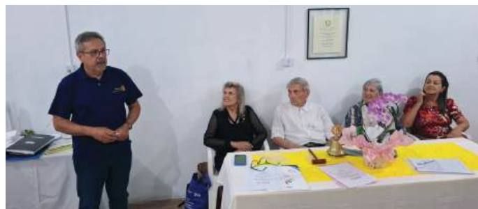
GOVERNADOR 2018-19 ILO: reforça a importância do crescimento