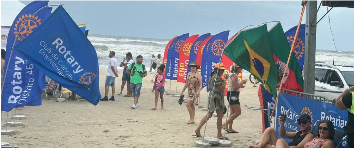
MARCA: identidade forte, que ganha destaque