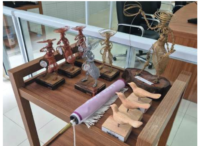
dezembro de 2024 para os clubes de Canoas - Empreendedor, Torres, São Leopoldo e Novo Hamburgo - Oeste.

Assim como os Certificados de Reconhecimento para os clubes com dois novos associados admitidos no fechamento do último trimestre correspondente a outubro, novembro e