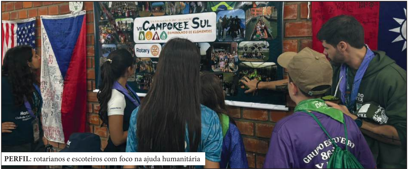
PERFIL: rotarianos e escoteiros com foco na ajuda humanitária