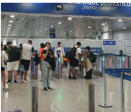
Azul no embarque para Fortaleza