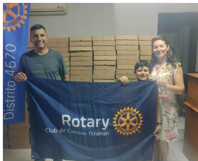
Clubs farão entrega em escolas do município