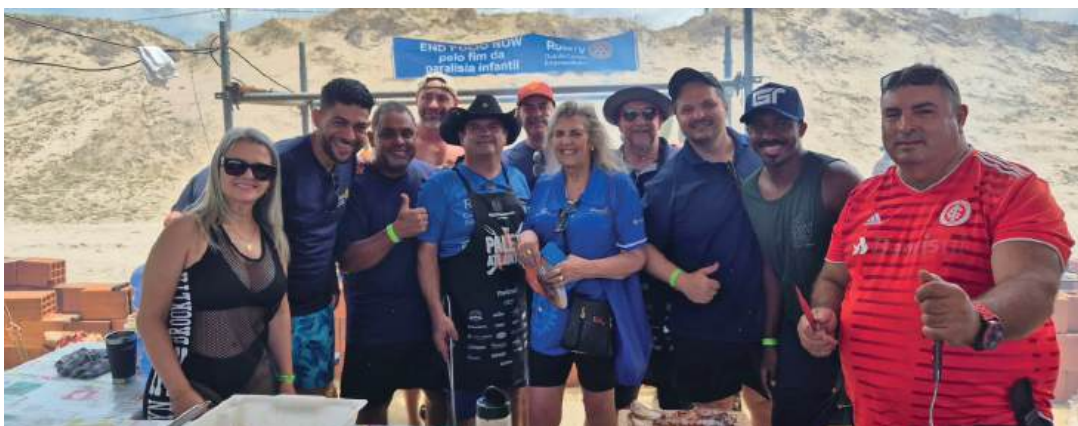
PRESTÍGIO: Governadora Rosana fortalecendo a participação do Rotary

gumas barracas, com churrasqueiras, de acordo com as normas do evento. A Governadora 2024-25 Rosana Opitz avalia a importância da presença Distrito 4670, pois alcança um público de diversas localidades que estão no Litoral. “Isso fortalece a nossa Imagem Pública e as milhares de pessoas que passam por lá, conhecem um pouco mais do que é Rotary”, afirma a governadora que prestigiou o evento, assim como prestigiaram autoridades do Estado, como o Governador Eduardo Leite, e demais personalidades.