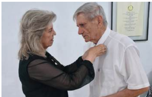
Governadora Rosana e o Presidente Rudi

dicação em manter o Rotary de Cidreira e os ideais rotários. Rosana diz que com o crescimento do clube se fortalecem as ações alcançando atendimento em maior número e qualidade às comunidades.