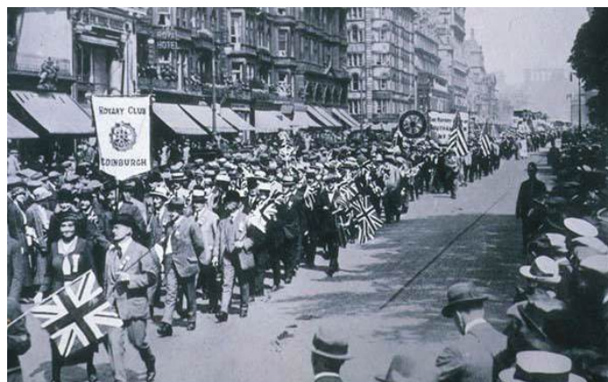
Rotarianos desfilam pelas ruas de Edimburgo durante a Convenção de 1921

dade: Rotarianos na Convenção de Edimburgo, Escócia, a primeira realizada fora dos Estados Unidos. Na ocasião, eles acrescentam a propagação da paz e da boa vontade internacional aos Estatutos do Rotary. A priorização da paz passa a constar do Objetivo do Rotary quando da sua aprovação na Convenção de 1922 em Los Angeles, EUA.