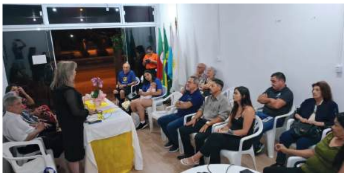
Reunião com participação de convidados