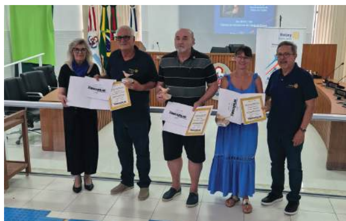
Clubes receberam certificado Desafio Farroupilha da Fundação Rotária e o troféu “Passarinho”

reforçou “que prováveis conflitos podem acontecer ou já aconteceram e a conversa com assessor jurídico, apontou caminho para amenizar de forma orientada a condução dos mesmos”.