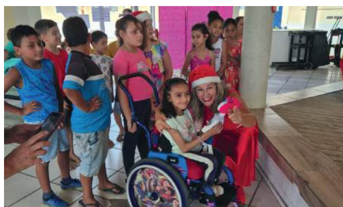
ALEGRIA: data que une as pessoas