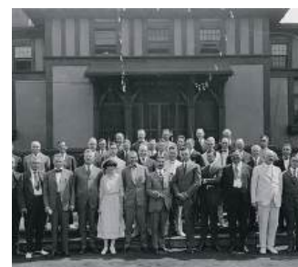
Participantes da Assembleia Internacional de 1920 em Chicago

go seu primeiro treinamento anual para líderes entrantes, chamado atualmente de Assembleia Internacional. A prática continua até hoje, construindo pontes entre líderes eleitos do Rotary de todas as partes do mundo.