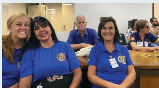
ORGULHO: rotarianos participam da plenária do 24º FSMPI