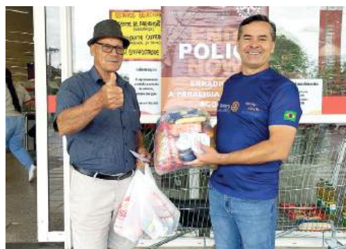
DOAÇÕES: alimentos para a cesta de Natal