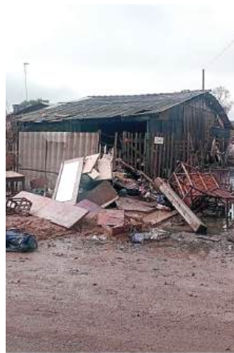
DESTRUIÇÃO: as águas recuaram, mas nada restou