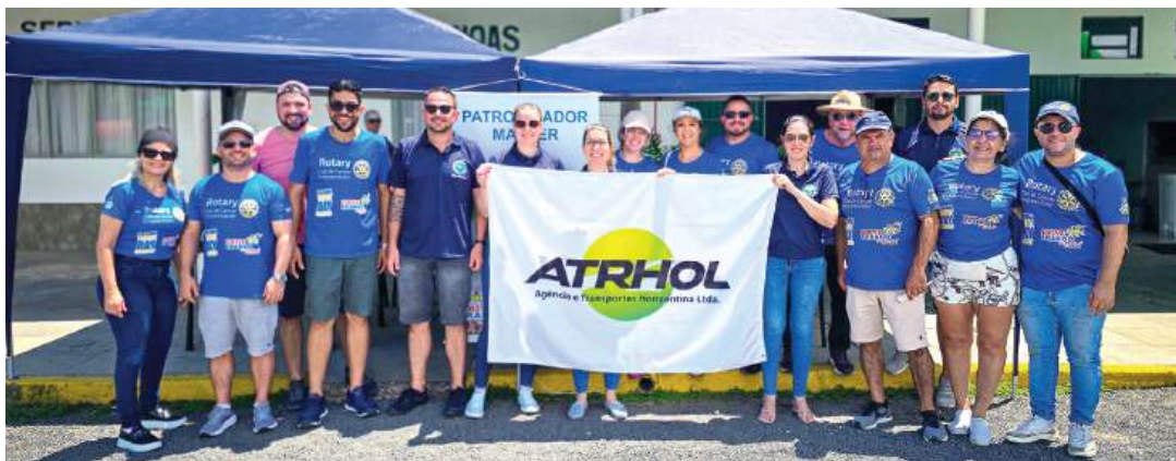
AÇÃO: aconteceu nas dependências da ASMC - Associação dos Servidores Municipais de Canoas