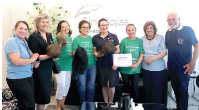
Banco de Perucas