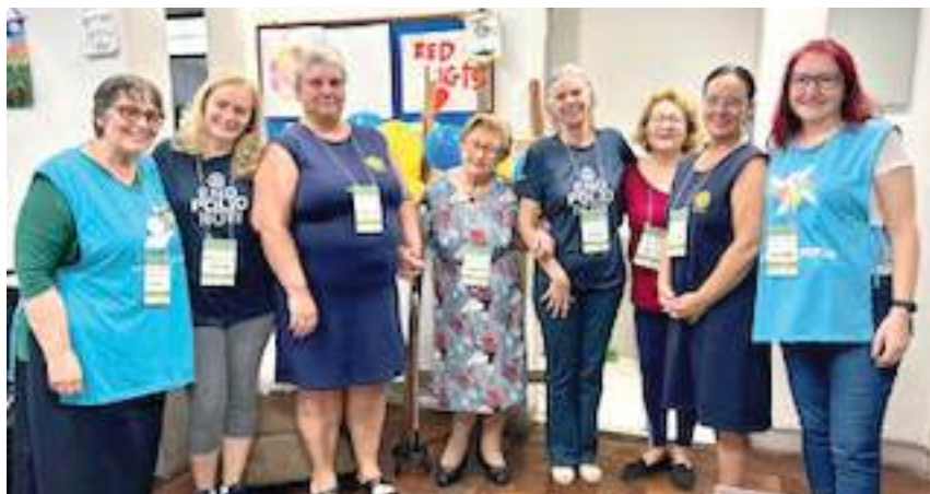
Casa Violeta: Rotarianos e o Cataventus