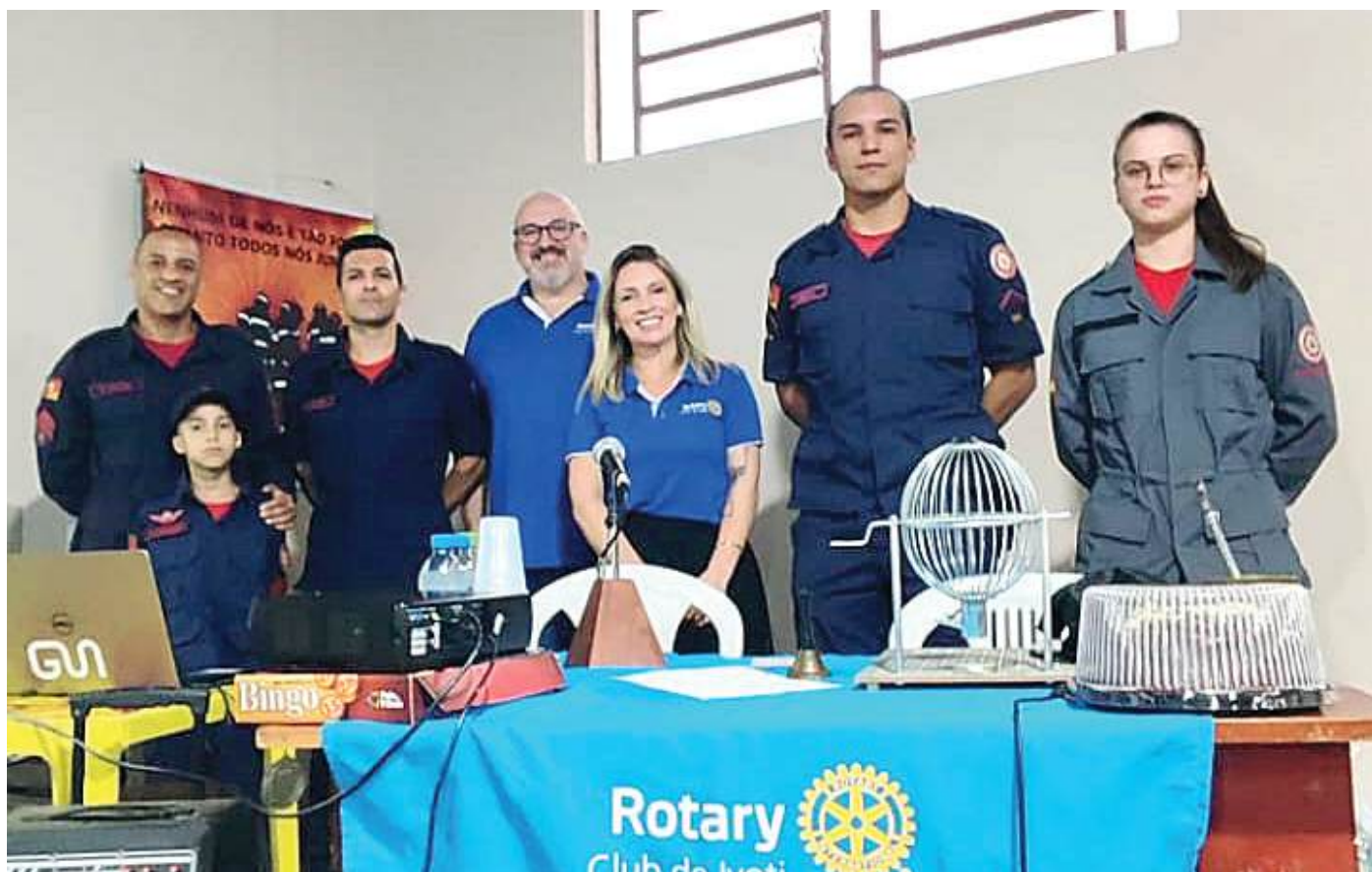
BINGO: recursos para a compra da Serra