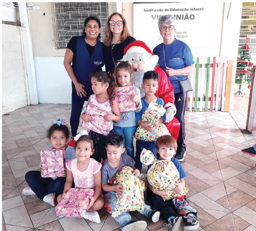
Creche Vila União, atingida pela enchente, está sendo reconstruída