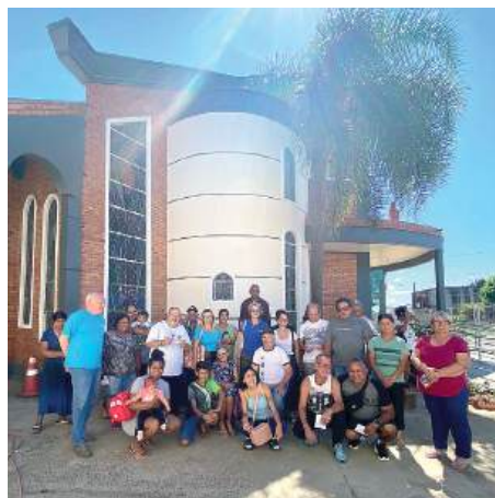
UNIÃO: força multiplicada