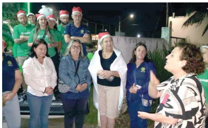
AGRADECIMENTO: a escolha levou orgulho à escola