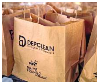
Drive para saborear em casa