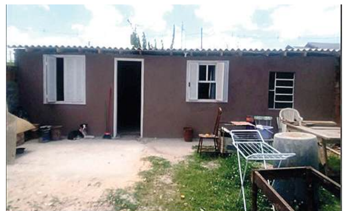
REFORMA: para recomeçar