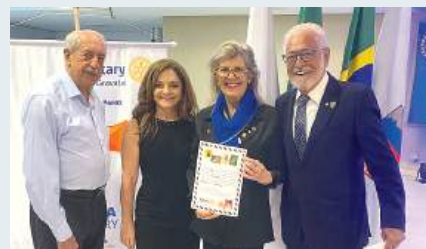
SELOS: doações chegam de todos os Estados