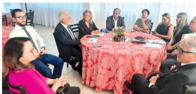
Assembleia com os companheiros