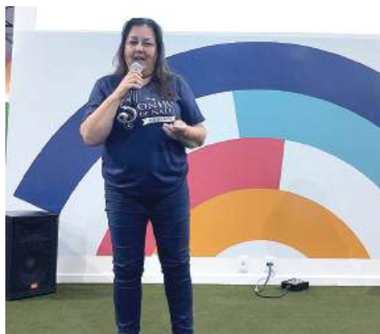
COMPANHEIRA: a importância para a comunidade