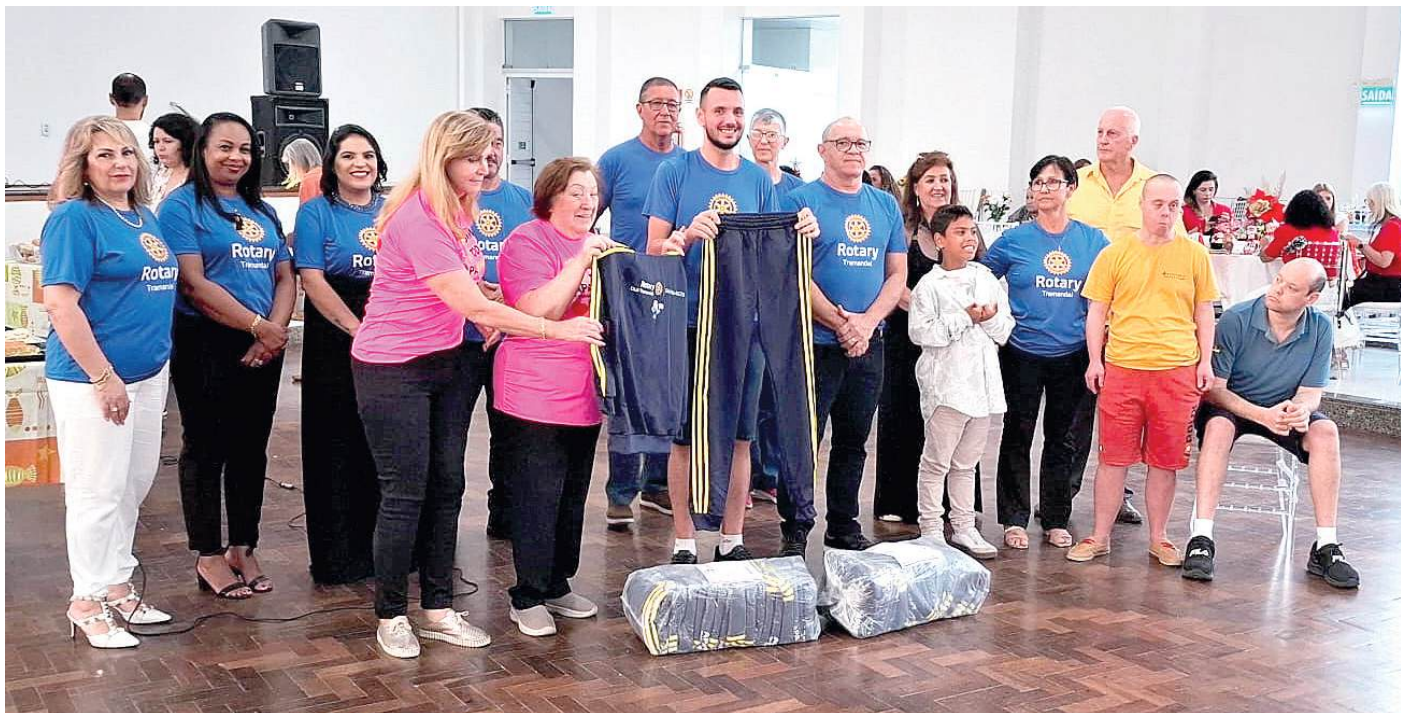
IMAGEM PÚBLICA: uniformes com a marca Rotary