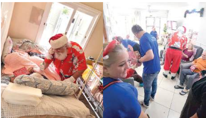
Lares dos Idosos e a alegria dos companheiros