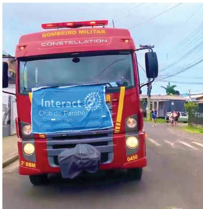
ALEGRIA: caminhão que encanta a criança