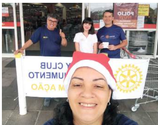
ROTARIANOS: a união faz a força

No sábado, 14 de dezembro os companheiros do Rotary Club de Novo Hamburgo - Monumento passaram o dia realizando, em três mercados, a Ação por uma Missão. A tarefa foi a arrecadação de alimentos para ajudar a Instituição Joana de Ângelis que atende 180 crianças. Com os alimentos foram montadas cestas para o Natal das famílias das crianças.