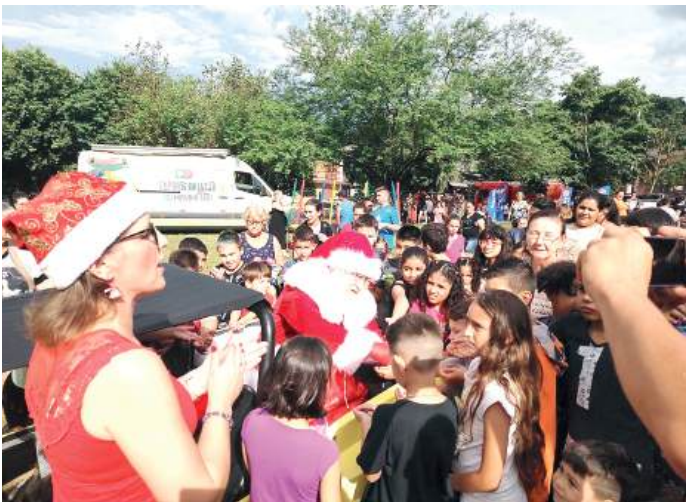
Crianças aproveitaram para abraçar o Papai Noel