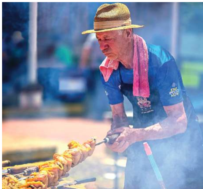
ASSADOS: 5.400 peças