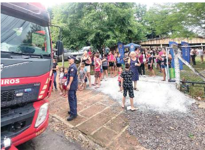
EMOÇÃO: a magia do Caminhão dos Bombeiros