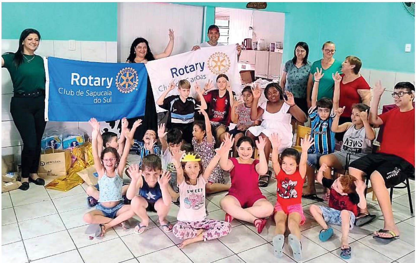
FESTA DE NATAL: e a alegria das crianças

Os clubes estão abertos para muitos outros projetos em parceria.