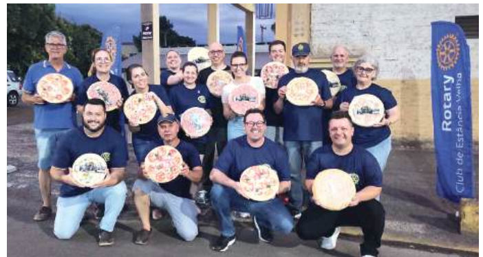
PIZZAS: mutirão de sucesso

“Agradecemos a todos que contribuíram e fizeram parte dessa ação solidária. Juntos, estamos fazendo a diferença na vida de muitas crianças neste Natal de 2024. Os companheiros agradecem a toda a comunidade pelo apoio”, comemoram os rotarianos do Estância Velha.