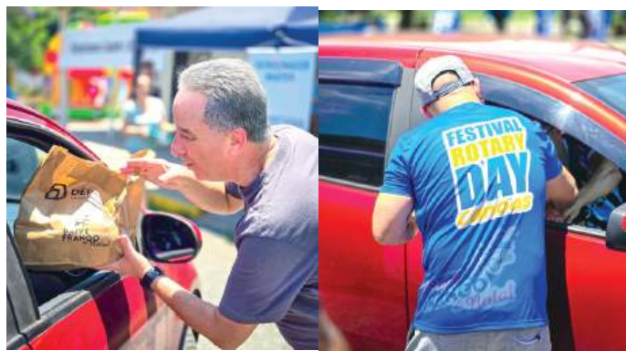
RETIRADA: mobilização também na entrega