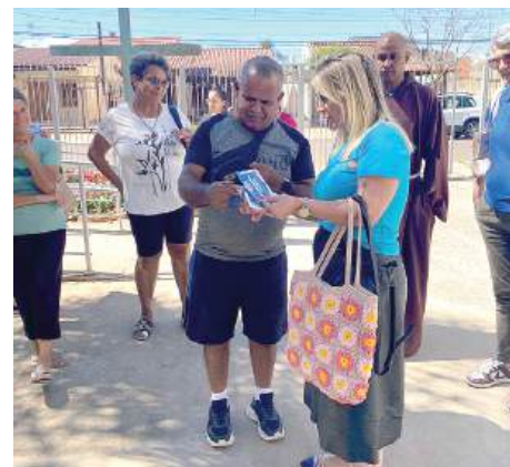
ENTREGA: nas mãos da comunidade