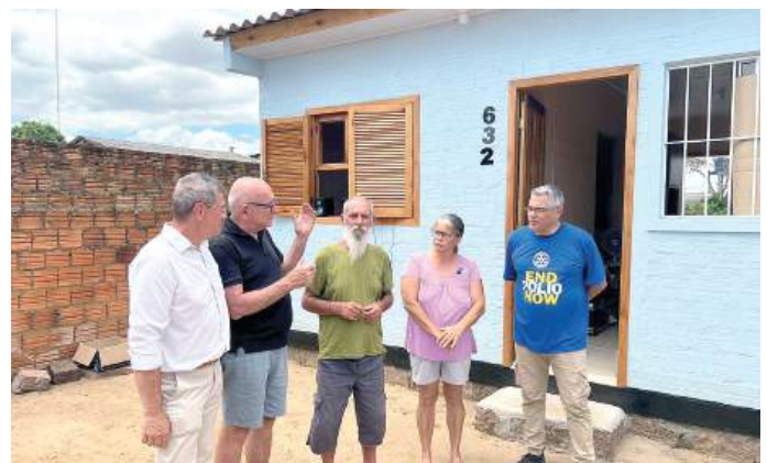
ENTREGA: casa nova para a volta ao lar