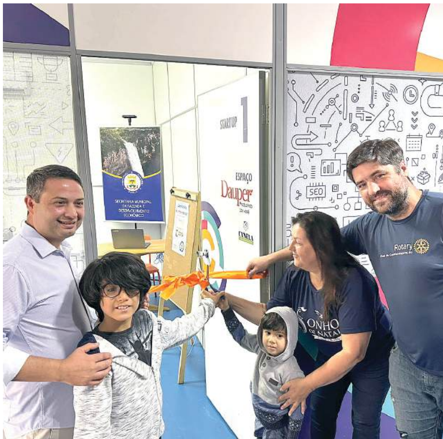
INFORMÁTICA: portas abertas para o futuro