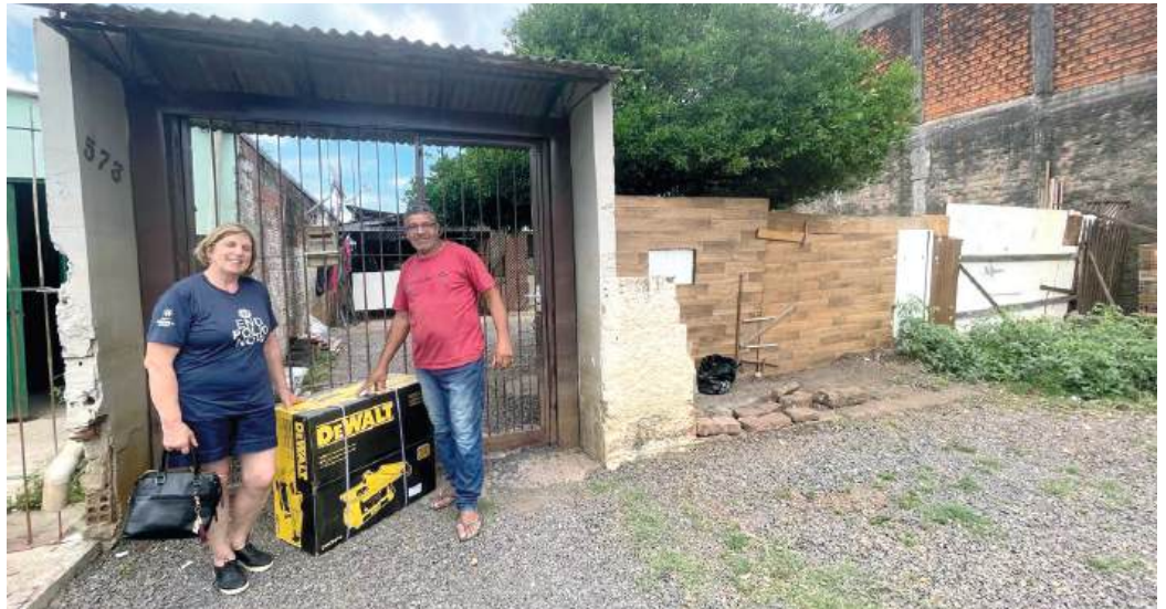
RECOMEÇO: um ponto de partida

Com a contribuição da Associação Movimento Próximos Passos composto por Abicalçados, Assintecal e CICB, no valor de R$ 134.269,32, através do Projeto Próximos Passos, foram atendidas mais 38 famílias. As doações incluíram itens domésticos e recursos para auxiliar famílias retornarem ao trabalho. As profissionais em manicure, confeitarias e marcenaria receberam os equipamentos para retomar suas atividades econômicas. Uma criança de 4 anos recebeu em dezem-