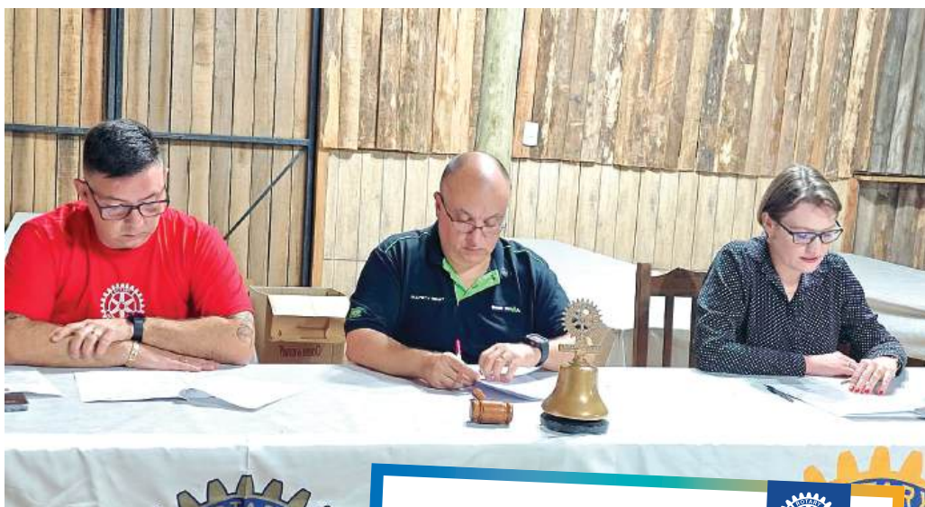
REUNIÕES: com todas as formalidades rotárias

Para realizar ações em benefício às instituições, nas áreas da educação ou saúde por exemplo, no município, ele diz que farão a partir de projetos, e buscarão subsídios oficiais disponíveis le-