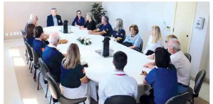
Visita ao Hospital

O roteiro se encerrou com a inauguração do novo Marco Rotário do clube, instalado na rótula da Avenida Itacolomi com a Jorge Amado, em frente ao novo Centro Administrativo do Município onde estão concentradas diversas secretarias municipais, além dos gabinetes do prefeito e do vice.