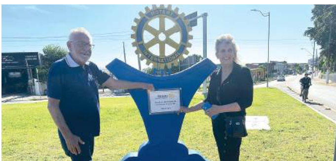
Inauguração do Marco Rotário