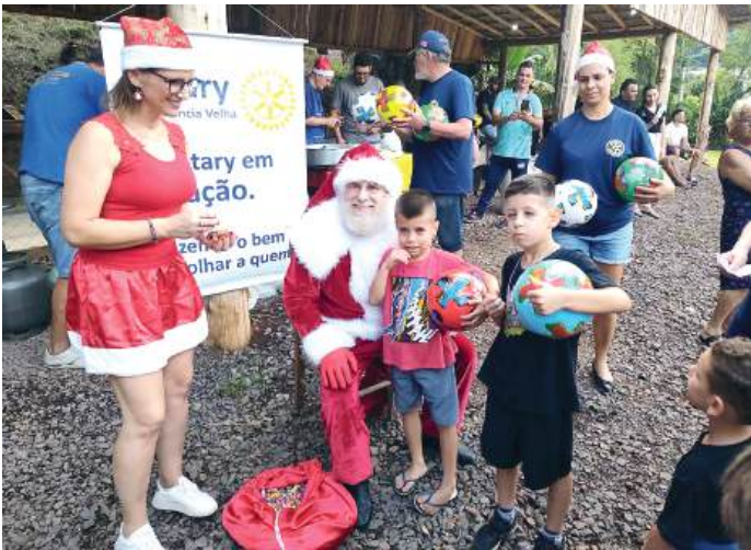
BOLA: presente para todas as idades