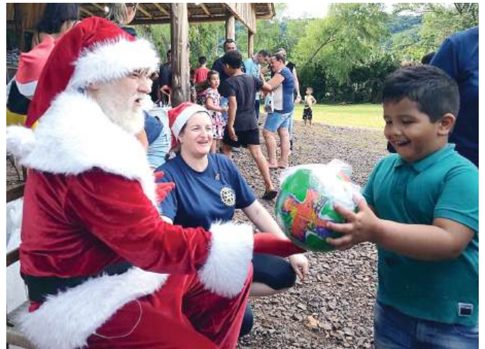
Alegria em receber