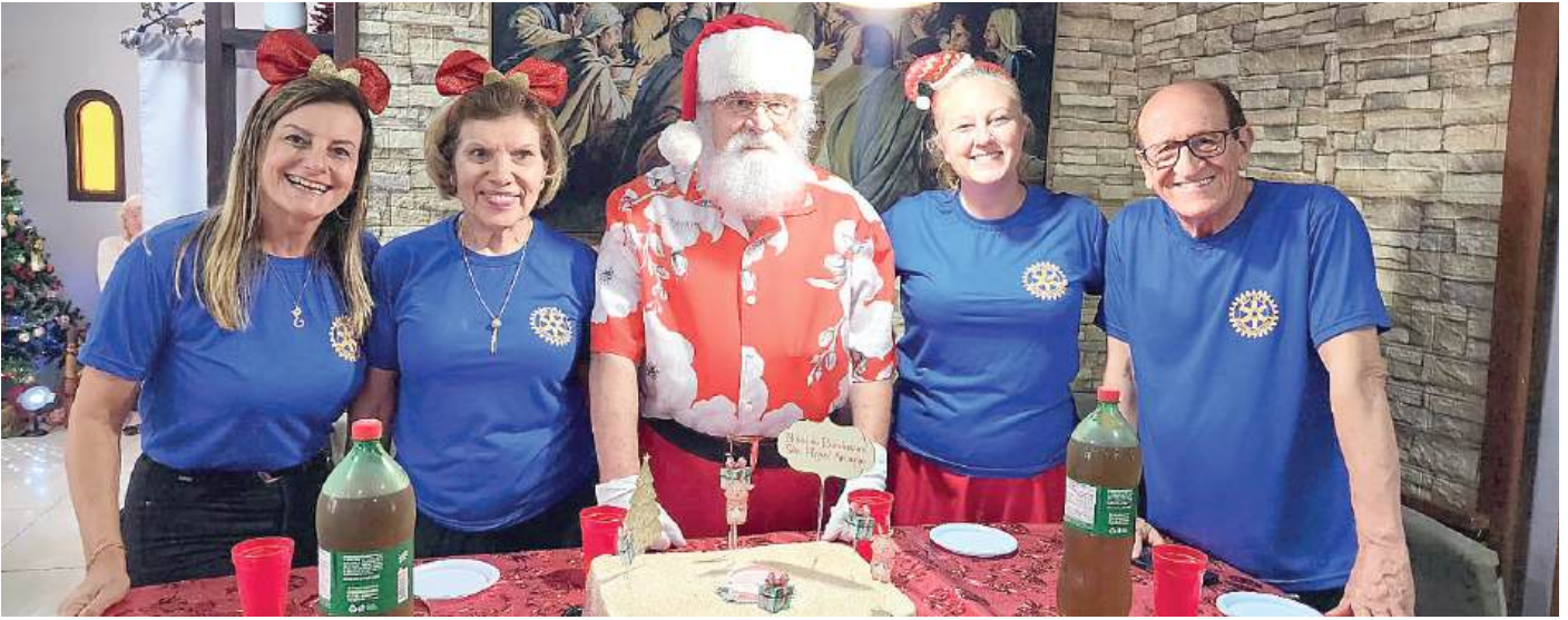
CLUBE DE CAUSA: lares dos idosos são atendidos o ano todo