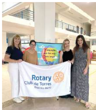
ATENDENDO: necessidades do mágico mundo do Natal