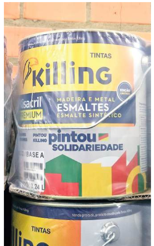
PARCERIA: estendendo as mãos