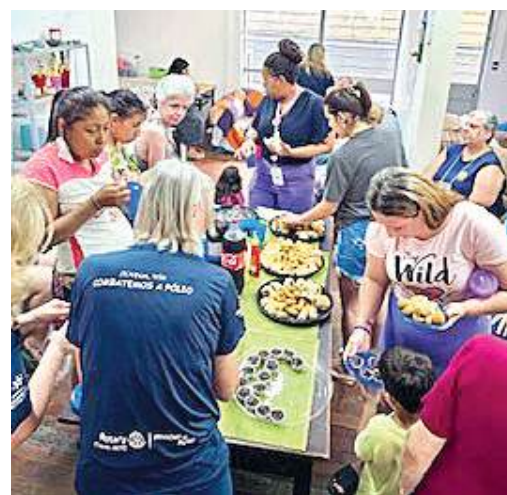
QUITUTES: sempre bem-vindo