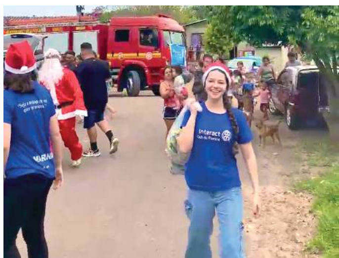
MAGIA: Natal e seus encantos