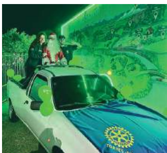
CONECTA: percorrendo as ruas da cidade