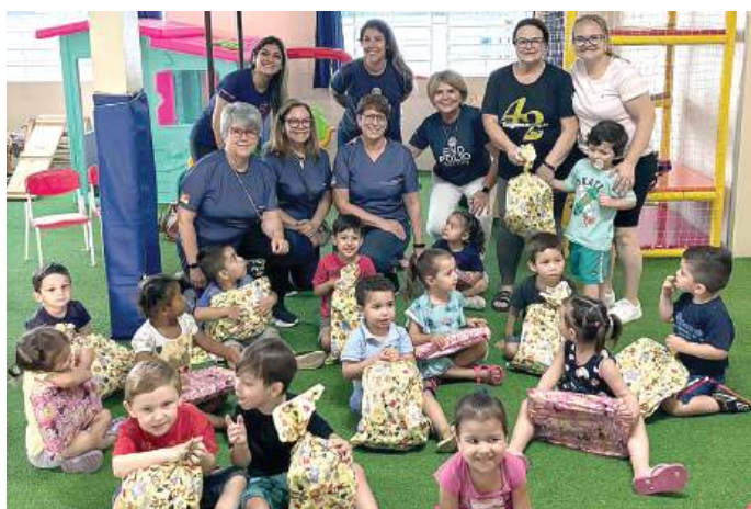
Anjinho da Guarda, Sarandi, também atingida pela enchente