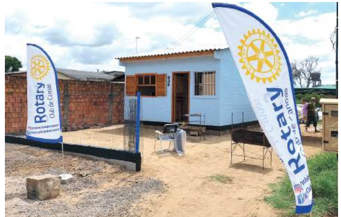
ROTARY CLUB DE CANOAS: A Magia do Rotary