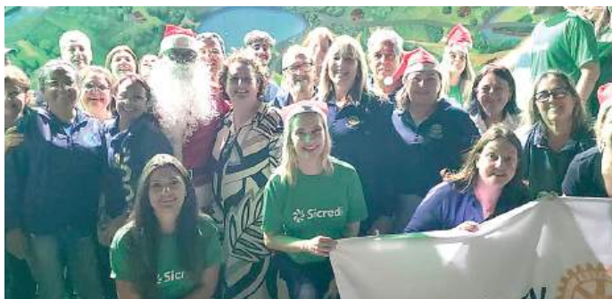
ROTARIANOS: parceria que levou a magia