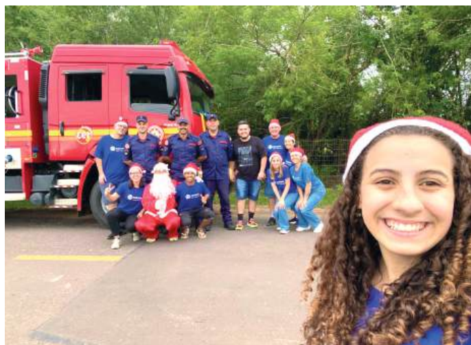
PARCERIA: Bombeiros e interactianos