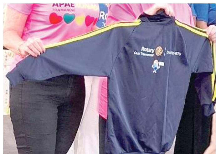
ENTIDADES: ação conjunta