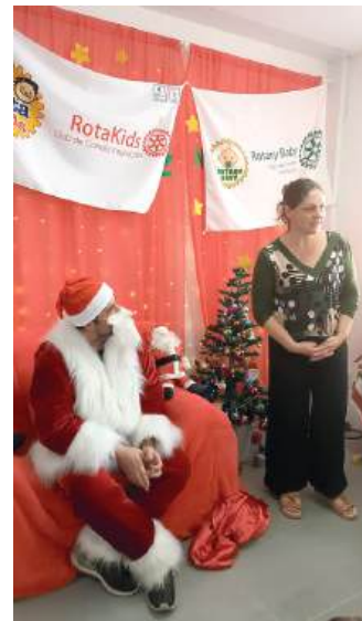
HISTÓRIA: crianças e presentes