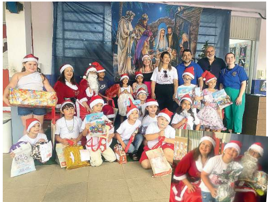
ESPECIAL: um dia de muitas surpresas e alegrias