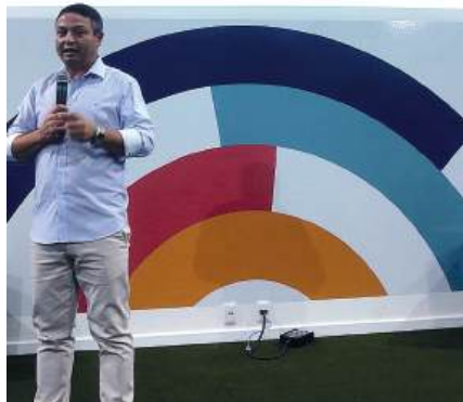
RECONHECIMENTO: certeza do benefício para todos