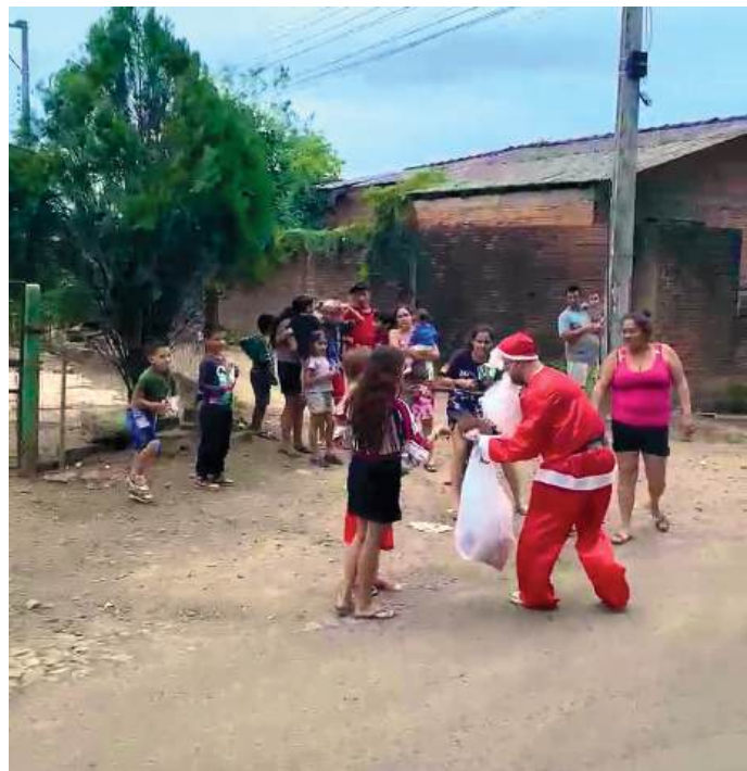
PESSEANDO: presentes para todos

los jovens, os interactianos entregaram brinquedos, pipocas, balas e cachorros-quentes. Eles contaram com o apoio do Corpo de Bombeiros que disponibilizou um caminhão para alegrar as crianças. A família rotária, juntamente com o Corpo de Bombeiros da cidade, levou a magia do Natal às crianças.