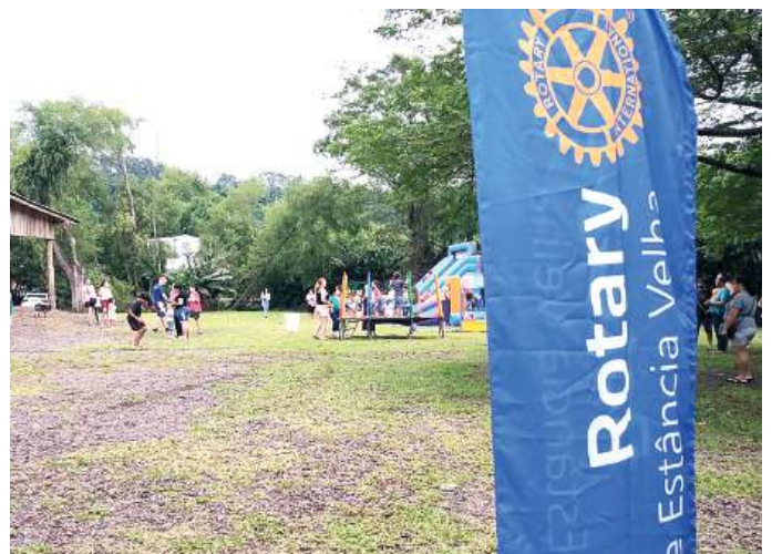
IMAGEM PÚBLICA: sempre necessária