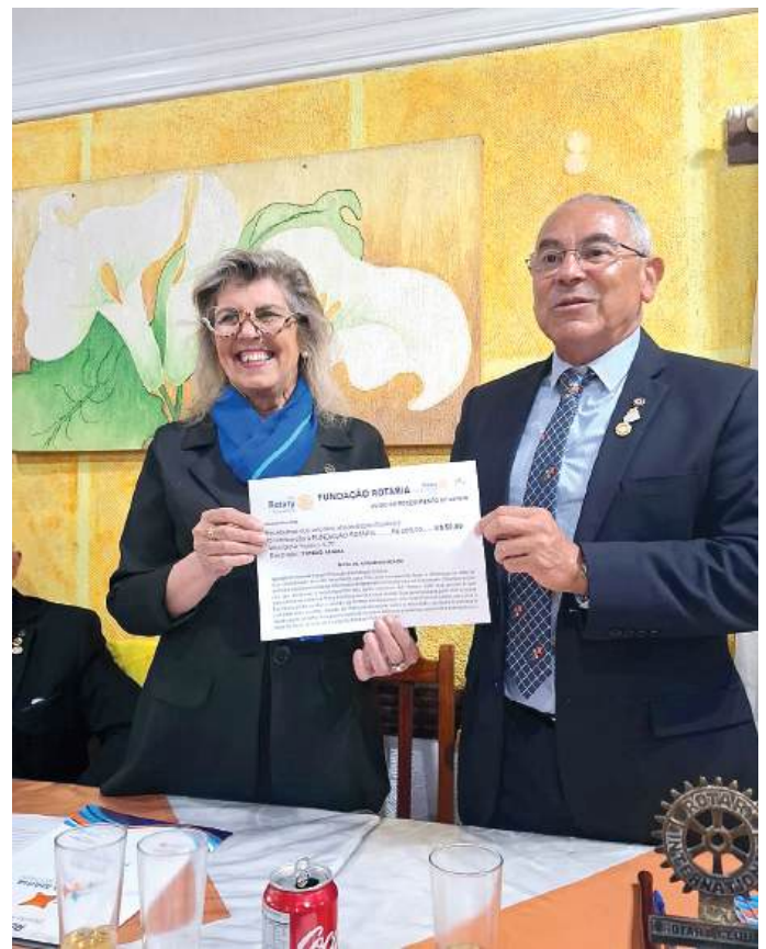
FUNDAÇÃO ROTÁRIA: presente sempre bem-vindo