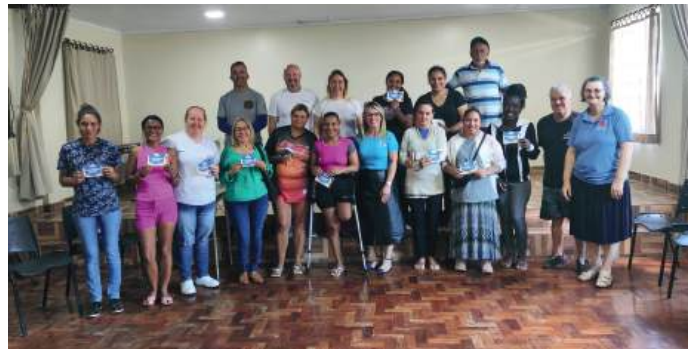
Rotary Club de Ivoti: ajudar é missão rotária

Rotary Club de Fiorenzuola D'Arda e da França, R$ 23.000,00, foram convertidos em vouchers das Lojas Taqi.