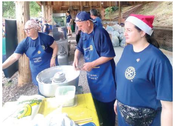
ROTARIANOS: mãos incansáveis