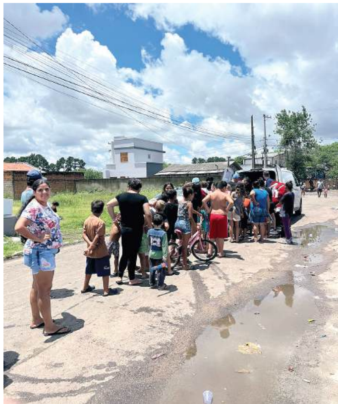
AJUDA: parcerias e solidariedade