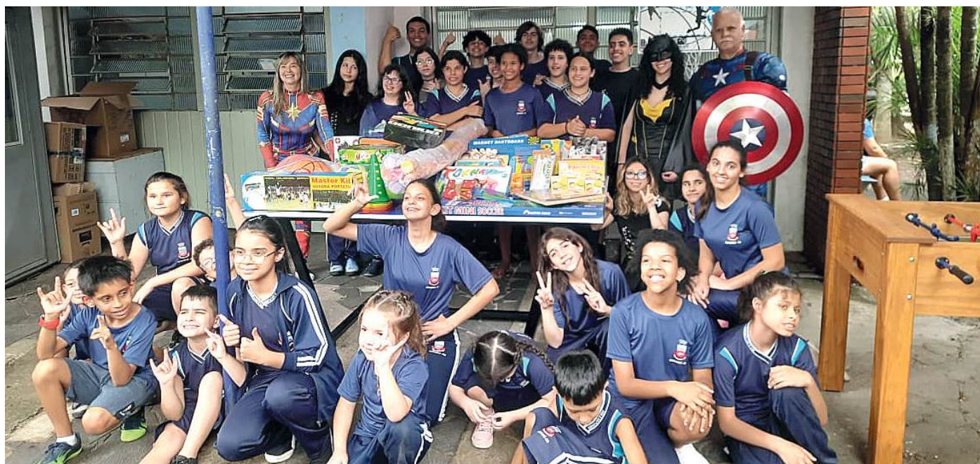
MAGIA: crianças e adolescentes da Escola e os personagens

equipamentos tão aguardados pela diretoria da escola. Ele também agradeceu a parceria com o Sintracergs que contribuiu para a realização da atividade.