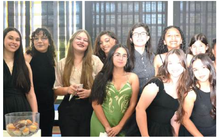
Grupo de formandas do projeto