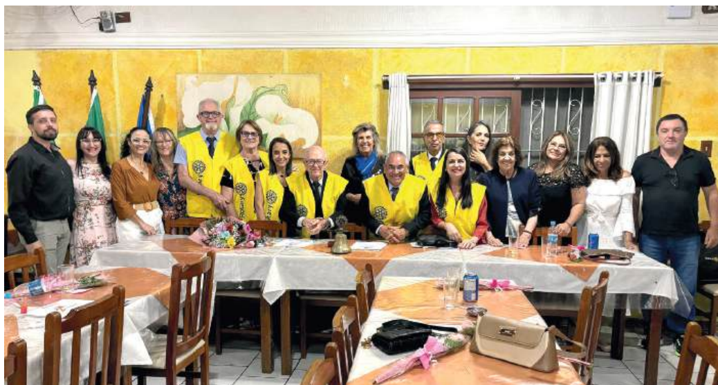
GOVERNADORA: alegria e festividade para receber