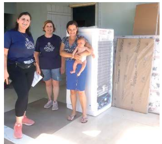
AJUDA: toda ela é bem-vinda

Dentro do projeto “Próximos Passos”, algumas famílias também foram contempladas com material de construção, para reparos em suas casas,