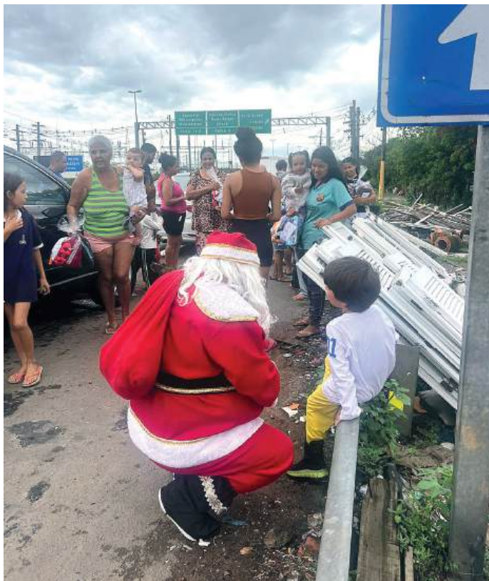
PAPAI NOEL: a Magia do Natal