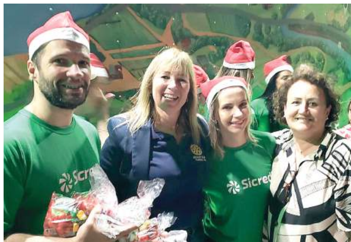
ROTARIANOS: parceria com Sicredi faz a alegria das crianças