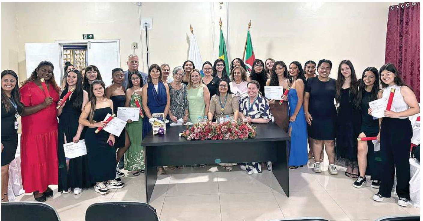
Rotarianos e profissionais do Senac e do Colégio