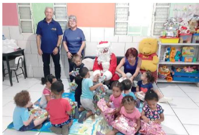
Escola de Educação Infantil 3 Corações, Vila Bom Jesus