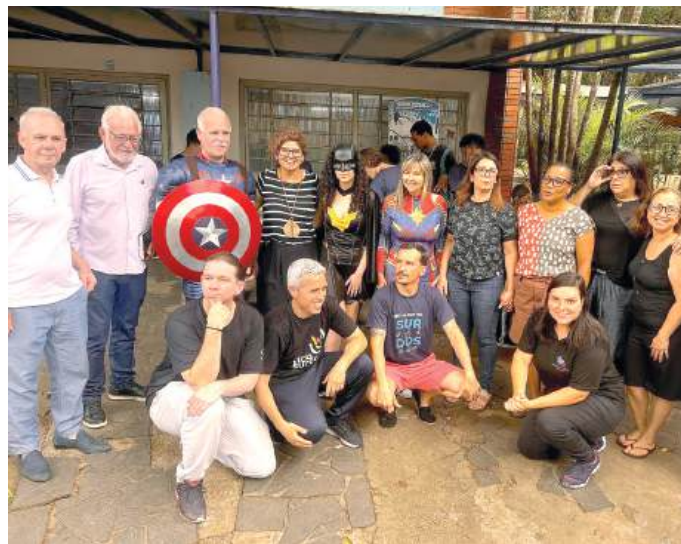
Super-Heróis com a direção e profissionais da Escola