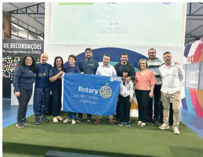
ROTARY: agradecimento pela parceria