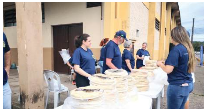
APOIO: comunidade sempre atuante