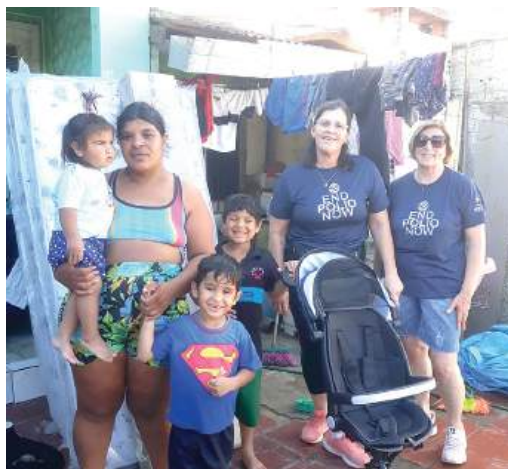
FAMÍLIAS: necessidades básicas

bro uma cadeira de rodas, especialmente fabricada para atender suas necessidades. A cadeira permite a criança frequentar a escola e sentar-se à mesa.