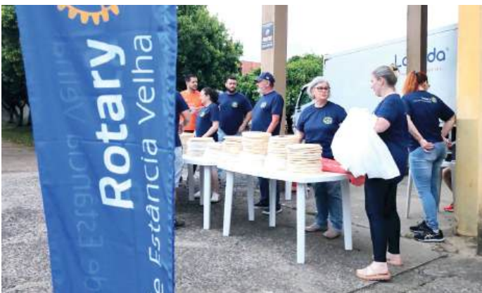
EQUIPE: todos com a mão na massa