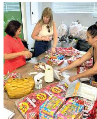
GULOSEIMAS de todos os sabores