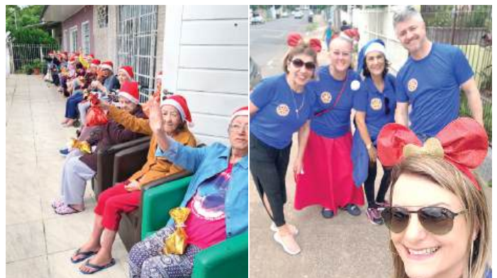
NATAL: sempre um encanto