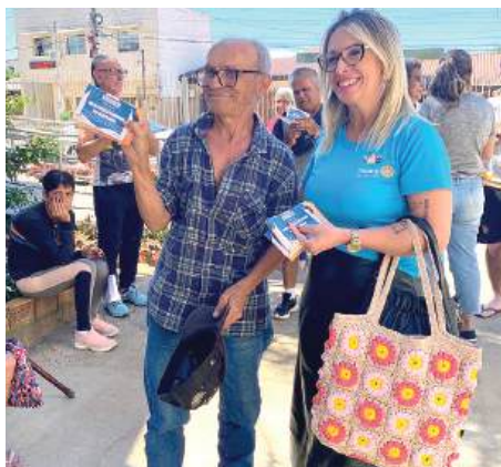
ALEGRIA: de quem dá e de quem recebe