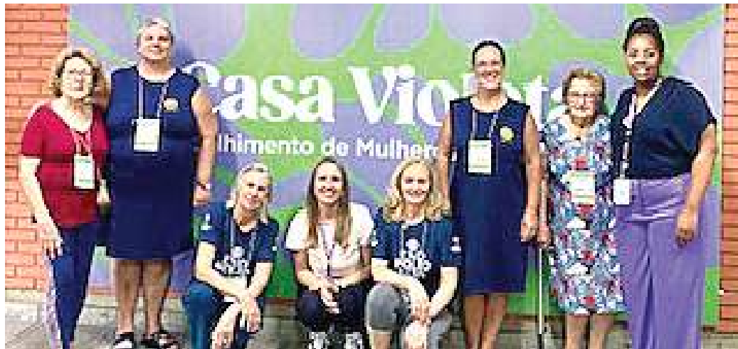
CARINHO: união fortalece a campanha

A Casa Violeta é um espaço de acolhimento de mulheres e crianças, em situação de vulnerabilidade, que foram atingidas pelas enchentes. Iniciou suas atividades em Porto Alegre no dia 29 de maio de 2024. Mais informações sobre a Casa Violeta em < https://search.app/c5ub4Kg4yQVb3FgB6 >.