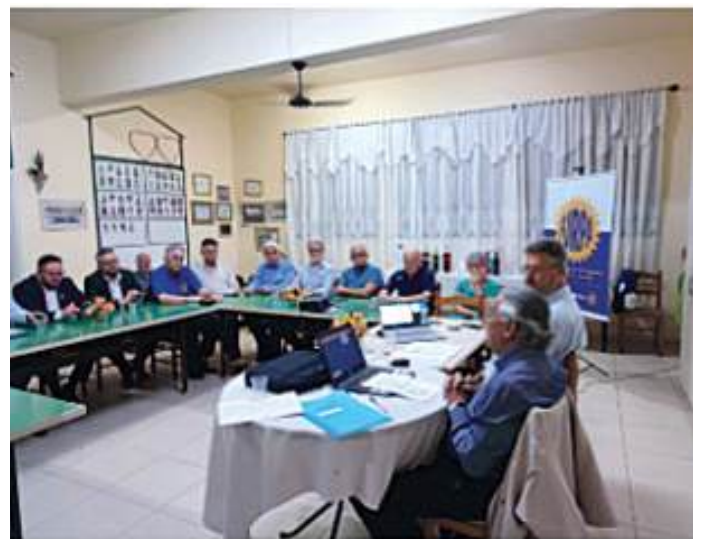
FURPA abrange os Distritos 4670 e 4680

O evento teve a participação de 35 companheiros, entre presidentes e representantes de clubes da capital, que assistiram relato das inúmeras e significativas realizações da FURPA, durante o período de 2022-24, que se encerra neste ano.