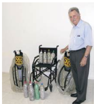
CADEIRAS: venda de Lacres e tampinhas plásticas