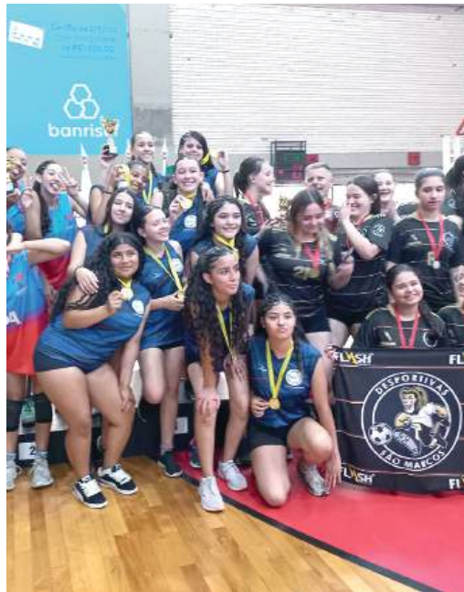
ATLETAS: a alegria da vitória

No mesmo dia, de muito movimento e ações, os rotarianos também participaram do Sábado Solidário.