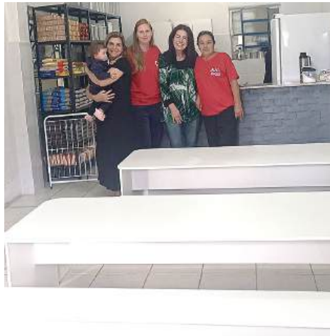
AJUDA: para um recomeço seguro

A instituição, localizada no bairro Scharlau em São Leopoldo, foi severamente atingida pela enchente de maio, perdendo a totalidade de seus equipamentos. A doação do mobiliário vai garantir que as quase noventa crianças atendidas façam suas refeições e atividades num ambiente adequado.