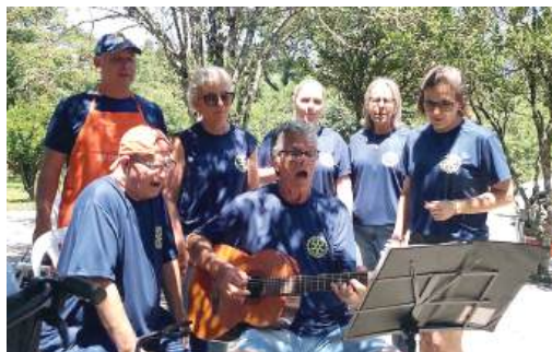
MÚSICA: alimento para a alma

“Agradecemos a todos que participaram e ajudaram a tornar este dia memorável. Juntos, continuamos a fazer a diferença na vida das pessoas da nossa comunidade”, comemoram os rotarianos.