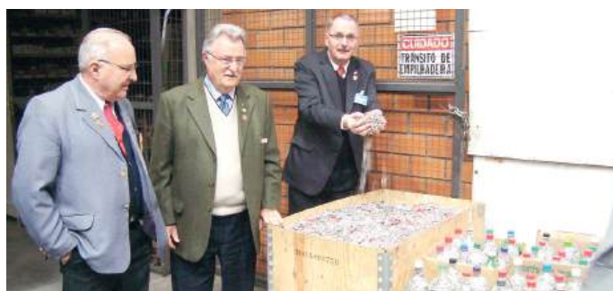
VOLUME: necessário armazenamento