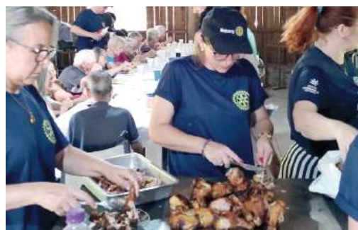
PREPARO: cuidado e dedicação