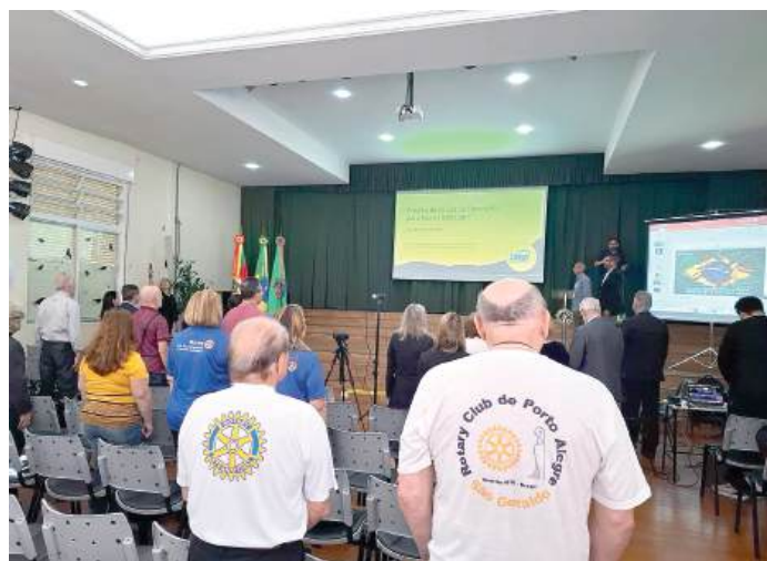
COMPANHEIROS: na luta pela preservação do planeta