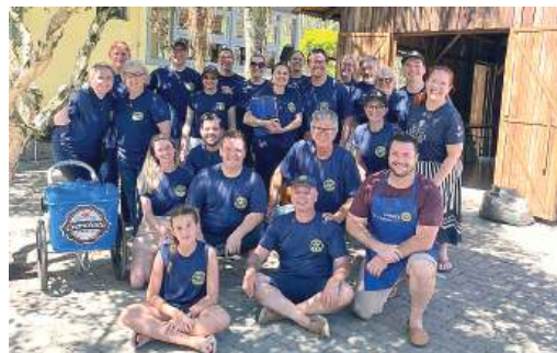
UNIÃO: fazendo a diferença