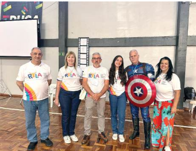
COORDENAÇÃO: equipe de rotarianos