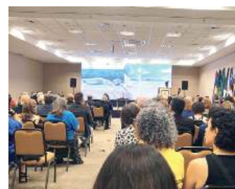
TRÊS DIAS: assuntos diversos e troca de experiência