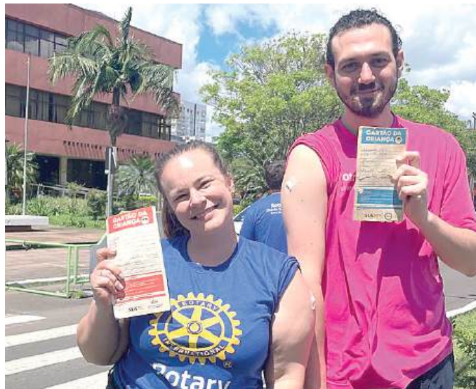
FOLDER: informações para levar para casa

“Com a união de esforços, continuamos avançando na erradicação da poliomielite, reforçando o compromisso rotariano com um futuro saudável e livre da doença”, afirmam os companheiros.