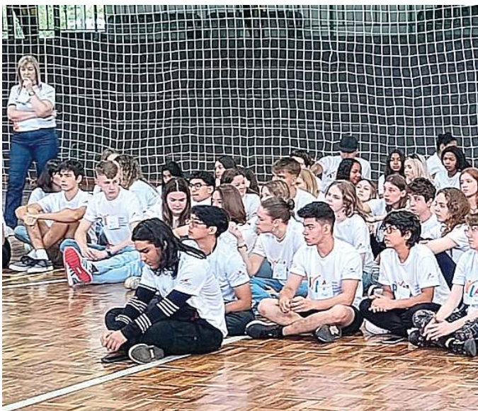
VIVÊNCIAS: portas que se abrem