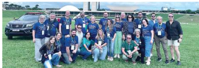
Rotarianos na 43ª Conferência da ABIJ

- A importância da voz da juventude rotária no mundo, e qual o papel do conselho consultivo de juventude do Rotary International; Intercâmbio e inclusão: a arte de navegar, barreiras culturais e desafios de gênero; Corel - importante notícias, gerenciamento e estrutura; Resolução de conflitos – características de mediadores e bons resultados; Sessão roda de conversa: barreiras e pontes; Paridades de vagas no Brasil; Processo classificatório/ seletivo; Programa de Intercâmbio: edital, modalidades de provas, avaliação psicológica, processo de escolha de vagas, e muitos outros.