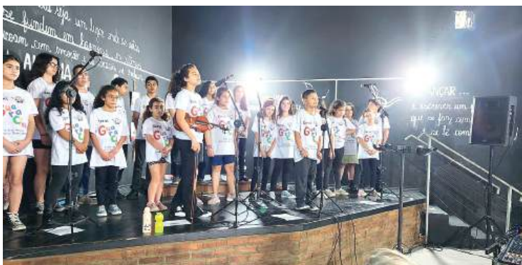
Coral da Escola de Música Guaracyra Ramos Kraemer