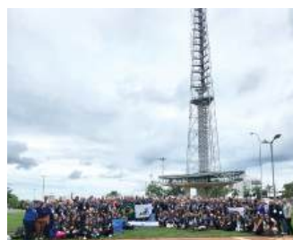
Companheiros do Brasil e do mundo, reunidos em Brasília