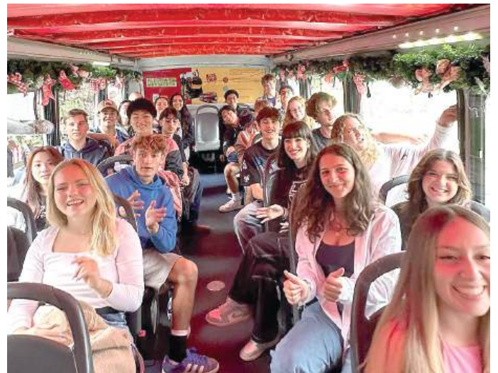
BROCKER TURISMO: doou passes de Bus Tour para toda a galera