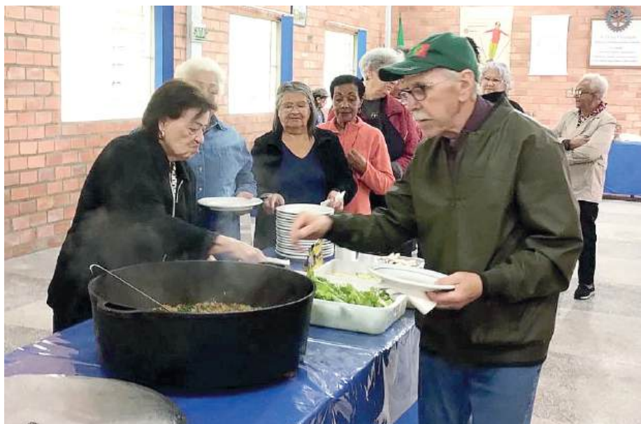
CONFRATERNIZAÇÃO: com alegria