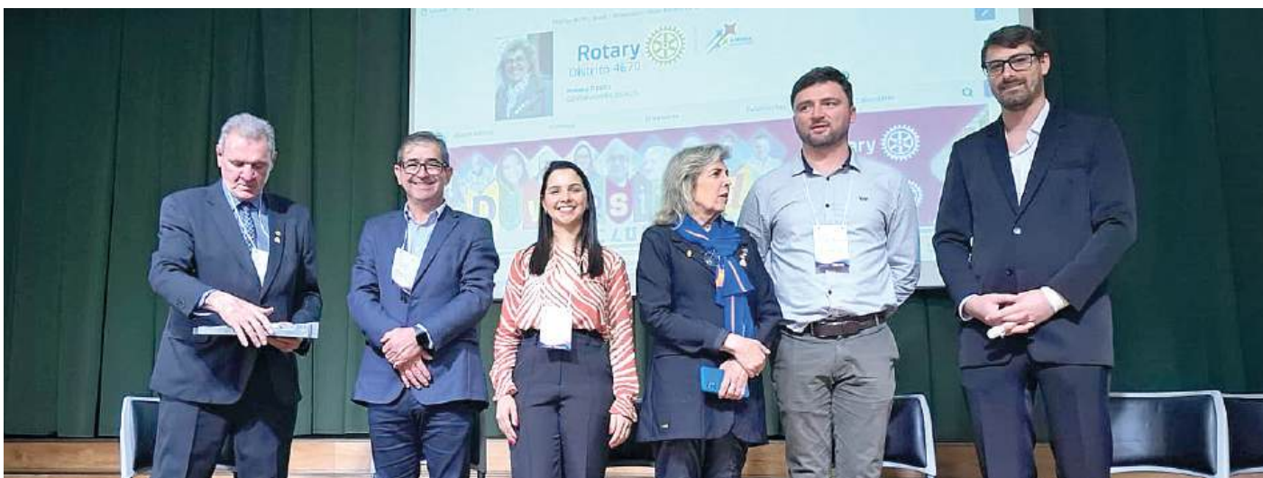
PALESTRANTES: profissionais que cuidam do meio ambiente