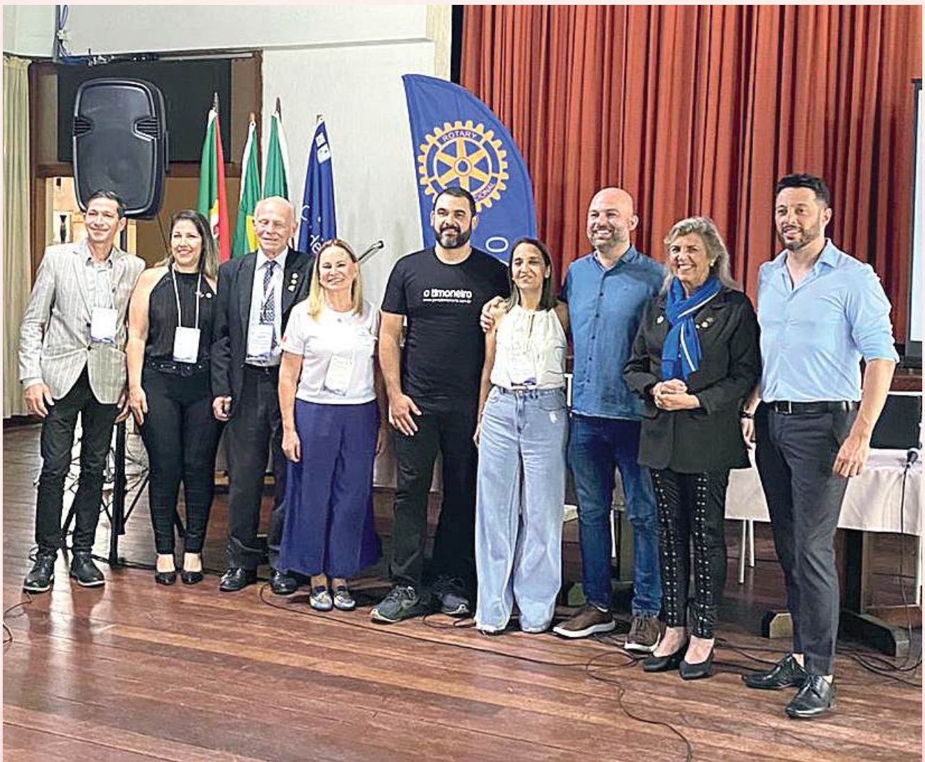
IMAGEM PÚBLICA: profissionais fazem palestras. Evento foi híbrido, transmitido pela plataforma YouTube

Seminário aconteceu no CEPE Canoas, sábado, 30 de novembro, reuniu profissionais rotarianos e do mercado, apresentou a importância da marca e como a instituição pode crescer quando a linguagem propicia a integração do Rotary com a sociedade.