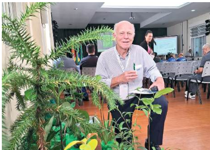
INGO: forneceu as mudas