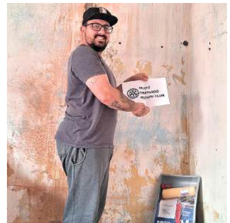
RECONSTRUÇÃO: em fase de recuperação de suas casas