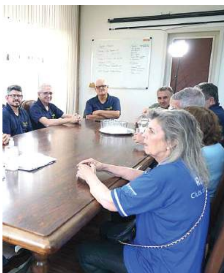
Reunião na prefeitura

Cerca de 70 pessoas participaram do evento, entre elas, destaques profissionais de anos anteriores, amigos e familiares, clubes de Imbé, Osório e Novo Hamburgo-Inclusão e todos os companheiros do Santo Antônio da Patrulha.