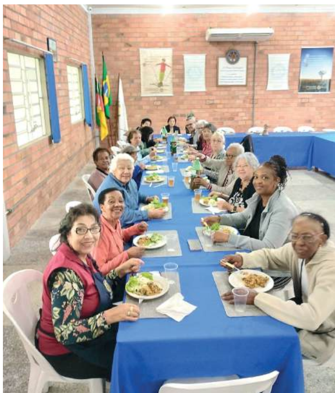
ALMOÇO: união e prazer