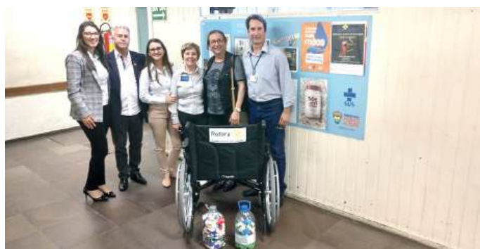
INSTITUIÇÃO: necessidade permanente