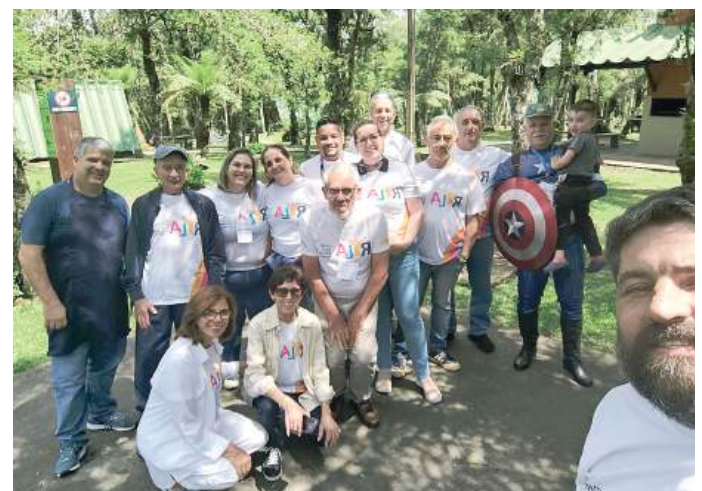
FOCO: todas as possibilidades para os jovens