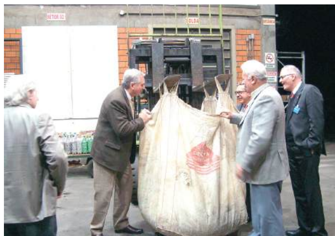
2011: início da campanha de arrecadação

Em 2014 foi necessário um ano para vender 1.323 kg à Brutt correspondendo a 14 cadeiras. Para efeito organizacional criou-se uma Regulamentação da Campanha dos Lacres e todos os clubes do Distrito conheceram a nova campanha.