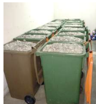
ESTOQUE: garante a compra das cadeiras de rodas