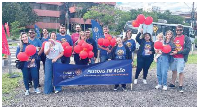
REFORÇO: família rotária unida