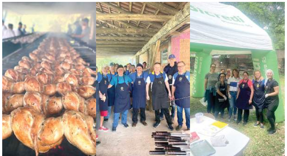
FRANGO: 1500 unidades vendidas com união e força dos companheiros

O trigésimo ano que o Rotary Club de São Leopoldo – Sul realiza a ação Meio Frango e com sucesso. Este ano foram vendidas 1500 unidades. “Nosso agradecimento à comunidade de São Leopoldo e ao nosso apoiador Sicredi Pioneira”, afirmam os companheiros.