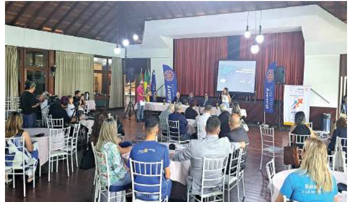
IMAGEM PÚBLICA: comunicação ao vivo transmitida pelo Youtube

to híbrido, presencial e com Live no Canal do Youtube.