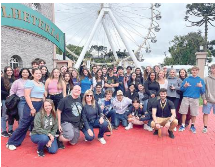
PONTOS TURÍSTICOS: atração que encanta