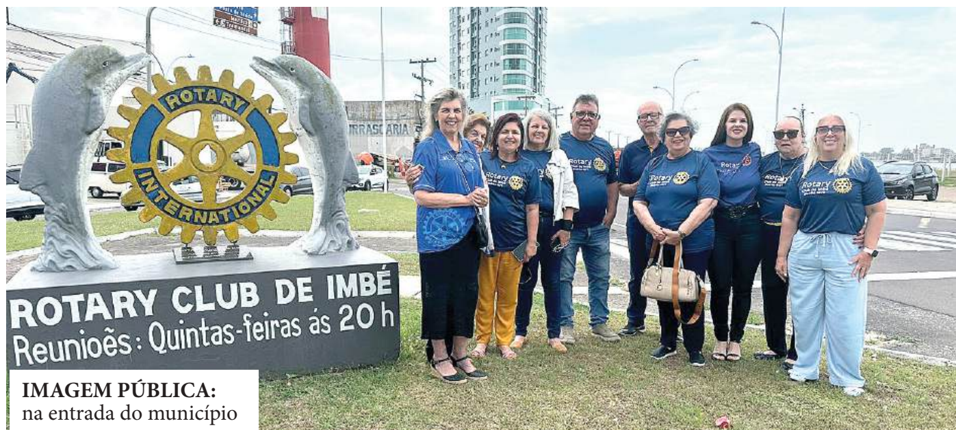
IMAGEM PÚBLICA: na entrada do município