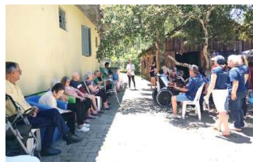
IDOSOS: atenção merecida