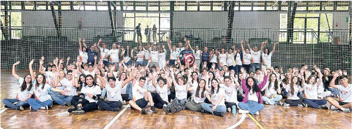
GINÁSIO: atividades concentradas uniu jovens