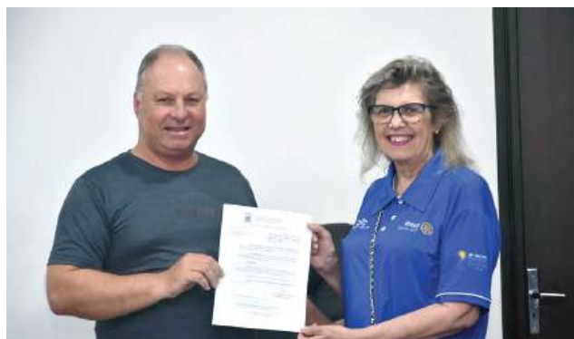
GOVERNADORA: Hóspede Oficial