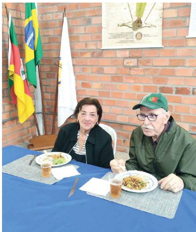
IDOSOS: dedicação de uma vida