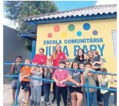
ATIVIDADES: vida que segue em frente