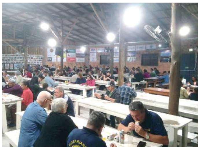
PRESTÍGIO: rotarianos participaram do evento