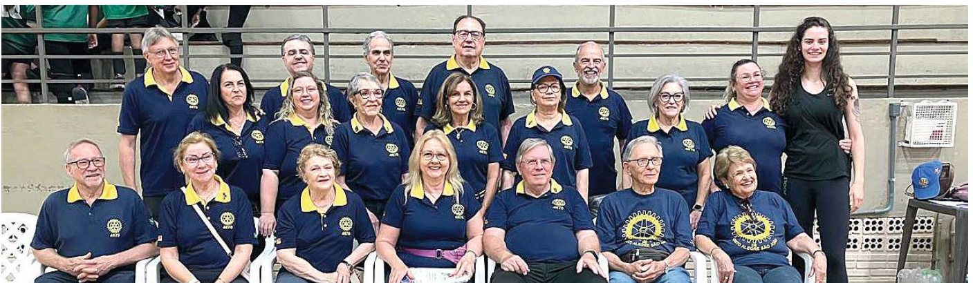
ROTARIANOS: linha de frente