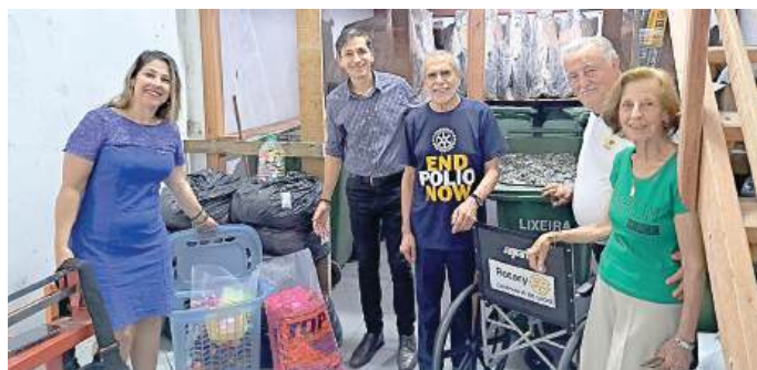
ENGAJADOS: Porto Alegre-Lindoia e Satélite – Lindoia Solidário