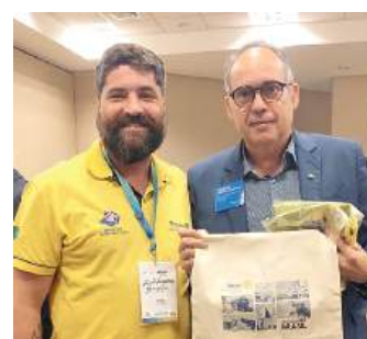
Governador 2021-22 Israel com o Diretor do Rotary International 2023-25 Henrique Vasconcelos