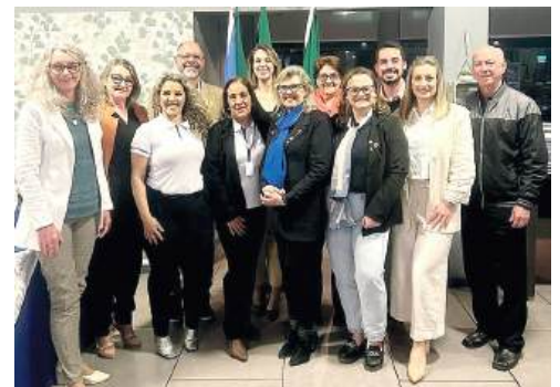
Prestígio reúne os companheiros