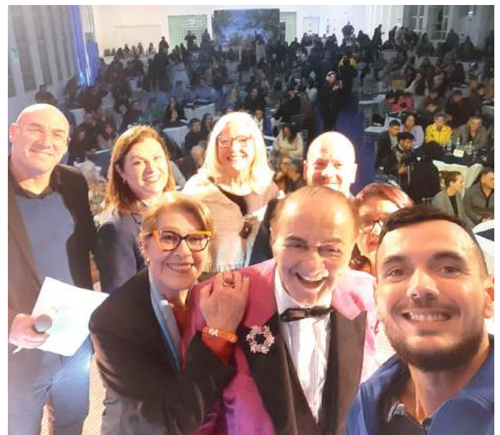
PALESTRA: unindo as entidades

Incentivando a solidariedade, solicitou ao público a doação de brinquedos para os clubes distribuírem às crianças carentes da cidade.