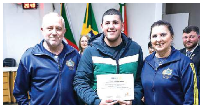
PRESTÍGIO entre os colegas