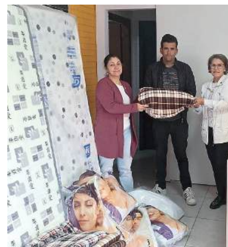
Comunidade Terapêutica Desafio Jovem Gideões