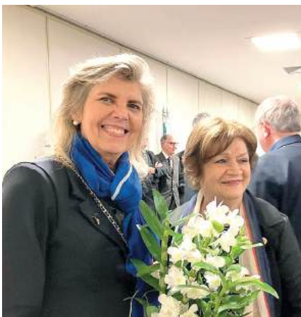
MIMO: tradição e a suavidade das orquídeas

O dia terminou com o Jantar Festivo, no Salão Baviera, na Sociedade Ginástica de Porto Alegre - Sogipa, parceira do clube. Na ocasião foram admitidos dois novos associados, cumprindo a meta do Distrito em apresentar os dois novos associados em cada clube, mas o São João quer apresentar quatro novos associados, neste ano rotário.