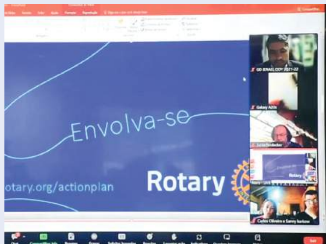
Palestra Israel Ody