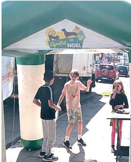
KIDS: Unidos pela causa

Esta última edição, realizada em setembro, arrecadou 182kg, o que também agradou os integrantes da ONG Amigo Bicho.