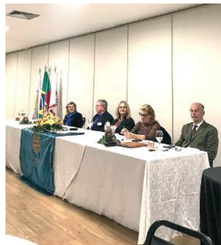
FESTIVA: e o momento solene