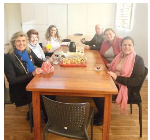
Apae Dois Irmãos