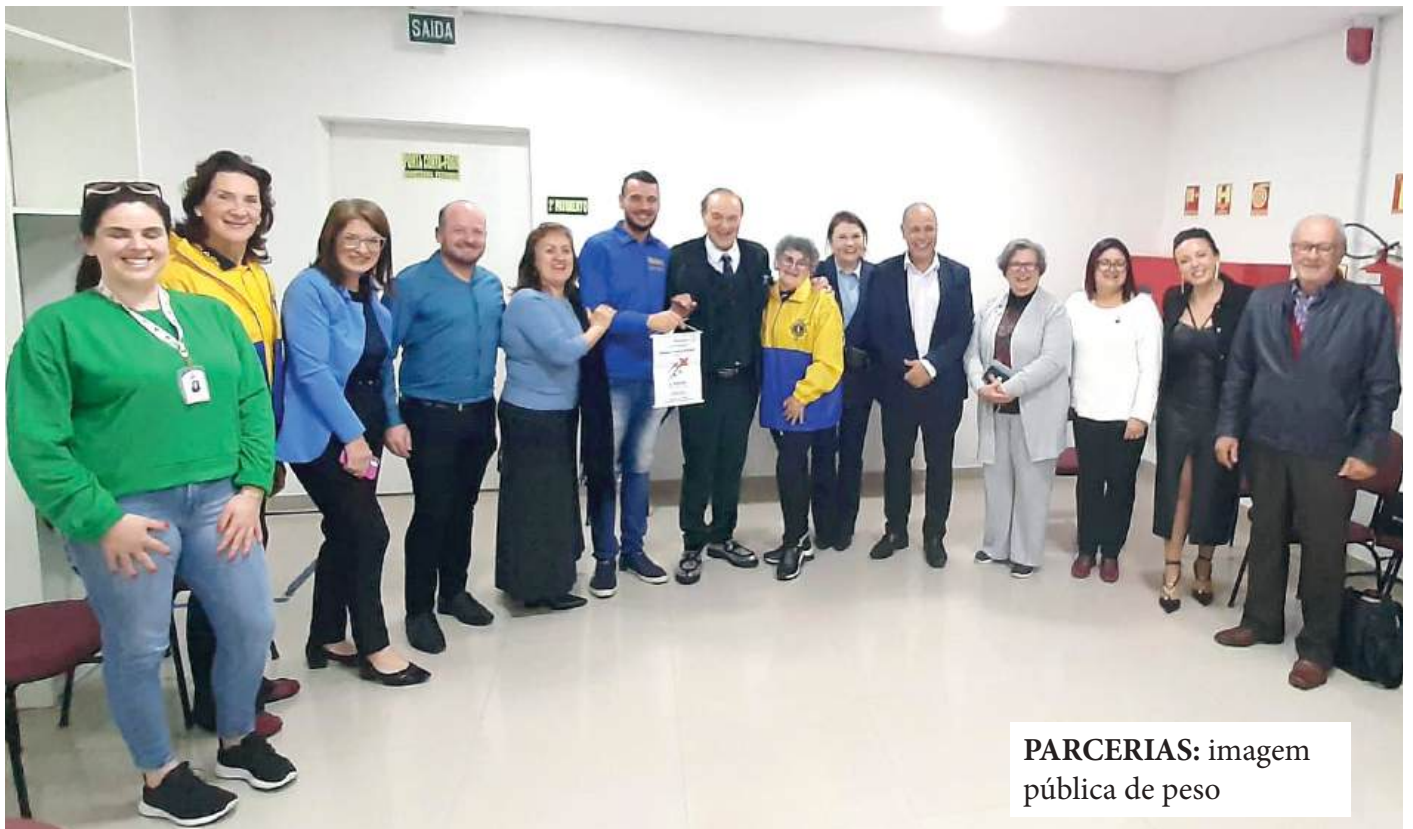
PARCERIAS: imagem pública de peso