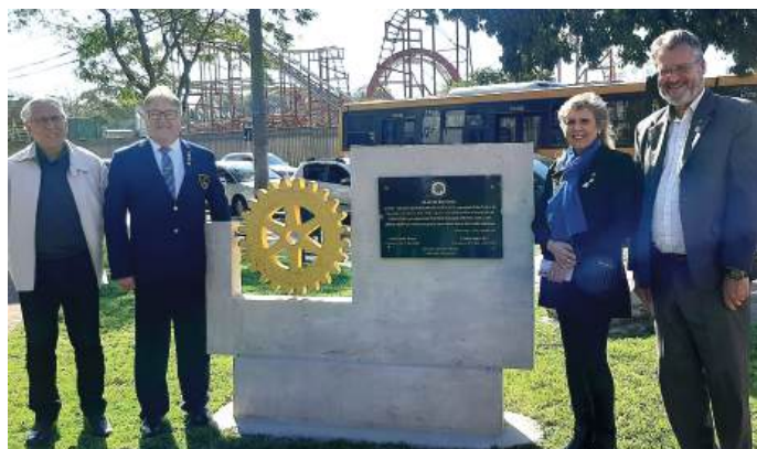
MARCO ROTÁRIO: símbolo forte que reforça a imagem do Rotary

nova identificação. O Marco Rotário foi instalado junto à placa quando da reconstrução da casa da Praça Rotary