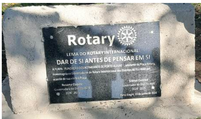
LEMA: mensagem do que é o Rotary

por iniciativa da FURPA e do Instituto Venturi para Estudos Ambientais, em junho de 2023.