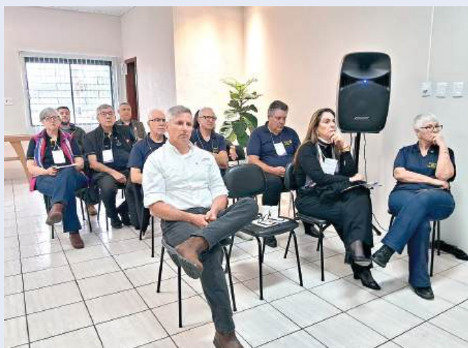
PRESENCIAL: com transmissão pela WebTV Sap