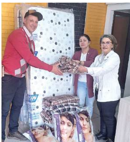
Associação Centro de Recuperação Litoral Norte