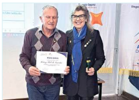
MENÇÃO HONROSA: Rotary Club de Tramandaí