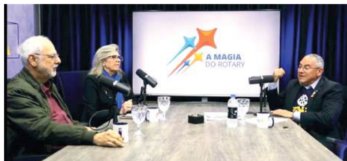
DISTRITO 4670: Rotary Cast, a novidade do ano rotário 2024-25

O bate-papo passou sobre a história da instituição, que é apartidária, não tem religião e muitos outros temas. Entre eles os subsídios da Fundação Rotária, a ajuda às vítimas das enchentes, e as personalidades mundiais e locais, entre muitas, citou o Rei Charles III, do Reino Unido e a ginasta, medalha de ouro no solo mundial, Daiane dos Santos, que receberam títulos “Paul Harris” – titulação máxima em homenagem ao fundador do Rotary International, Paul Percy Harris, que criou a instituição no ano de 1905.