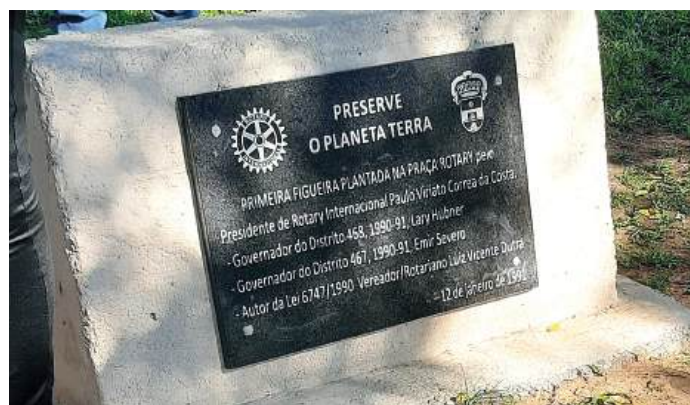
PRESERVAÇÃO: plantio de árvore é ação permanente dos rotarianos pelo mundo