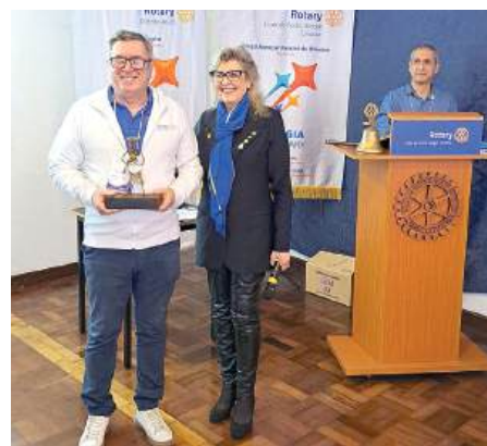
OURO: Rotary Club de Canoas – Ozanan, maior número de associados e clube novo