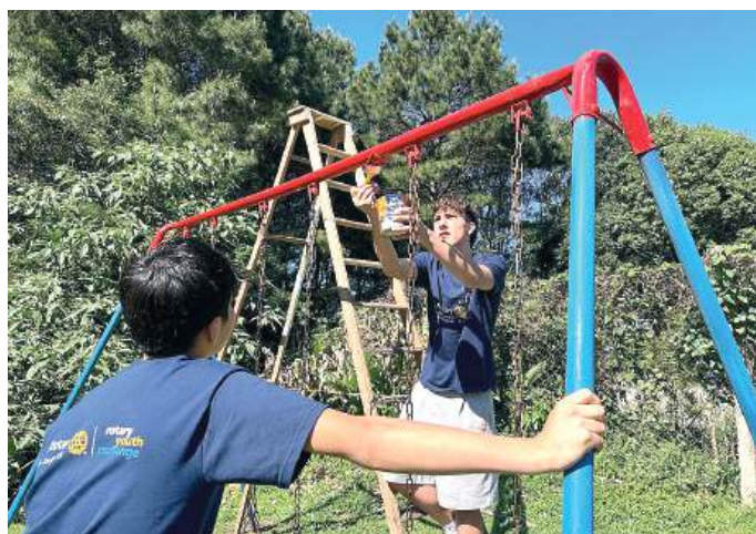
Atenção nas cores da infância