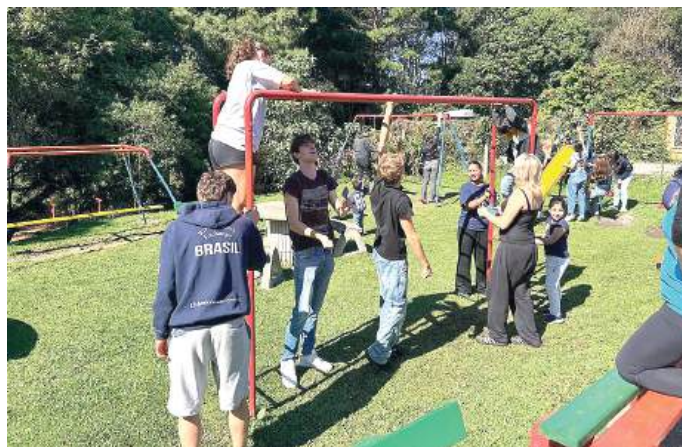
INBOUNDS: trabalhar em equipe é mais divertido