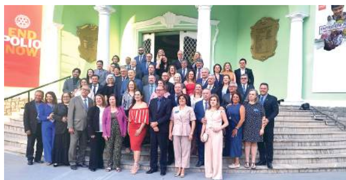
Governadores eleitos e cônjuges

ficar mais confiantes para montar suas equipes e dirigir seus distritos, da melhor maneira possível. “Nada de palestra, foi treinamento puro, onde os Governadores das regiões 29 e 31 puderam falar e falar bastante. Subsídios não