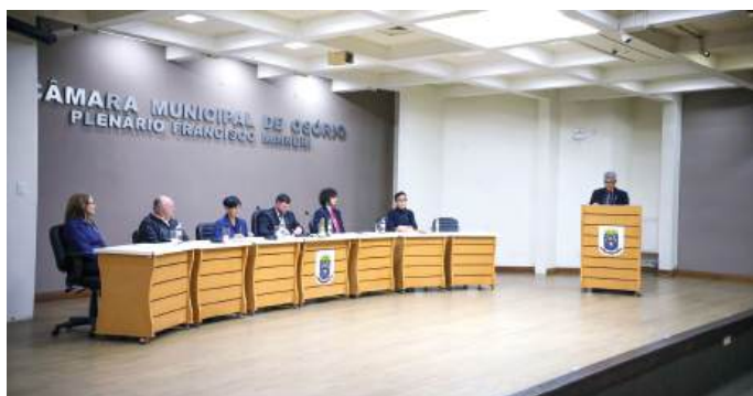
TRIBUNA: homenagem e agradecimento

Os rotarianos agradeceram as presenças ao evento e o incentivo aos estudantes exercerem as boas práticas. "A valorização da educação garante um futuro melhor, para todos", explicam.