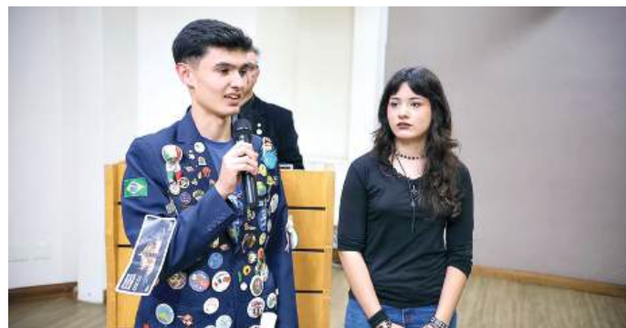
EXPERIÊNCIA: dividindo as vantagens