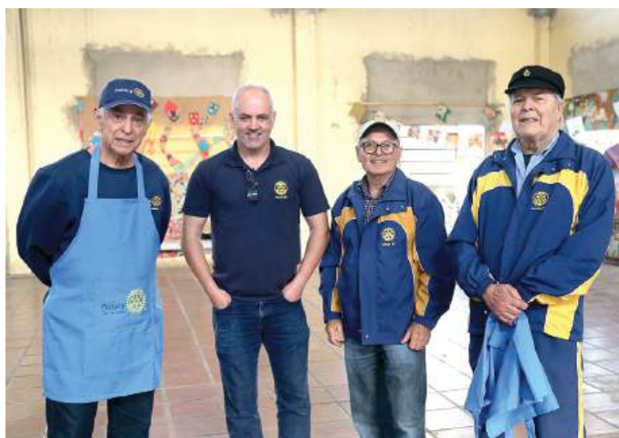
EQUIPE: união de todos