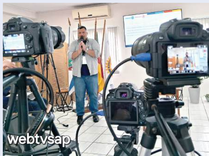
Seminário híbrido: Zoom, YouTube e Facebook