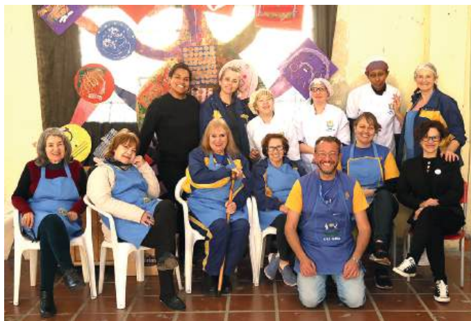
COMEMORAÇÃO: sucesso pela credibilidade de todos