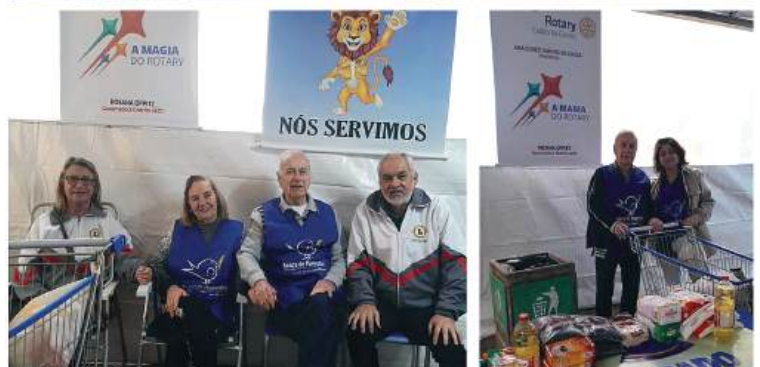
ARRECADAÇÃO: alimentos que socorrem muitas instituições