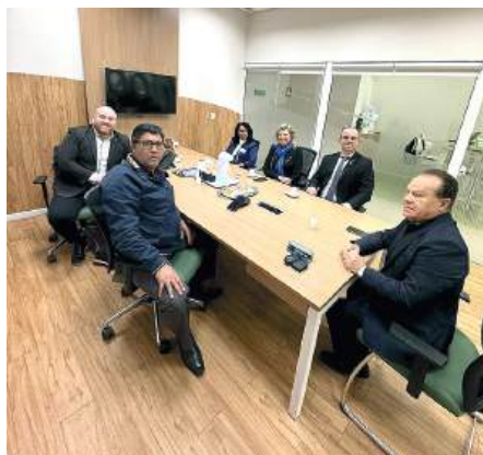
SICREDI: prestigiando parceiro