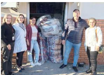
Empresa Solsul disponibilizou armazenamento

As doações estiveram armazenadas na Empresa Solsul, que disponibilizou espaço. A presidente Ana agradeceu aos parceiros que fizeram a diferença unindo-se ao Rotary Club de Capão da Canoa.