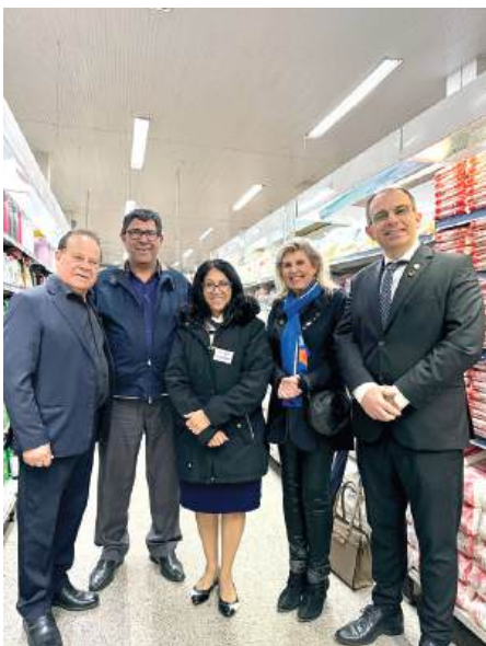
CERALUSA: empresa de rotariano