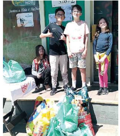
Ação arrecadou 182 quilos