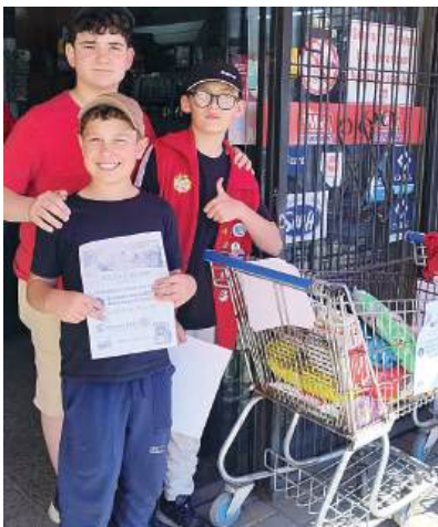
Arrecadação que faz a diferença