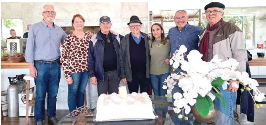
COMPANHEIROS: a felicidade em comemorar o aniversário