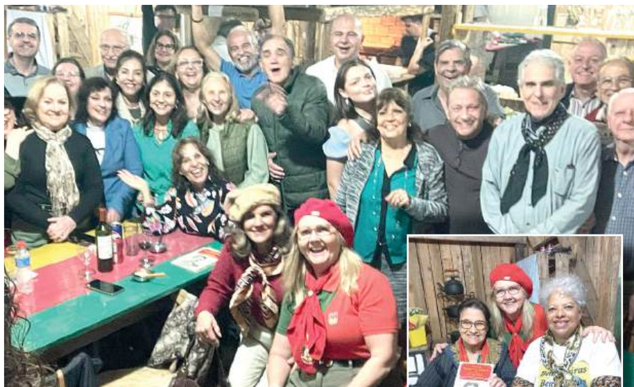
Grupo que prestigia

O jantar foi com comidas campeiras, pratos típicos da culinária gaúcha.