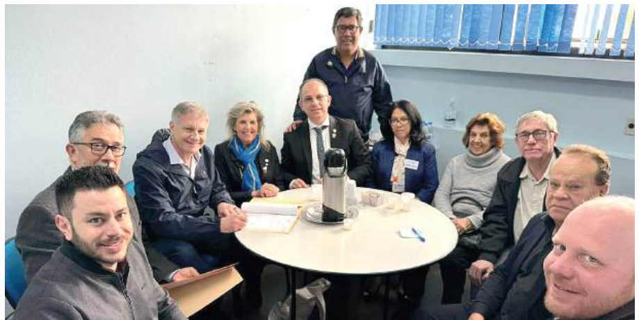
Hospital de Alvorada