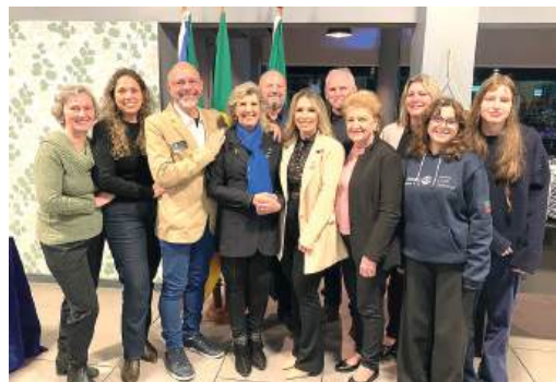
ORGULHO: recebendo a Governadora