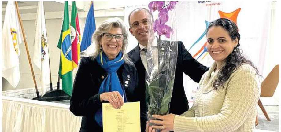
Mimos: uma flor e um depósito de U$ 50 para a FR