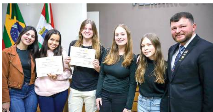
INCENTIVO: família e amigos