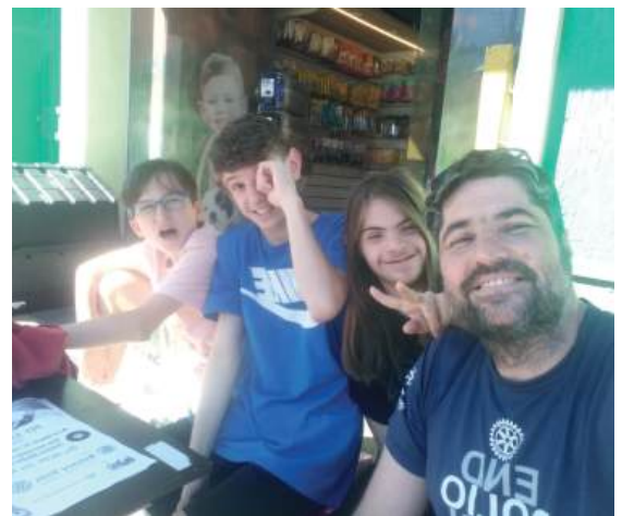
ROTARY KIDS CANELA – INSPIRAÇÃO: expertise