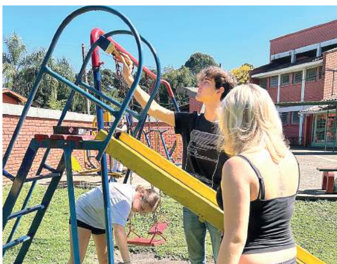
RECUPERADOS: brincadeiras com segurança