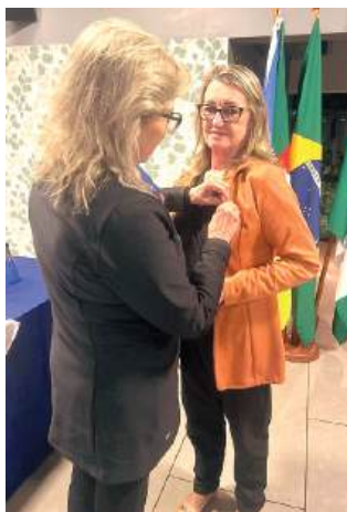
DISTINTIVO: um momento solene