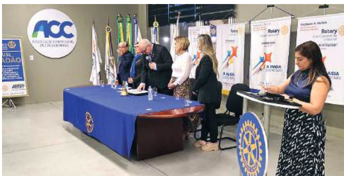
Cerimônia Oficial dos três clubes

No início da noite, no mesmo local, às 19h30 em cerimônia de Visita Oficial da Governadora aconteceu a posse de novos associados. O dia terminou com a festa e um coquetel.