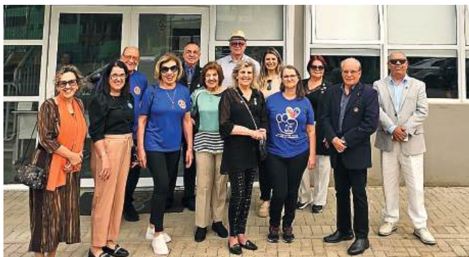
Associação Pais e Amor: Projeto que recebe apoio do Cachoeirinha