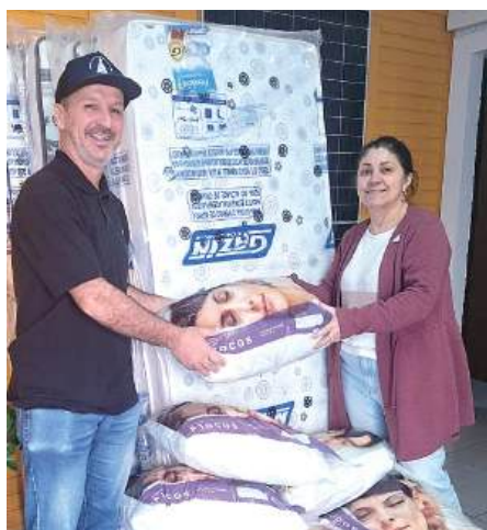
Associação Centro de Recuperação Nossa Senhora Aparecida