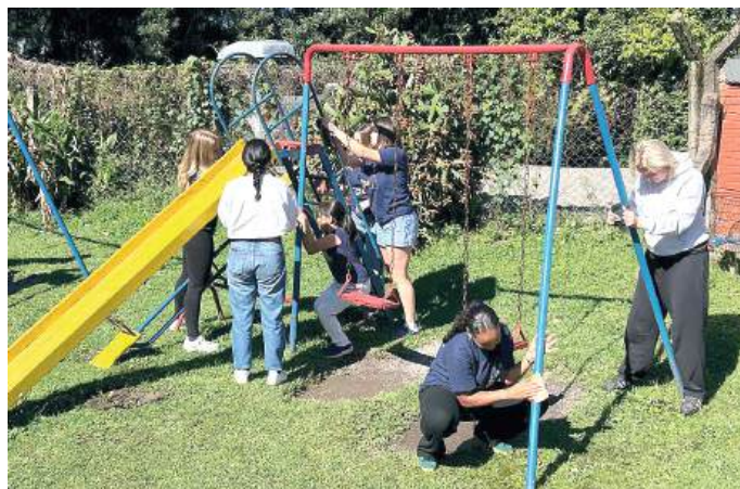
EMBELEZAMENTO: brinquedos foram lixados e pintados

Os intercambistas lixaram, pintaram os brinquedos da pracinha e depois plantaram 20 árvores no pátio da escola, “uma árvore para cada um dos nossos 18 inbounds e mais duas visitantes do Rotary Club de Gravataí. Foi um projeto muito legal”, afirma Irina, orgulhosa dos jovens intercambistas e pelo bem que fizeram para os alunos da Escola Pedro Oscar Selbach.