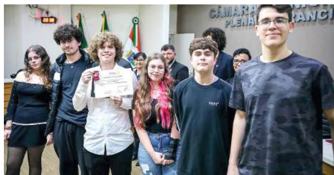
PRESTÍGIO entre os colegas