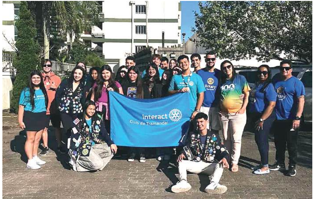
COMPANHEIROS: unidos para somar

O Rotary Club de Tramandaí apoiou o Interact Club de Tramandaí, dia 29 de setembro, para a realização do Dia do Convidado. A atividade consiste em prospectar novos integrantes para o Interact. Os companheiros fazem a apresentação, explicam o funcionamento, os projetos desenvolvidos, conquistas, premiações e o intercâmbio. Eles realizam dinâmicas para informar e integrar os convidados e interessados para incentivar os jovens a ingressarem ao Interact Club, projeto do Rotary International para jovens a partir dos 12 anos com permanência até os 18 anos.