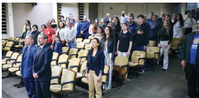
MELHOR COMPANHEIRO: orgulho das famílias e professores