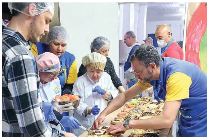
ROTARIANOS: com a mão na massa