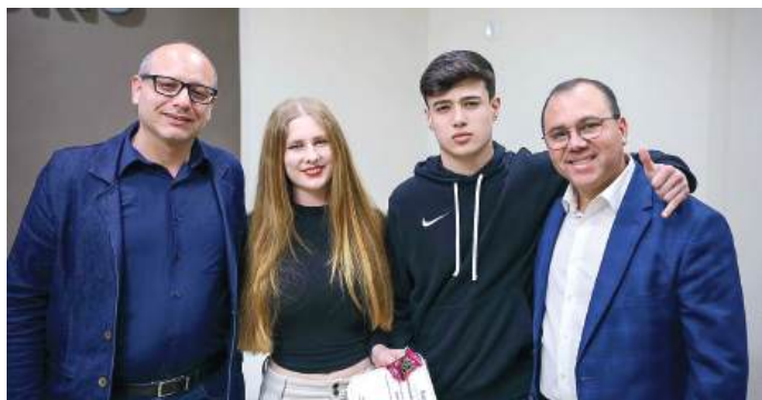
CONQUISTAS: destaque entre os colegas