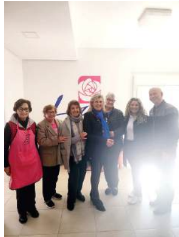
Liga Feminina de Combate ao Câncer