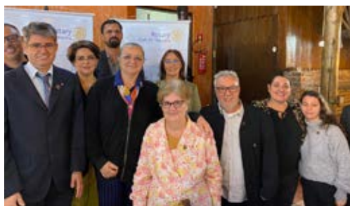
Companheiros do Igrejinha