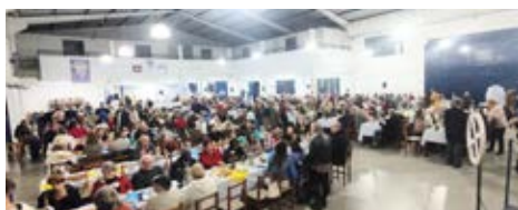
MÁXIMA: lotação e solidariedade no Café Colonial