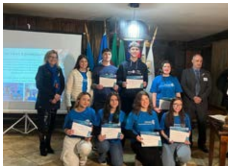
INTERACT: liderança juvenil