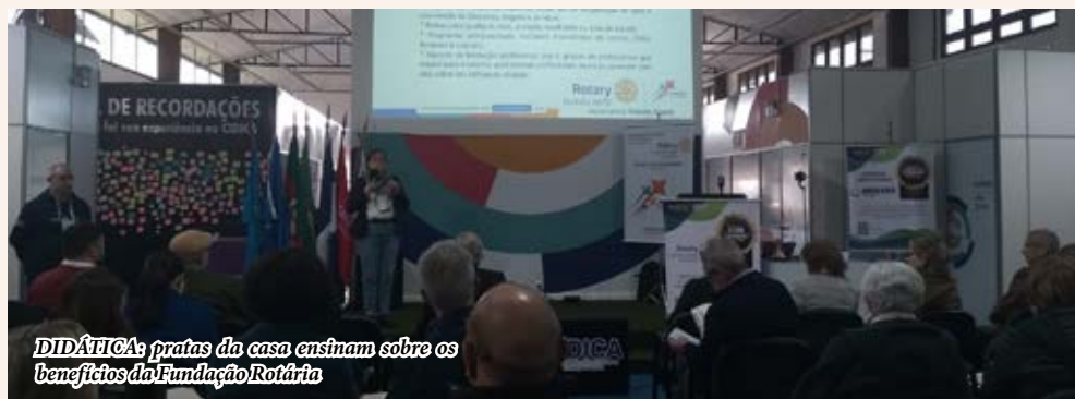
DIDÁTICA: pratas da casa ensinam sobre os benefícios da Fundação Rotária