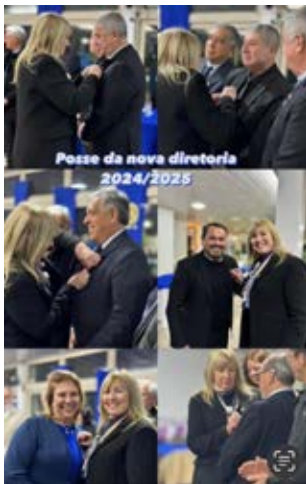
Posse ao Conselho Diretor