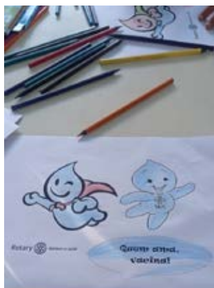
Desenhos e lápis de cor para as crianças colorirem