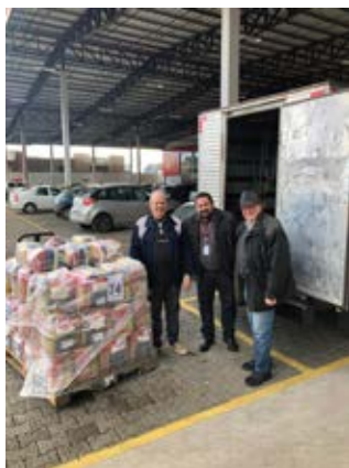
Macromix: sempre parceiro