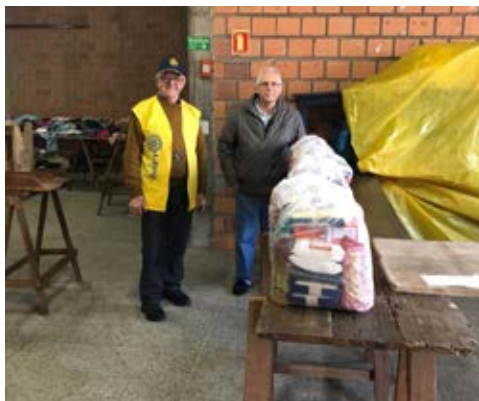
Sede da Cruz Vermelha, em Sapucaia do Sul

Dia 12 de julho os rotarianos entregaram ranchos na igreja da vila Carioca. O atacado Macromix doou 60 sacolas. No dia 18, a entrega do rancho foi na sede da Cruz Vermelha da cidade e depois na Igreja São José, outra parceira que cede as instalações ao clube sapucaense realizar suas ações. As demais doações foram adquiridas com recursos oriundos do Distrito 4670, que segue ocorrendo as comunidades.