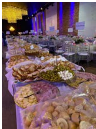
PÁTIO 115: Salão pronto