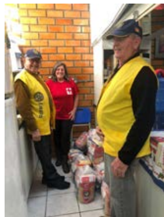
Doações que chegam em boa hora