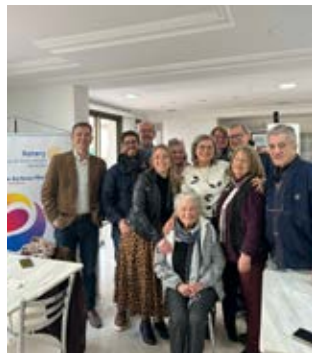
FESTIVA: entre companheiros, amigos e familiares