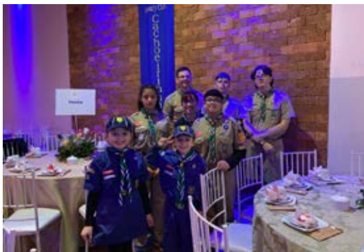
PARCEIROS: Grupo de Escoteiros Guajará Mirim