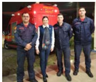
PARCEIROS: apoio fundamental

muitas pessoas, principalmente as afetadas pelas recentes cheias, que necessitam de apoio”, explicam os companheiros do Estância Velha.