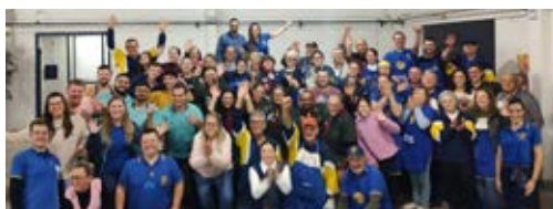
UNIÃO: comunidade, parceiros e os rotarianos fizeram o sucesso do evento