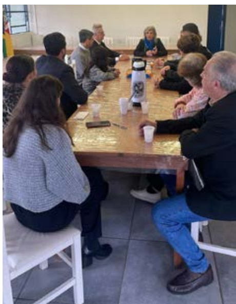
FESTIVA: Reunião de trabalho