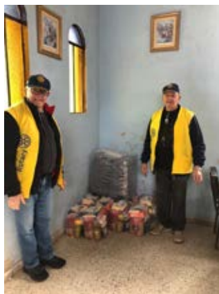
Igreja do bairro Carioca