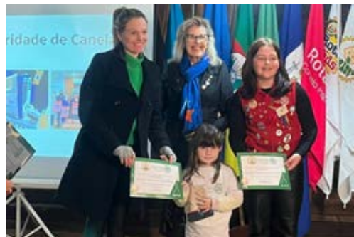
KIDS: a força para o futuro