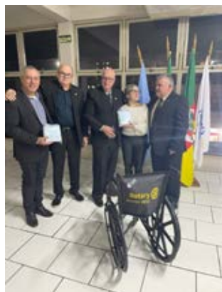
CADEIRA DE RODAS: para a Apae e Hospital