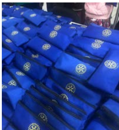
Imagem pública que dá certo