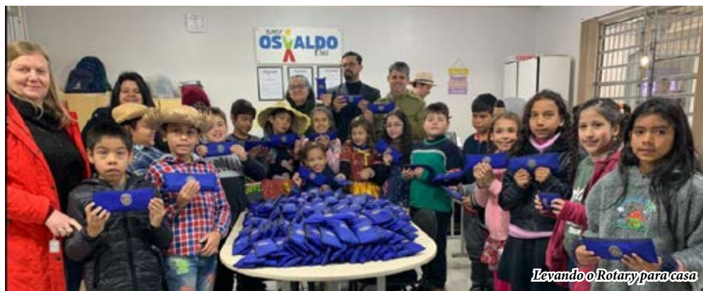
Levando o Rotary para casa