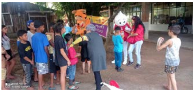
ALEGRIA: Distribuição de pirulitos