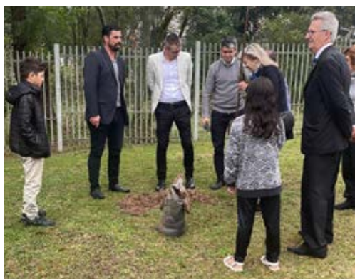
Plantando a Árvore da Amizade