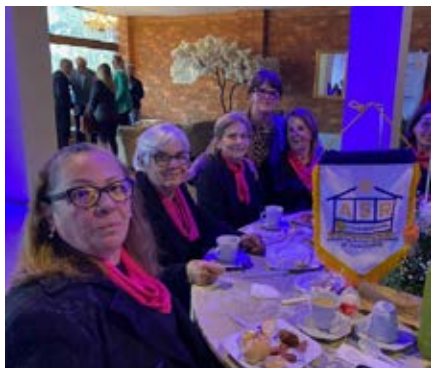
Associação das Senhoras dos Rotarianos