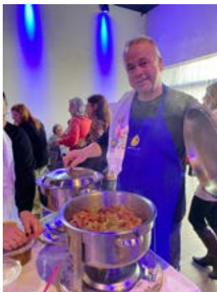
Na preparação dos quitutes