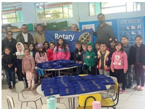
ESTUDANTES: estojo escolar é fundamental

cada edição da Oktoberfest de Igrejinha, ao final de cada ano, a Amifest tem como prática realizar um evento em que são divulgados os resultados financeiros daquele ano. Ao mesmo tempo, parte expressiva deste resultado é revertido em repasses a diversas entidades das comunidades de Igrejinha, em especial, e também do Vale do Paranhana.