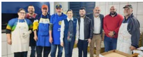
REFORÇO: toda a participação é necessária