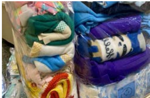
INVERNO: toda ajuda é bem-vinda