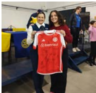
INTER: a velha e sempre....