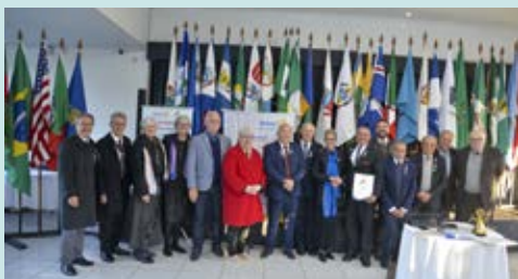
Prestígio dos governadores