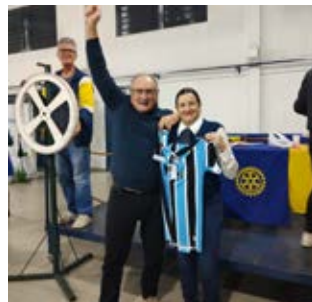
GRÊMIO: ...boa rivalidade