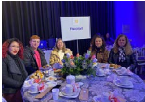
AMIGOS: convidados que enriquecem a festa