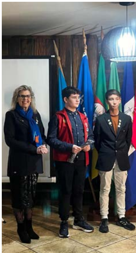
PRESTÍGIO: intercambistas olhando para o futuro