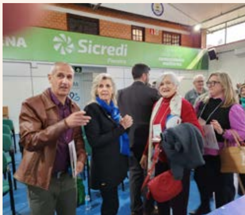
MOVIMENTO: expectativa no evento híbrido

Por toda a manhã de sábado, invadindo as primeiras horas da tarde, o Seminário Distrital da Fundação Rotária e Gerenciamento de Fundos, de uma forma híbrida, como anunciou a governadora Rosana Oppitz no dia de sua posse, agradeceu e facilitou a participação de muitos companheiros.