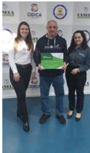
PARCEIROS: Sicredi e Canela-Inspiração