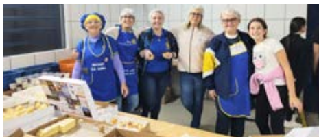
DELÍCIAS: produção e elaboração dos comes