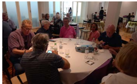
CONJUNTA: amigos e companheiros