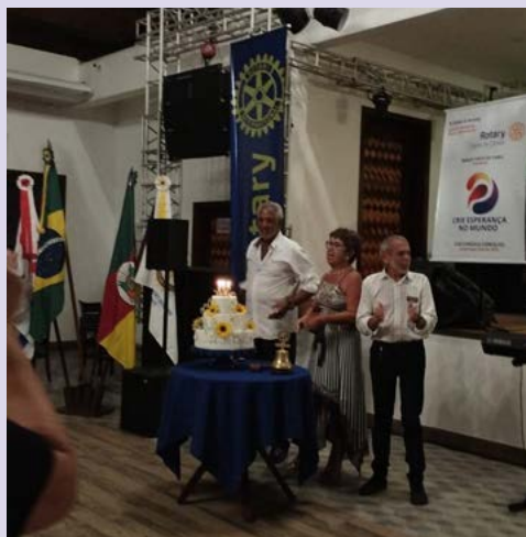
PAREBÊNS: com bolo e velinhas

“Nosso lema intemporal ‘Dar de Si Antes de Pensar em Si’ contém o espírito que tem orientado o Rotary ao longo destes 119 anos e é o que continuará a impulsioná-lo para o futuro. Continuemos a inspirar e a ser inspirados, a abrir oportunidades e a criar esperança num mundo melhor, continuemos a viver os valores de Rotary em cada ação que realizamos, fazendo jus à história que nos une e nesta celebração vamos projetar o futuro, um futuro melhor para todos, em especial às crianças de famílias que mais precisam. Sejam todos bem-vindos companheiros, comemorem e voltem para casa melhores do que quando chegaram e com toda garra para continuar construindo um mundo melhor para todos nós”, manifestou-se o governador.