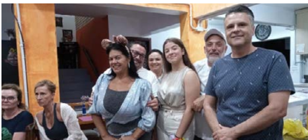
DESCONTRAÇÃO: com seriedade