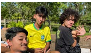
PASSEIO DE CARROÇA: tempo para apreciar a paisagem