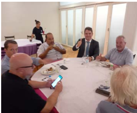
Amizades e troca de experiências