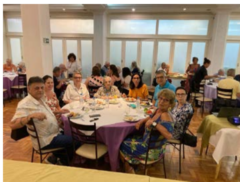
Companheiros e convidados

Distrito 4680 – Porto Alegre-Arena; Porto Alegre-Independência; Porto Alegre-Bom Fim; Porto Alegre- Glória Teresópolis; Porto Alegre-Beira Rio; Porto Alegre; Porto Alegre-Sul Satélite Farroupilha