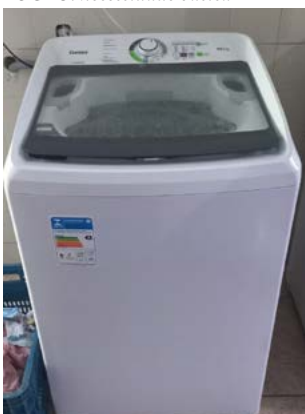
LAVADORA: higiene e dignidade