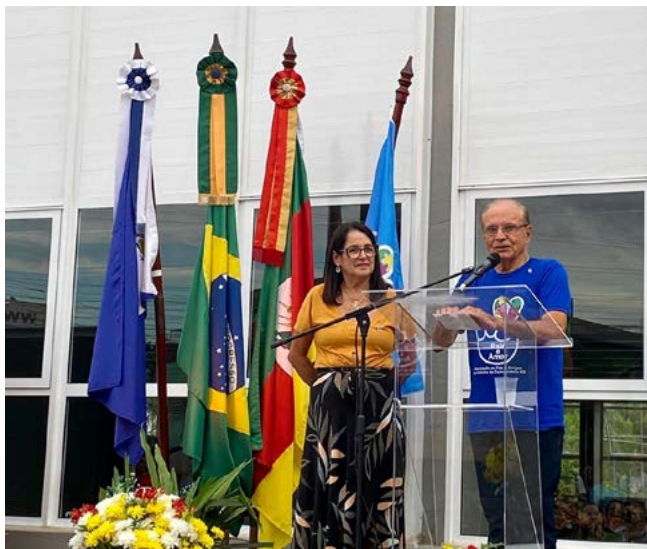
SONHO: projeto trabalhado com afinco e muitos envolvidos