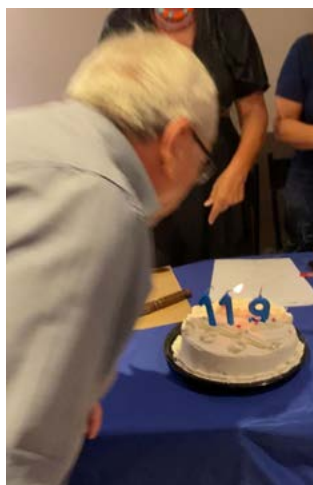
ORGULHO: aniversário inesquecível