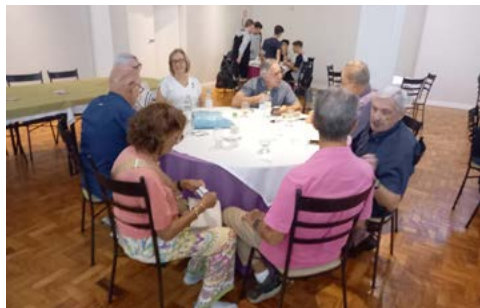
ROTARIANOS, sendo rotarianos

A última reunião do mês de fevereiro, almoço dia 27, o Companheirismo foi o momento marcante, onde os rotarianos confraternizaram e divertiram-se. Em clima de descontração participaram da Conjunta de Verão no Três Figueiras Tênis Clube, os Rotary Clubs de: Porto Alegre-Bom Fim; Porto Alegre-Independência; Porto Alegre-Iguatemi, Porto Alegre-Norte, Porto Alegre-Anchieta e seus convidados.