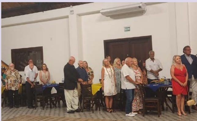
LIDERANÇAS: rotarianos marcam presença