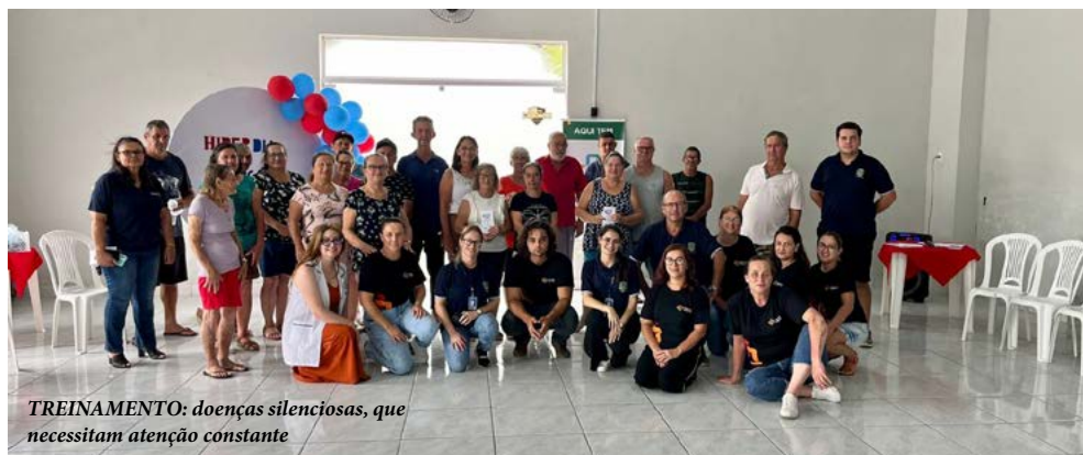
TREINAMENTO: doenças silenciosas, que necessitam atenção constante