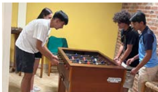
Um bom entretenimento