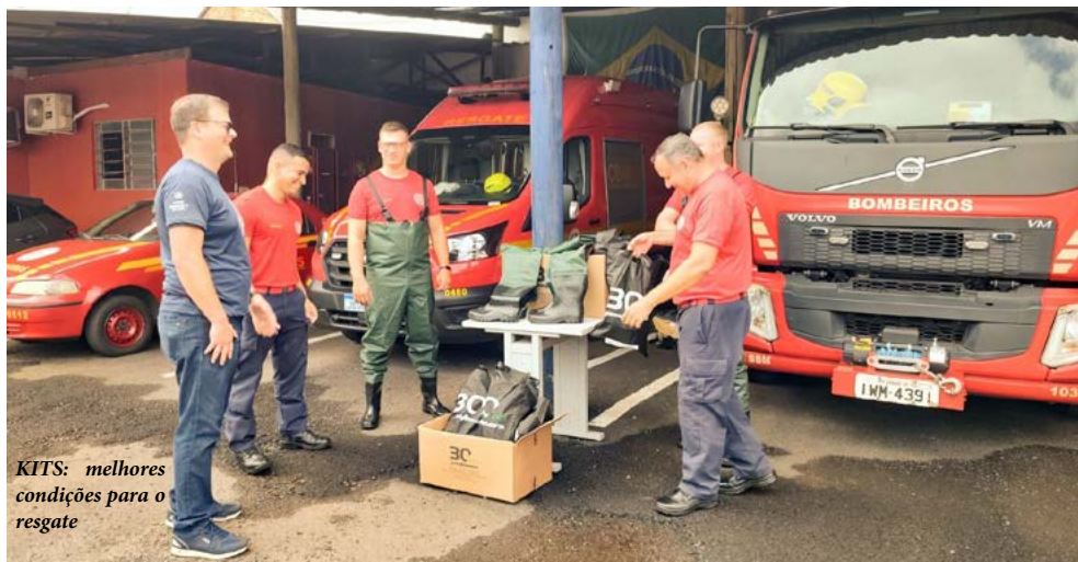
KITS: melhores condições para o resgate