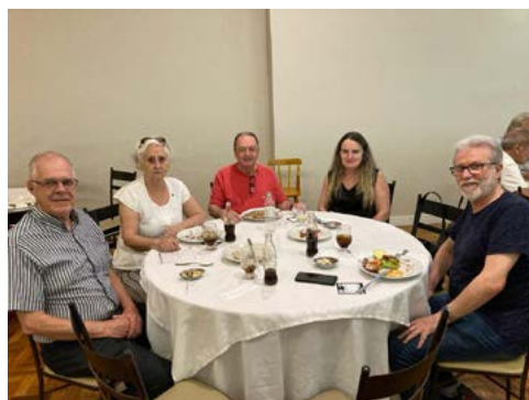
AMIGOS: todo o momento é importante