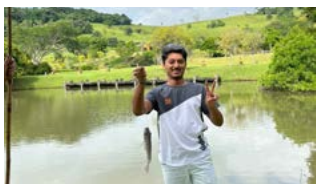
Primeira pescaria também do Deven, da Índia