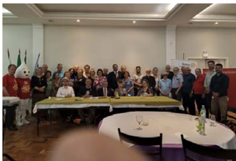
ANIVERSÁRIO: lideranças participaram da comemoração e instruções de trabalho