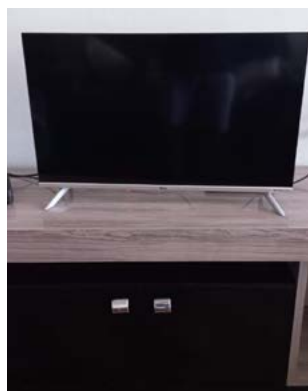
TV: entretenimento para aliviar pressão