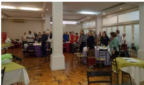
CASA CHEIA: rotarianos, amigos e convidados