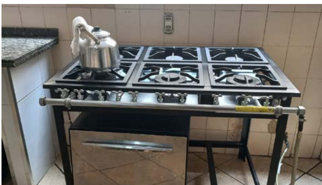
FOGÃO: necessidade básica