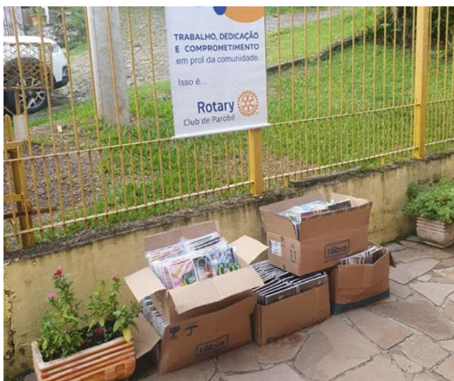
KITS: material sempre bem-vindo