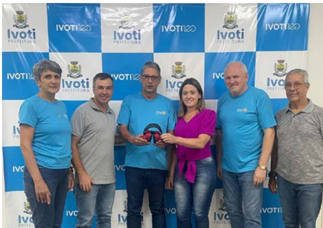
ABAFADORES: conforto e convívio social