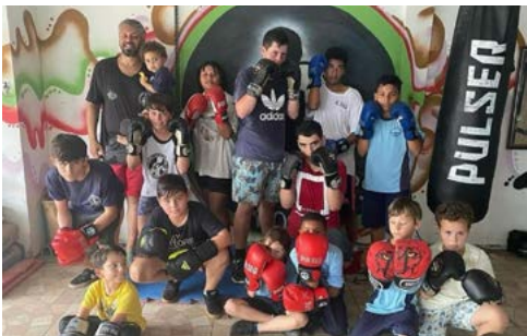
SONHO: esporte para crianças e adolescentes