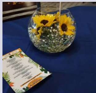
GIRASSÓIS: planta associada à felicidade, energia, alegria e vitalidade