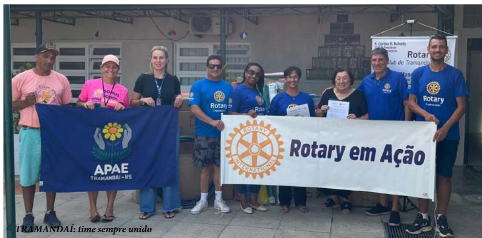
TRAMANDAÍ: time sempre unido