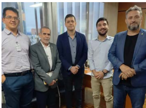
GOVERNADOR: rotarianos apresentam o projeto