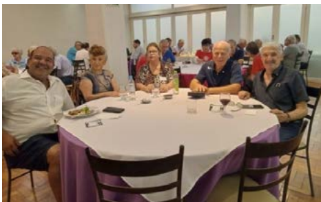
ATENÇÃO: experiência e dedicação