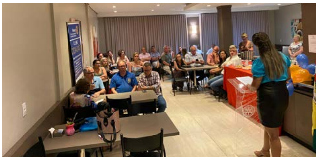
UNIÃO: rotarianos pelos mesmos objetivos