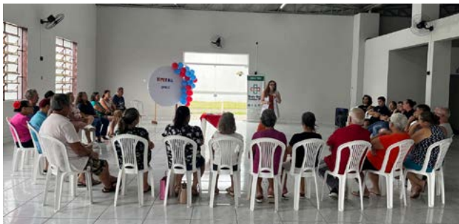
PARCERIA: município de Itati e UFRGS