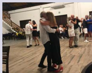
DANÇA: diversão para todos