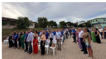
PRESTÍGIO: representantes da comunidade