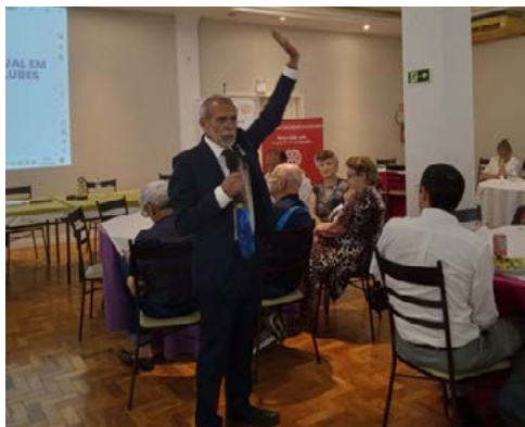
GONZAGA: união e desenvolvimento para crescer

Do Distrito 4680: os Rotary Clubs de General Câmara; Beira-Rio; Bonfim; Glória-Teresópolis; Independência e Porto Alegre.