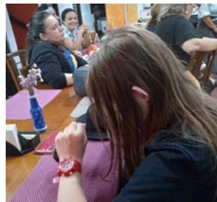
FOCO: atenção nos detalhes