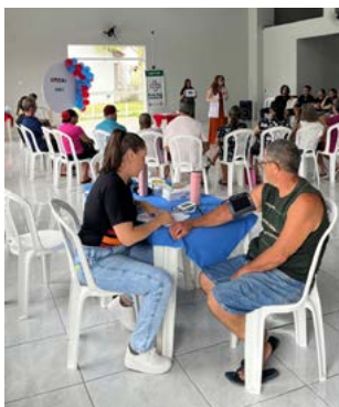
PRESSÃO ARTERIAL: controle permanente

O evento contou com cerca de 30 pessoas. Todos receberam mimos, lanche saudável e orientação sobre controle do mosquito Aedes Aegypti , como alerta sobre o momento de epidemia no Estado.