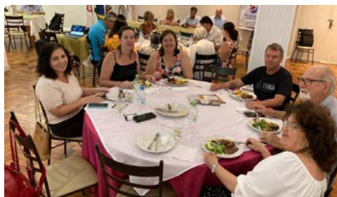
ATENÇÃO: o tema que desperta