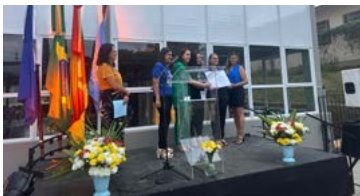
DEDICAÇÃO: reconhecimento pelo empenho