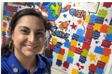
SATISFAÇÃO: rotarianos não medem esforços