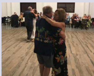
PISTA: a descontração