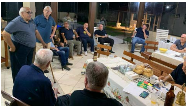
COMPANHEIRISMO: união de esforços e descontração

Como integrante da diretoria da Associação de Pais e Amigos - Apae de Campo Bom, a