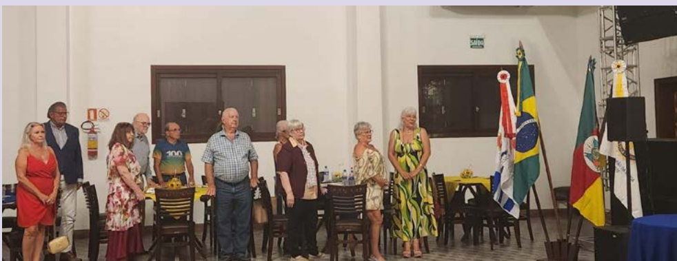
DISTRITO: representantes de clubes, amigos e convidados

Visite o site: www.rotary.org/pt e descubra a maior instituição não governamental que realiza ações em benefício das comunidades pelo mundo todo.