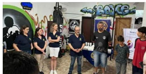
ONG: rotarianos, professor e alunos