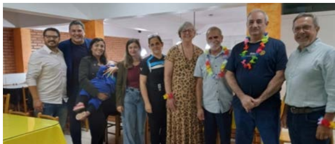
REUNIÃO: companheiros aumentando a família rotária

O Governador Gonzaga saiu satisfeito com as pro-