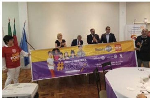
IMAGEM PÚBLICA: campanha nacional