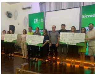
SICREDI: alegria de rotariano com ajuda para projetos