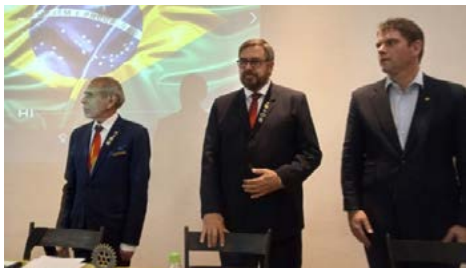
HINO: o respeito e o orgulho