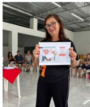
ATUALIZAÇÃO: atenção sobre índices