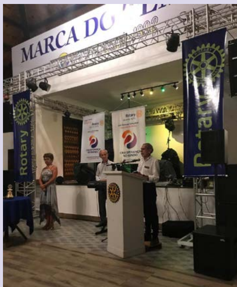
GONZAGA: Governador saudou, agradeceu e lembrou o ideal de Servir

Gonzaga passou pela história de fundação do Rotary International. Ele disse que por mais