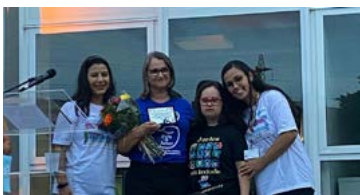
Recebeu homenagem de todas as mães de diferentes