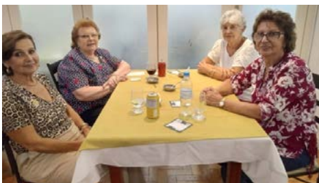
SENHORAS: representantes da Casa da Amizade