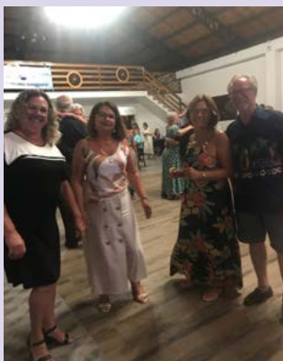
Uma pausa para o registro