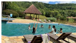
CALOR: jogo de bola na piscina, diversão refrescante