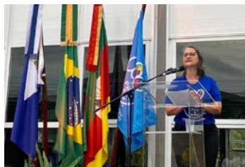
PRESIDENTE: Cátia históriando e agradecendo a todos