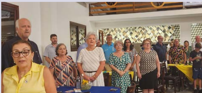
SOLEINIDADE: o orgulho em cantar os hinos