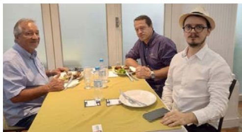
CLUBES: participação fundamental