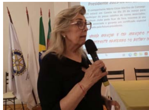
GOVERNADORA ELEITA 2024-25 Rosana Oppitz, convidou para Workshop em Canela, mês de março