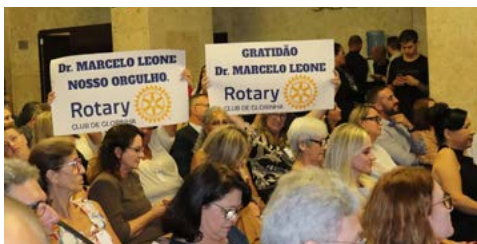
CREDIBILIDADE: Rotary é aplaudido

doméstica e o fornecimento de vida mais digna às mulheres.