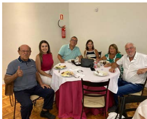
PAUSA: atenção e descontração