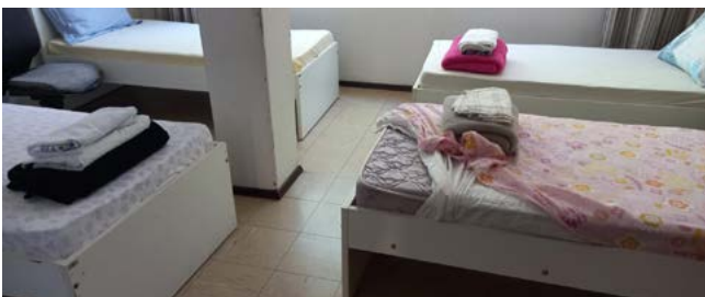
COLCHÕES: ítem de saúde

longo dos anos, apoiando e acompanhando essa entidade e deseja, através de Subsídio Distrital da Fundaçã