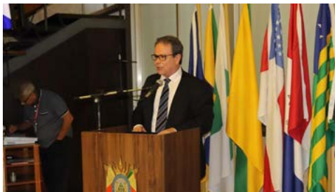
LEONE: orgulho e dedicação no que faz

A partir da lei o médico iniciou o trabalho que conduzia em Gravataí para outros municípios e ao levar o projeto ao Rotary Club de Glorinha, foi convidado para ser associado honorário. Com o apoio do Rotary seu projeto de planejamento familiar começou a alcançar mais municípios. Disse que uma cidade que consegue planejar e organizar suas famílias é uma cidade que evolui como um todo. Para ele o projeto representa um passo importante para que as mulheres possam ter liberdade para escolher quando irão ter seus filhos. Citou outras mudanças positivas como a diminuição dos índices de feminicídios e criminalidade, redução nos indicadores de violência