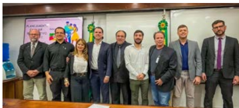
Jovens das casas lares terão acesso ao Programa

ampliação do trabalho para mais clubes do Distrito 4670, e o médico já apresentou o projeto aos municípios de Porto Alegre, Diler-