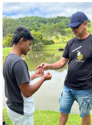
INSTRUÇÕES e procedimentos para uma boa pescaria