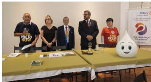
MESA: representantes no aniversário do Rotary