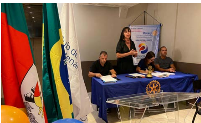
FESTIVA: planeja atividades