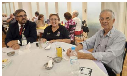
COMPANHEIROS de diversos clubes