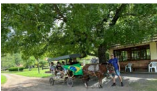
VEÍCULO: uma volta de charrete