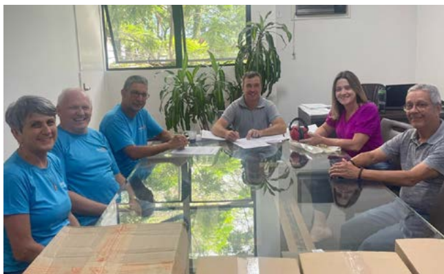
ROTARIANOS: entrega oficial à prefeitura municipal

Ivoti, através da Secretaria de Educação, fez a implantação e a execução dos cursos especializados para todos os monitores desta área com foco no atendimento das pessoas com TEA.