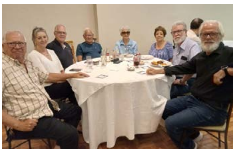
Sempre é hora e lugar para companheirismo