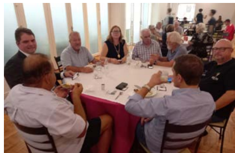
Muitos assuntos, diversos interesses