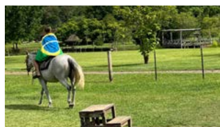
NO CAMPO: andar a cavalo é quase uma obrigação