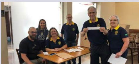
DETALHES: avaliações e controle