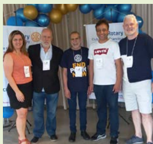
Recebendo as visitas