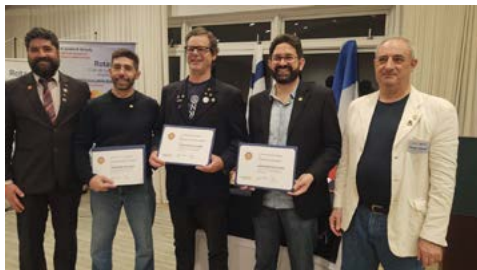
Compaheiros Paul Harris do Clube