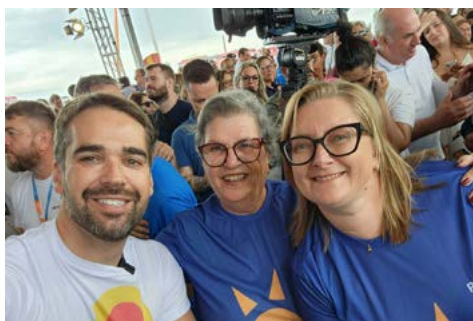
IMAGEM PÚBLICA: Operação Verão e “Melanoma, essa não é a tua praia”

A iniciativa é proteger a pele de problemas causados por muita exposição aos raios solares e tem foco nos funcionários municipais como os garis, os da manutenção e conservação de áreas públicas, que trabalham na rua, principalmente no verão.