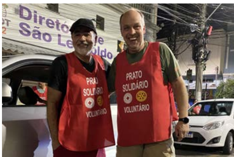
Companheiros expandindo o projeto