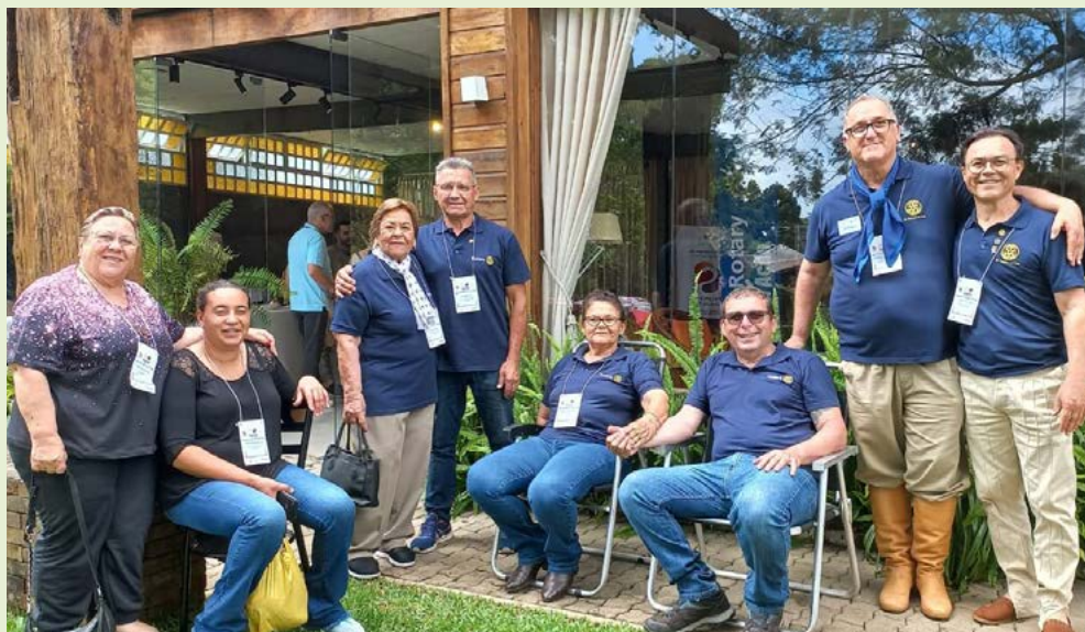
AMIGOS: companheiros e convidados