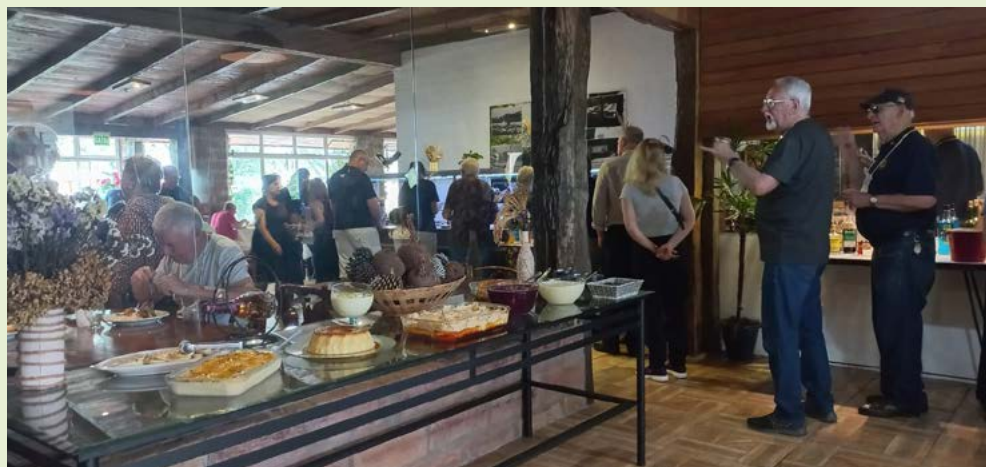
RESTAURANTE: comidas e sobremesas, à vontade