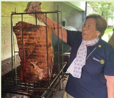
COMPANHEIRA: fiscalizando a qualidade