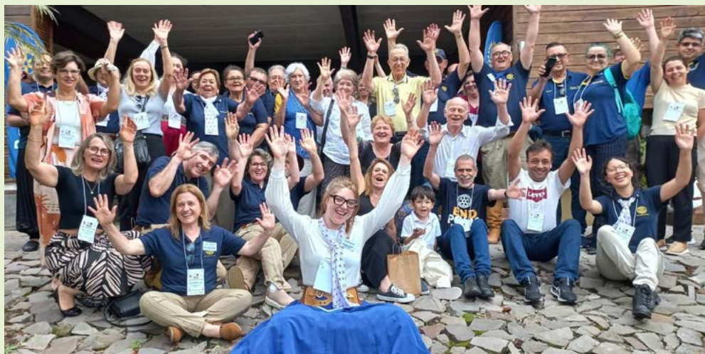
ALEGRIA: companheiros comemoram o primeiro evento