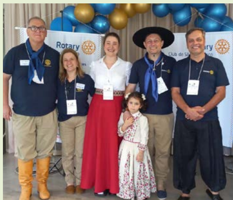
TRAJES: orgulho dos gaúchos