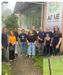
COMITIVA: visita à Apae