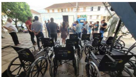
CADEIRAS DE RODAS: necessidade para a locomoção