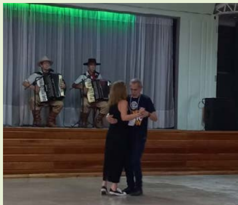
Governador abrindo a pista de dança

Depois foi a vez das apresentações dos grupos folclóricos de São Francisco de Paula, abrilhantar a festa.