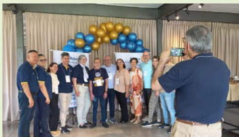
REGISTRO: lembranças que todos querem