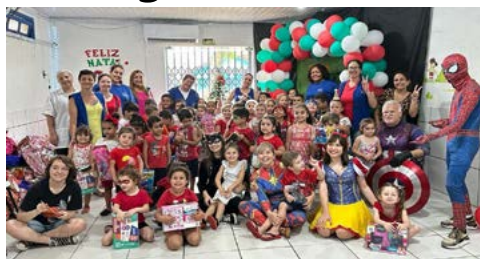
Crianças da escolinha com os heróis.