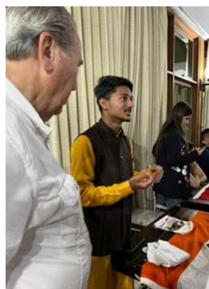
Ex-intercambistas dividindo conhecimentos