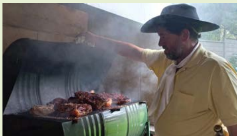
CHURRASCO: orgulho dos gaúchos

O anúncio para a foto principal, foi comemorado e não faltou ninguém para a foto. Aquele registro ficará para a história do 1º RotaryTchê.