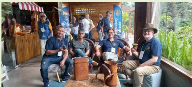
CHIMARRÃO: abrindo os trabalhos