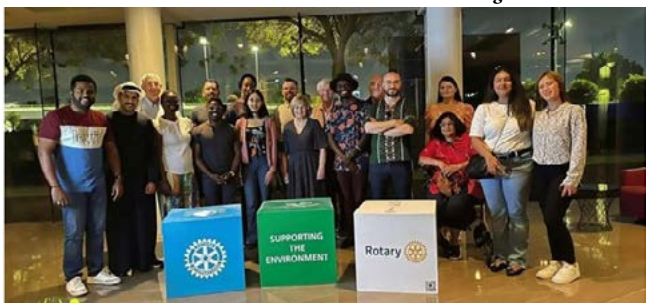
JOVENS: voluntários na Conferência amplificam as vozes na discussão climática

com o Governo dos Emirados Árabes Unidos, a UNICEF e a Organização Mundial da Saúde sobre potenciais parcerias no campo da Saúde Mental”.