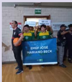
2º Lugar: EMEF José Mariano Beck