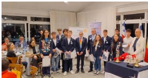
Intercambistas de Longa Duração 2023-24 do Rotary Club de Canela-Inspiração