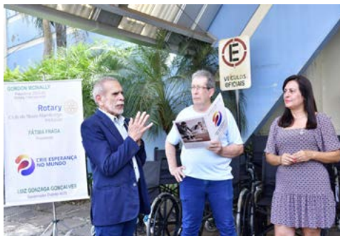
GOVERNADOR GONZAGA: parceiros são importantes para o Rotary

O presidente da Fundação de Saúde Augusto Lengler Vargas, destacou o papel fundamental no cotidiano, e agradeceu a iniciativa do Rotary Club de Novo Hamburgo-Inclusão. Ele disse que, embora alguns possam subestimar a importância de uma cadeira de rodas, no contexto hospitalar, cada equipamento desempenha um papel fundamental. “As vezes só damos valor quando chega uma ambulância nova, e se compararmos, uma cadeira pode parecer algo pequeno, mas para levar ou tirar um paciente de