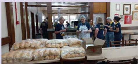
COZINHA: sob o comando dos rotarianos