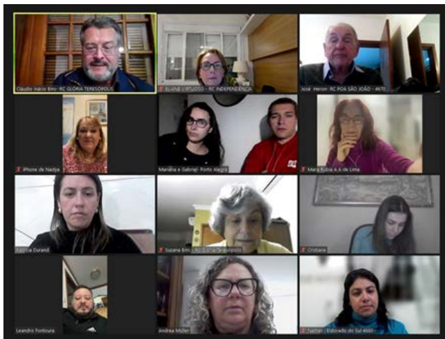
NOVOS ASSOCIADOS: instruções básicas para iniciantes

A capacitação é realizada, anualmente, pelo Glória Tere-