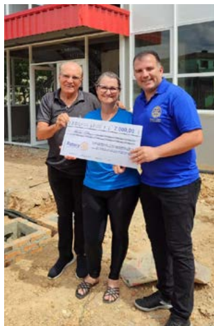
CLUBE: ações o ano todo para ajudar

Em 2023, a associação conta com mais de 350 famílias, apoiadores da comunidade e um corpo de voluntários. Entre os objetivos estão: proporcionar lazer e qualidade de vida para famílias de pessoas com TEA de Cachoeirinha; conscientizar a comunidade de Cachoeirinha sobre o autismo; vincular o trabalho voluntário em vários projetos dentro da associação visando o desenvolvimento da consciência cidadã; estabelecer parcerias com empresas e comunidade em geral; atender o autista em todas as fases de sua vida com tratamento multidisciplinar; auxiliar o aprendizado