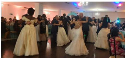
ORGULHO: o baile com os pais

do para 2024 e realizar o sonho de mais meninas, cujas realidades não permitiriam vivenciar esta experiência.