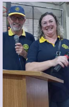
PROTOCOLO: companheiros no comando