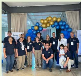
TIME: Rotary Club de São Francisco de Paula