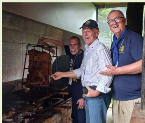
COMPANHEIROS: de olho no assado, de dar água na boca