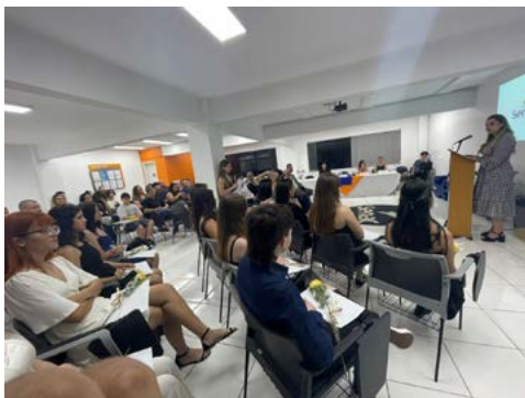
MERCADO: meninas na área tecnológica

nas na TI é de inclusão de meninas de 15 a 19 anos residentes em Novo Hamburgo, e é ministrado pelo SENAC Novo Hamburgo. “O curso é totalmente gratuito e conta com parceria