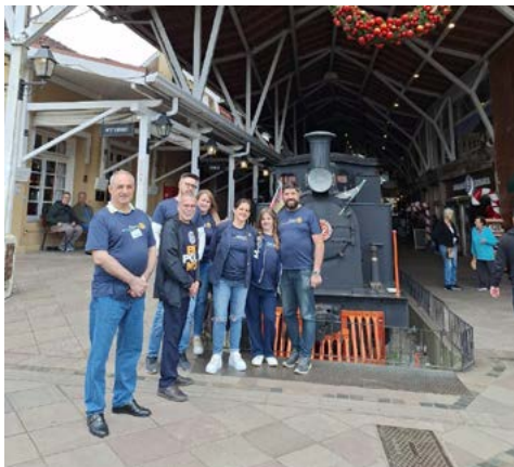
Estação Campos de Canela: um pouco da história do município