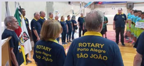
HINOS: momento solene