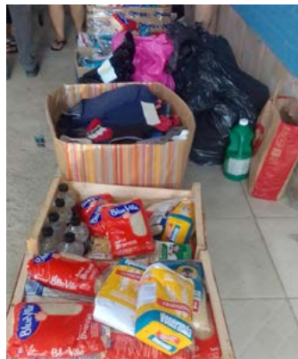
AJUDA: necessidades diversas

var, poltrona e um tanquinho, 3 fardos de água, 5 sacolas de alimentos; Material de limpeza: 10 rodos; 10 vassouras; 25 litros de detergente; 25 litros de desinfetante; 25 litros de água sanitária; 150 sacos, de 100 litros, para lixo; Higiene pessoal: 15 kits (papel higiênico, 100 unidades de pasta de dente, escovas de dente, sabão, sabonete, Qboa, detergente e shampoo), 10 pacotes de fraldas geriátricas; 15 litros de soro para hidratação (hospital).