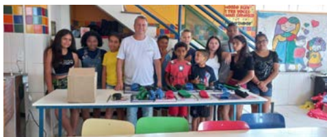
Turno da tarde