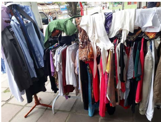
AÇÃO: valor da venda vai ajudar EMEF Timbaúva

damental - EMEF Timbaúva, no Bairro Mário Quintana.