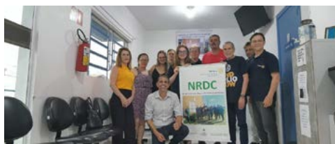
REUNIÃO: NRDC, na Unidade Santa Isabel