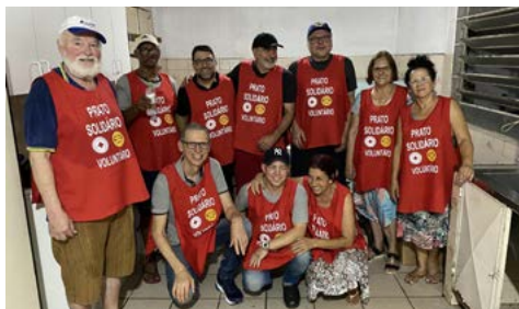
GRANDE PROJETO: e um grande time

Contato com os companheiros comprometidos em Criar Esperança no Mundo e servir impactando vidas: @rotary.club.sl.sul.