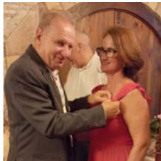
...Presente para o Governador