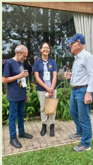
GOVERNADORES e a jovem rotariana