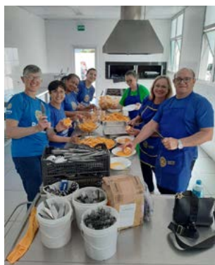
DEDICAÇÃO: companheiros prepararam tudo