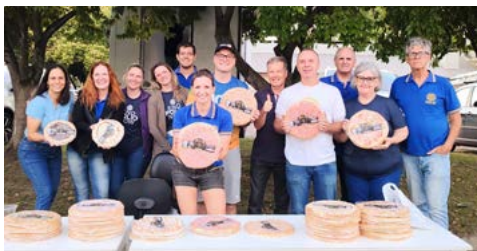
SUCESSO: um grande mutirão

“Levar um presente para uma criança que não tem nada, vai além de dar um brinquedo: é levar esperança de que o homem pode ser melhor a cada dia. As pessoas têm a capacidade de mudar e fazer o bem. Basta estender a mão e mostrar que se importa. Sob o lema do ano, Crie esperança no mundo, nosso objetivo neste Natal foi alcançado”, explicam os companheiros.