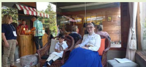
Futuro companheiro, ao lado da mãe