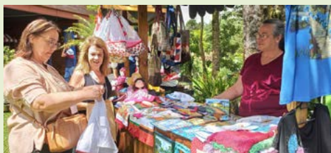
Confeções para o ano todo