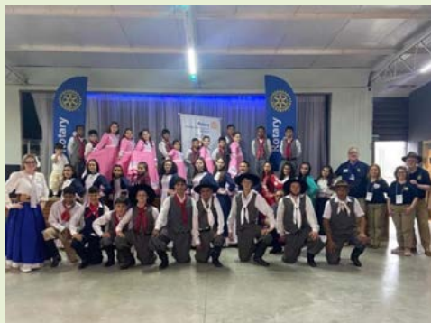
TRADIÇÃO: as apresentações preservam a cultura