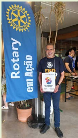
Governador convidando para o próximo RotaryTchê