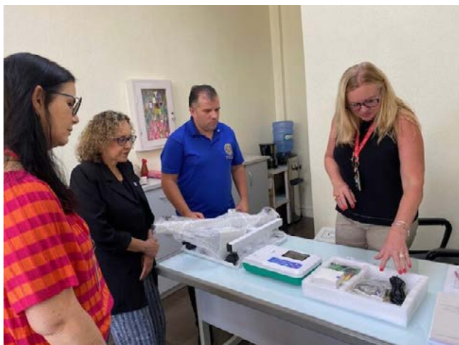
ELETROCARDIÓGRAFO: atendendo necessidades