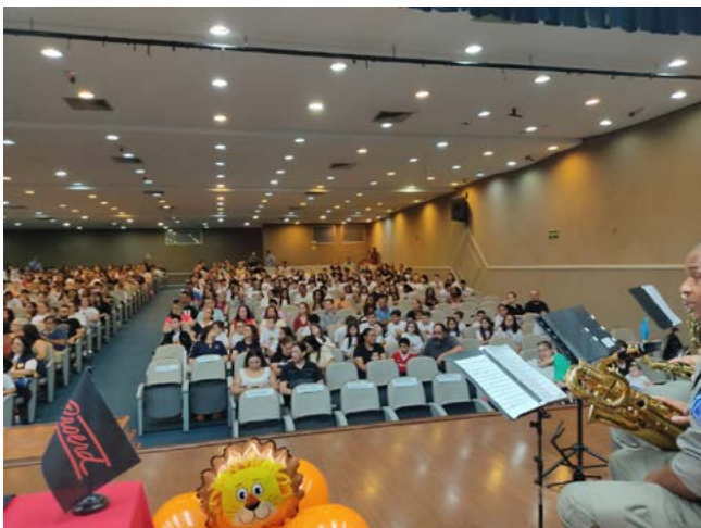
BRIGADA MILITAR: coordenadora do Proerd

para a vida. Parabéns a todos os envolvidos nesse maravi-