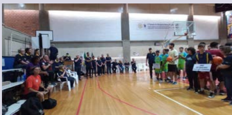
1º Torneio de Basquete Rotary/Sogipa - 2023