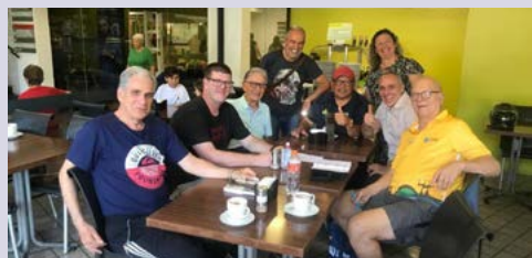
INTERVALO: companheirismo continua