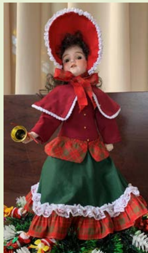
Boneca centenária: exposta no RotaryTchê