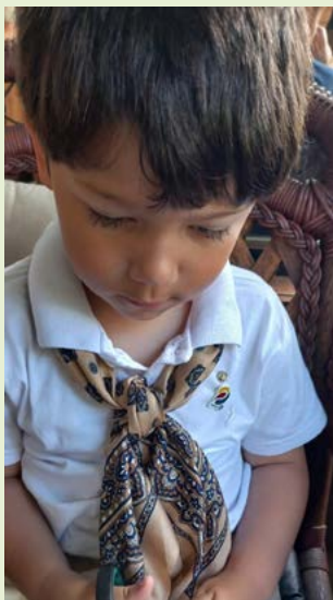
MASCOTE: à espera para entrar no Rotary Kids