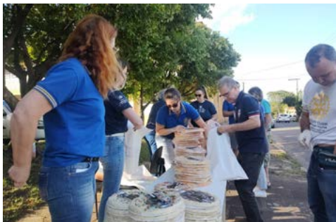
EMPENHO: ajuda da comunidade e da mídia