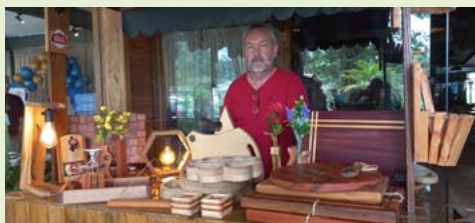
Arte em madeira