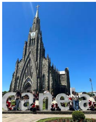
SERRA: passeio, diversão e memórias

Para chegar até o dia da realização do baile são muitos envolvidos, e resulta o sucesso do projeto de esforço árduo e comprometimento de todos, principalmente das senhoras da Casa da Amizade. Elas já estão programando o próximo baile, planeja-