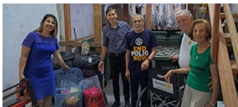
DEPÓSITO: tampinhas e lacres