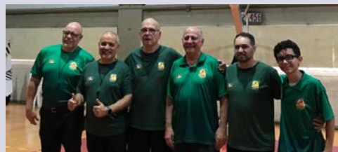
ÁRBITROS: de olho nos lances