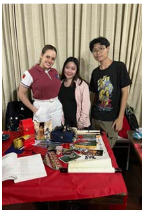
Tirando as dúvidas