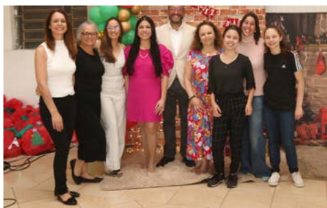
EQUIPE: trabalho que gratifica

A noite foi de emoção e muitos sorrisos, especialmente nos abraços ao bom velhinho, que entregou brinquedos e doces para todas as crianças. Segundo o presidente da