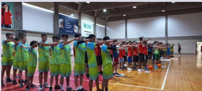
JURAMENTO: lealdade na quadra

Na primeira parte, a entradas dos estudantes já demonstravam o nível de preparo dos atletas para a competição. No alinhamento para o canto dos Hino Nacional Brasileiro, Rotário e da Sogipa, a concentração e o orgulho por representarem suas escolas, diante de autoridades rotárias e civis, da Sogipa, professores e convidados.