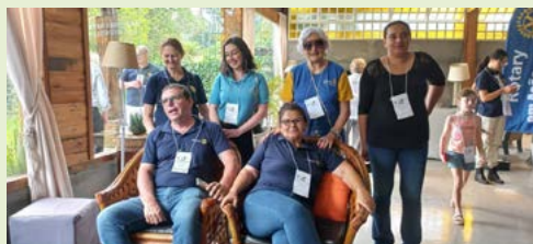
Encontro de amigos