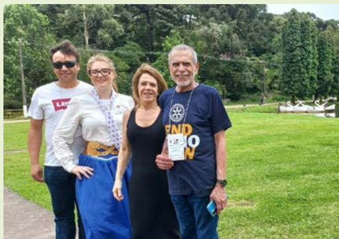
PAISAGEM: preservação natural

Segundo o Instituto Nacional de Meteorologia é o município mais chuvoso do Rio Grande do Sul. Em clima da Serra, no cenário campos e florestas de araucária, abrigam cachoeiras de água pura e cristalina, trilhas ecológicas e incontáveis mirantes que convidam o visitante à contemplação.