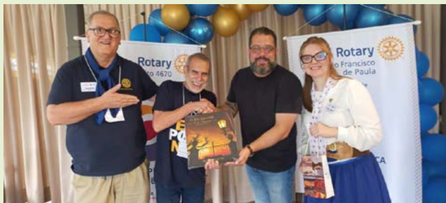
IMAGEM PÚBLICA e a troca de gentilezas