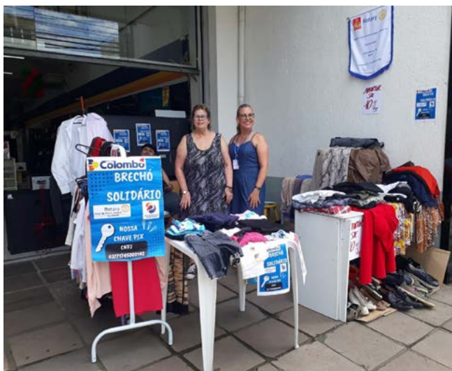
IMAGEM PÚBLICA: em frente à Lojas Colombo

O resultado financeiro da ação será composto com receitas de outras ações e destinado à aquisição de calçados para a equipe feminina de futsal da Escola Municipal de Ensino Fun-