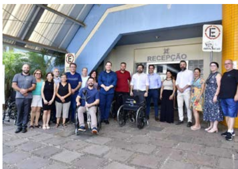
PROJETO: engajamento da comunidade e instituições