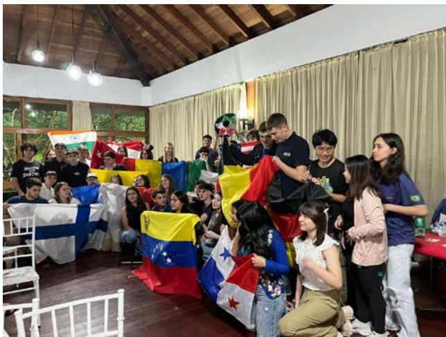
Experiência: intercambistas orgulham-se dos seus países

Depois, ainda por ordem alfabética, porém inversa, cada candidato fez um teste de fluência em Inglês.