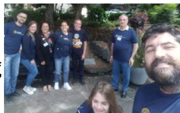
ORGULHO: marco rotário