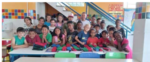
Turno da manhã

As crianças moram no Morro Santana, mesmo local da Associação, em Porto Alegre.