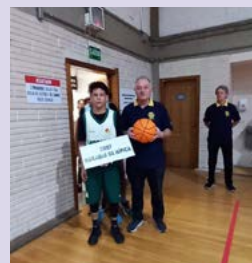
3º Lugar: EMEF Moradas da Hípica