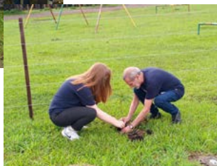
PARQUE DA RONDA: Governador plantando árvore