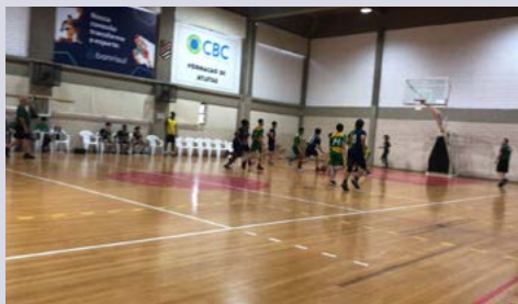
COMPETIÇÕES: tradição do Porto Alegre-São João, agora com basquete