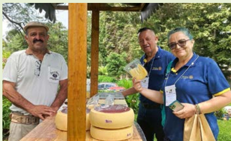
PRODUTORES: exposição e venda de iguarias