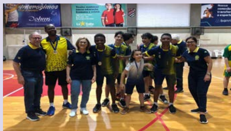
CAMPEÃ: C.E.M. Pastor Dohms - Unidade Alvorada