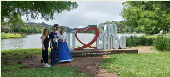
LAGO SÃO BERNARDO: cartão postal

Bernardo era a pitada sobre o que encontrar na região e justificando também o envolvimento do Rotary São Chico com a comunidade.