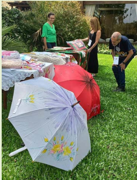
ARTE: produção local

Das 10h da manhã de domingo até o final da tarde, a presença de produtores do mercado serrano de São Francisco de Paula, oportunizou a comercialização de queijos, pães caseiros, produtos artesanais e essências.