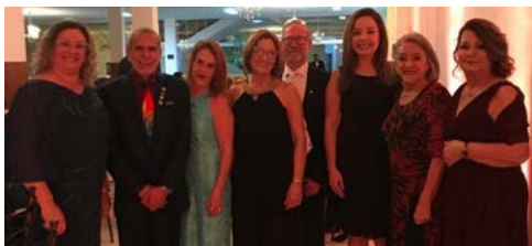
DISTRITO 4670: Governador Luiz Gonzaga Gonçalves participou