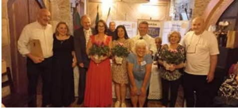
FESTIVA: encerrando o ano