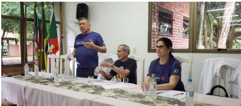
SELEÇÃO: quatro estudantes rigorosamente empatados