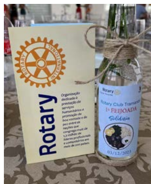
IMAGEM PÚBLICA: na decoração