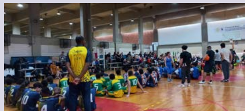
EQUIPES: todos na mesma condição