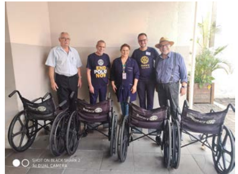
HOSPITAL DE TAQUARA: cadeiras de rodas doadas pelo Rotary Club de Taquara