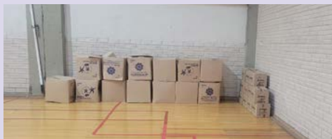
DOAÇÃO: Livros para estudantes e bibliotecas