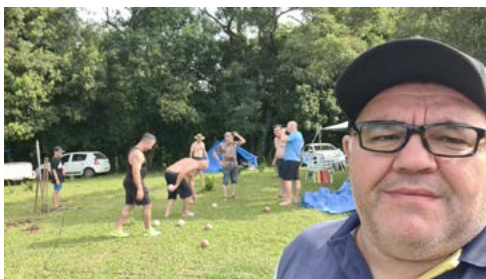
DIVERSÃO: fortalecendo amizades e unindo os companheiros