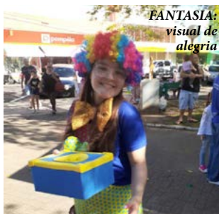
FANTASIA: visual de alegria

“Além do brilho nos olhos das crianças, foi notável o orgulho dos pais que ali estavam acompanhando a ação rotária. Parabéns Interact Clube de Parobé”, comemoraram os rotarianos e interactianos.