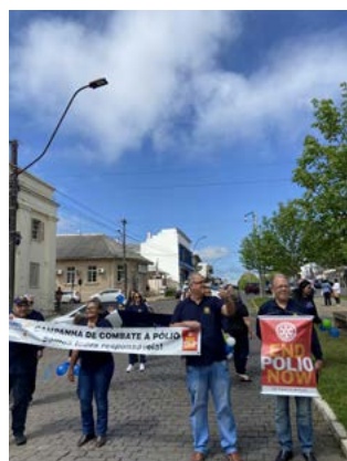
CAMINHADA: campanha permanente para erradicar a pólio

- Tanto este 1% que irá desenvolver algum tipo de paralisia, quanto os 99% que tiveram contato com o vírus sem qualquer sequela imediata, podem vir a sofrer no futuro da síndrome pós-pólio. Essa doença, recentemente descoberta, atinge cerca de 50% das pessoas que na infância foram infectadas com o vírus.