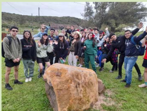
Intercambistas junto à pedra que encobre a Cápsula do Tempo, colocada durante a Conferência Distrital 2022-23, em Torres.