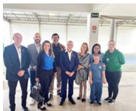
APAE de Dois Irmãos

de setembro. “É muito bom ter pessoas dedicadas aos outros e quando essas pessoas estão ligadas a uma instituição como o Rotary, é muito melhor”, disse o prefeito. A comitiva do Governador visitou também o Jornal de Dois Irmãos. A Festa conteceu no Restaurante Baumschneis