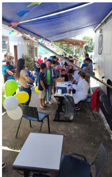
PROFISSIONAIS: sem intervalo