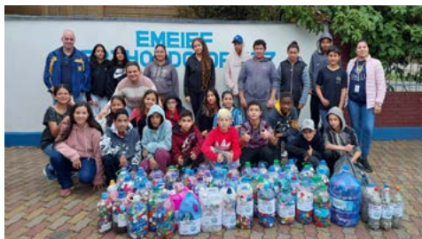
ESCOLA: parceria com clube de Canela que ajuda a APAE

A escola é composta de 426 alunos e trabalha ainda com a compostagem de resíduos orgâni-