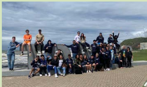
A praia e seus encantos