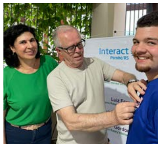
ORGULHO: o pai coloca o pin e deseja sucesso ao filho, o novo associado