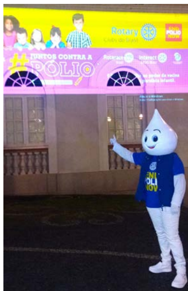
ZÊ GOTINHA: mascote da luta pelo fim da pólio

Contraindicada para pessoas imunodeprimidas (que