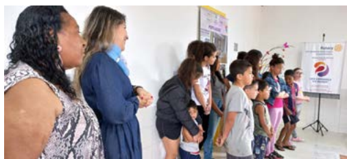
AGRADECIMENTO: crianças cantaram