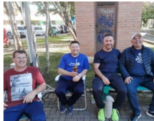
PAUSA: pais acompanharam as brincadeiras