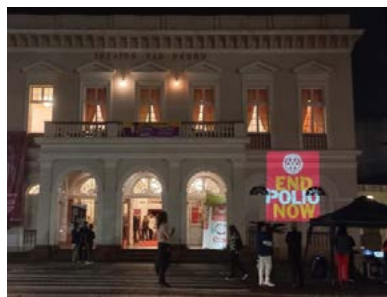
THEATRO SÃO PEDRO: divulgação em dia de espetáculo