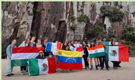
TORRES: Morro da Guarita ficou colorido com as bandeiras dos países dos inbound