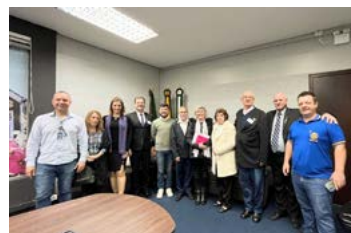
PREFEITURA: portas abertas para o Rotary