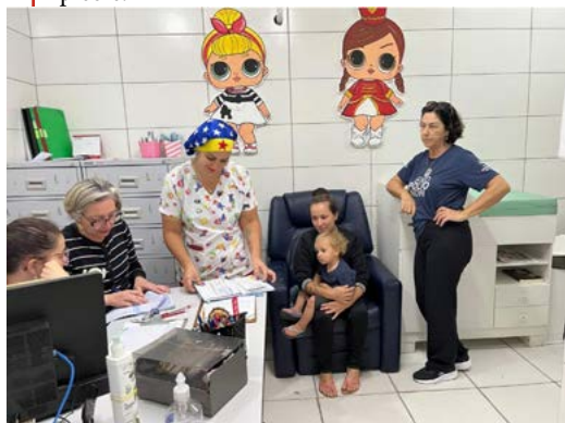
SAÚDE: no controle das vacinas

O Rotary Club de Torres realizou no dia 21 de outubro, Dia D da Campanha Nacional de Multivacinação de crianças e adolescentes, uma atividade com brinquedos infláveis. A ação foi em parceria com a Prefeitura Municipal. Após a vacina seguida de um chorinho, as crianças brincaram, pularam, escorregaram e ganharam picolé.