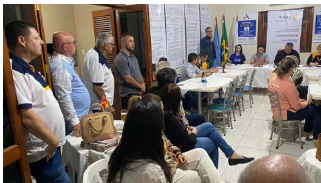
TRABALHO: clubes unidos buscam o fortalecimento das ações