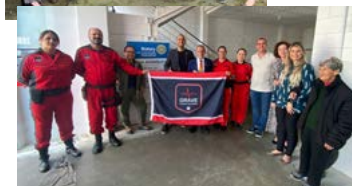
GRAVE: Resgate Voluntário