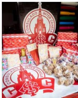
CONSULADO DO INTER: unido à Campanha