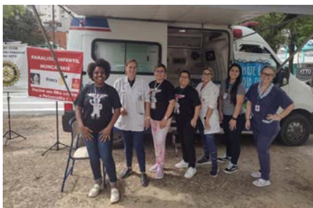
UNIÃO: muitos braços pela mesma causa