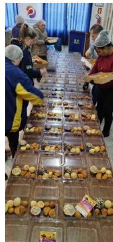
DELÍCIAS: como a criança gosta