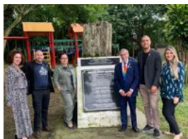
PAUL HARRIS: praça em homenagem ao fundador do Rotary