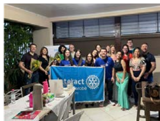
Atividades concentradas numa noite