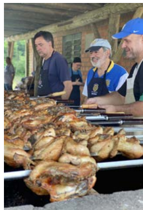
SUCESO: 2000 meios frangos vendidos