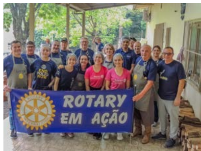
ROTARY: orgulho de fazer parte desta instituição mundial