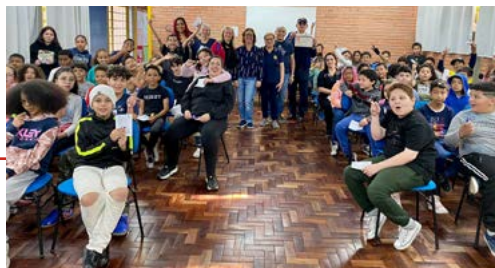
ROTARIANOS: na luta pela informação