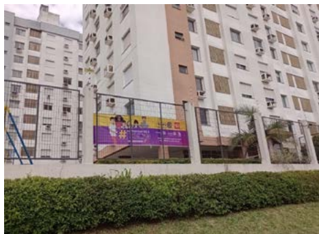
CONDOMÍNIO: todo espaço é válido