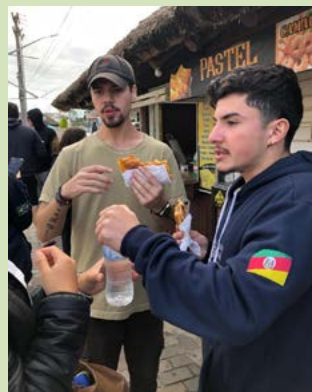
Pastel sempre é uma pedida

Os jovens aprovaram muito a comida brasileira. Os mexicanos e colombianos só acrescentaram pimenta forte, tempero usual da culinária em seus países.