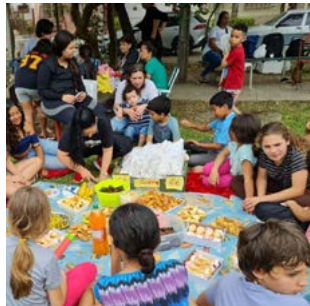
DELÍCIAS: tudo o que criança gosta

chamavam os companheiros associados do Rotary Club de Porto Alegre-São Geraldo, acolhendo a garotada para a diversão.