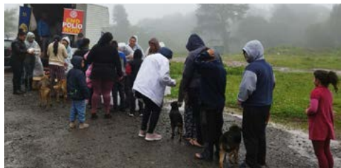
FRIO: tudo pela alegria da gurizada

A chamada para fazer um lindo Dia das Crianças do Rotary Club de Canela resultou numa festa com a entrega de 520 kits, no dia 15 de outubro, dia da garotada. A proposta era presentear 500 crianças e, o objetivo foi ultrapassado, deixando-as felizes, comemoram os rotarianos do Canela. Os companheiros agradeceram a ajuda de todos que contribuíram para o sucesso da ação.