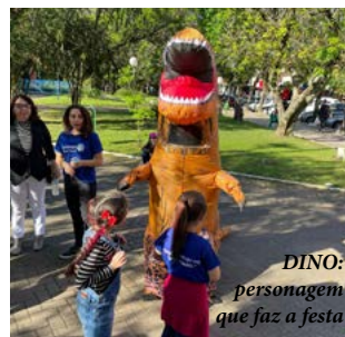
DINO: personagem que faz a festa