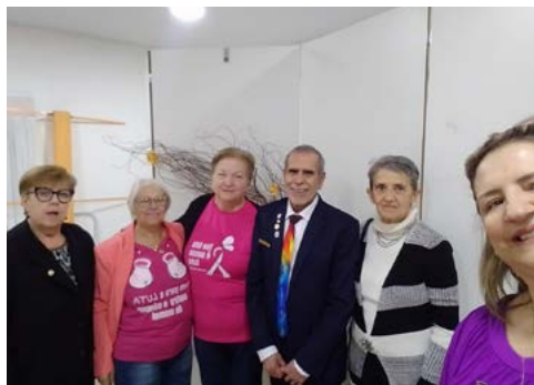
PROJETO: recebe apoio do clube