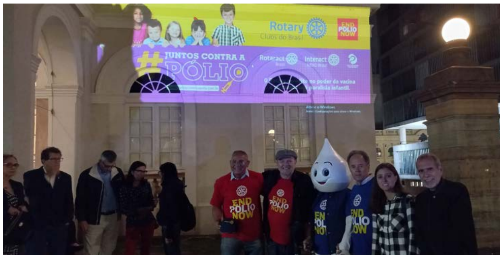
UNLÃO: distritos 4670, 4680 e FURPA