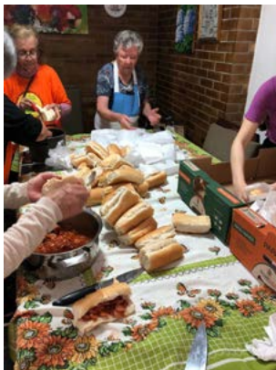
PREPARO: todo cuidado com os ingredientes

chamavam os companheiros associados do Rotary Club de Porto Alegre-São Geraldo, acolhendo a garotada para a diversão.