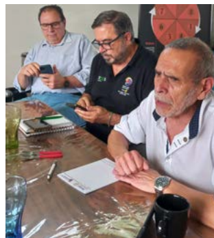
SOCORRO: ações discutidas diariamente

Sobre a criação da Comissão Multi-Distrital, o governador Gonzaga explica que "a ideia é a formação de uma comissão oficial, permanente, unindo os cinco distritos", e diz que "todos foram pegos de surpresa."