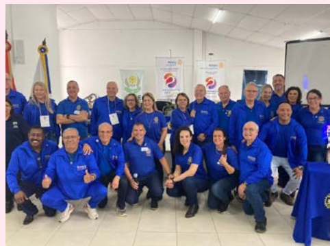
Rotary Club de Cahoeirinha, o anfitrião