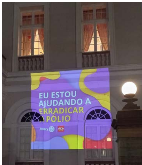
PROJEÇÃO: a luta precisa continuar