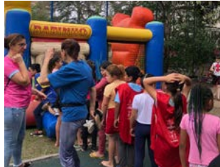
INFLÁVEIS: sempre uma atração imperdível