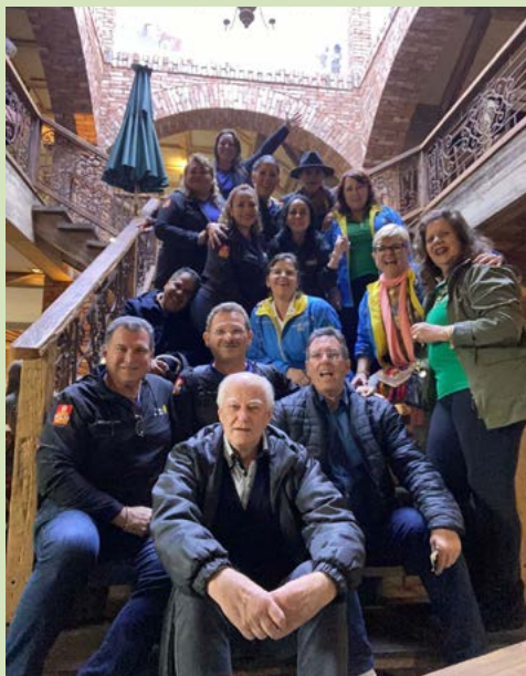
ALEGRIA: sempre é tempo de se divertir

No Intercâmbio da Amizade os participantes podem viajar sozinhos, acompanhados, com a família ou em grupo, e não precisam necessariamente ser associados de um Rotary Club.