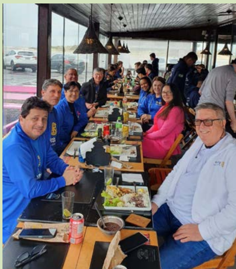
Almoço no Restaurante Confraria da Praia, em Imbé

Muitas caminhadas, trilhas, subidas em morros, fotos, piquenique, futebol e alguns se encorajaram a tomar um banho de mar. A alegria pairava no ar.