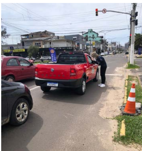
NAS RUAS: Toda a forma de divulgação

Rotarianos pelo mundo realizam durante este mês, ações sobre a importância da vacinação para a imunização desta doença que deixa sequelas quando há a contaminação. O Rotary trabalha para erradicar a doença há mais de 35 anos.