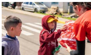
Brinquedos é alegria das crianças

Em parceria com a delegacia de Polícia de Canela e o Consulado do Inter de Canela, o Rotary Kids Club de Canela-Inspiração realizou a Campanha de Coleta e Doação de Brinquedos. Os itens arrecadados foram doados no Dia da Criança, 12 de outubro, em comunidades de baixa renda da cidade.