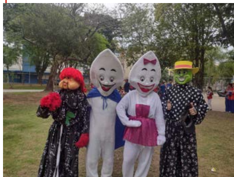
ENCANTO: Zé Gotinha no mundo da fantasia

No sábado, 28 de outubro, o Rotaract de São Leopoldo participou, junto aos rotarianos dos clubes de São Leopoldo, do Dia Mundial de Combate a Paralisia Infantil. O evento foi realizado na Praça Daltro Filho e encerrou a campanha de vacinação no município. E contou com rotarianos, rotaractianos e o setor de imunização da Secretaria Municipal da Saúde. A tarde foi animada com a distribuição de balões e a apresentação das bandas das escolas Franz Luiz Weinmann e Amadeo Rossi. A presença do Zé Gotinha fortaleceu a campanha.