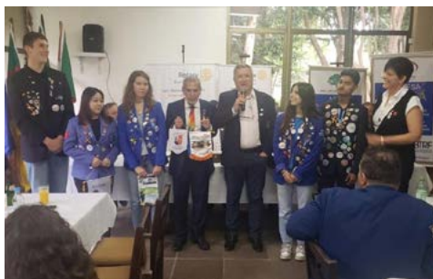
INTERCAMBISTAS: prestigiando o Governador