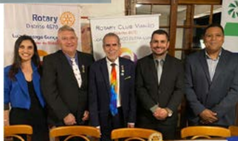
FESTIVA: comemoração à visita do Governador