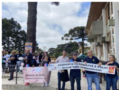
CAMINHADA: atividade reuniu rotarianos e secretaria da Saúde