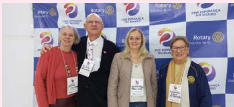
PRESTÍGIO: companheiros unidos