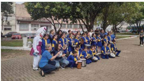
INTEGRAÇÃO: Banda da escola Franz Luiz Weinmann

No sábado, 28 de outubro, o Rotaract de São Leopoldo participou, junto aos rotarianos dos clubes de São Leopoldo, do Dia Mundial de Combate a Paralisia Infantil. O evento foi realizado na Praça Daltro Filho e encerrou a campanha de vacinação no município. E contou com rotarianos, rotaractianos e o setor de imunização da Secretaria Municipal da Saúde. A tarde foi animada com a distribuição de balões e a apresentação das bandas das escolas Franz Luiz Weinmann e Amadeo Rossi. A presença do Zé Gotinha fortaleceu a campanha.