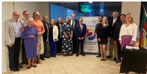
ROTARIANOS: equipe completa