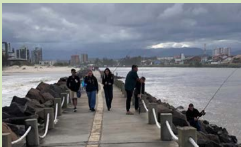
Plataforma em Torres