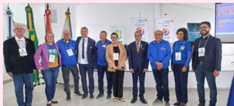
PALESTRANTES: pratos da casa