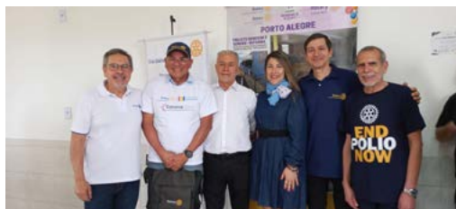
ROTARIANOS: lideranças do D4670 prestam homenagem à companheira