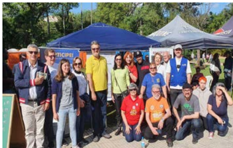
ROTARY: aproveitando todos os espaços

No domingo, 1º de outubro, a FURPA – Fundação dos Rotarianos de Porto Alegre, participou, a convite do Rotary Club de Porto Alegre-Bom Fim, do Distrito 4680, de uma festividade no Parque da Redenção, em Porto Alegre, em comemoração aos 88 anos do parque. Os rotarianos instalaram um gazebo para receber doações do público, em benefício aos desabrigados de Porto Alegre, vítimas dos temporais de setembro. Eles aproveitaram, também, o espaço para uma ação de Imagem Pública.