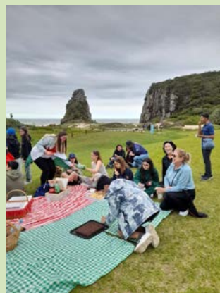
PIQUENIQUE: diversão confirmada