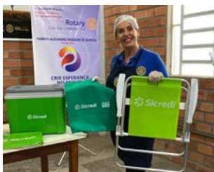
PERCERIA: importante participação