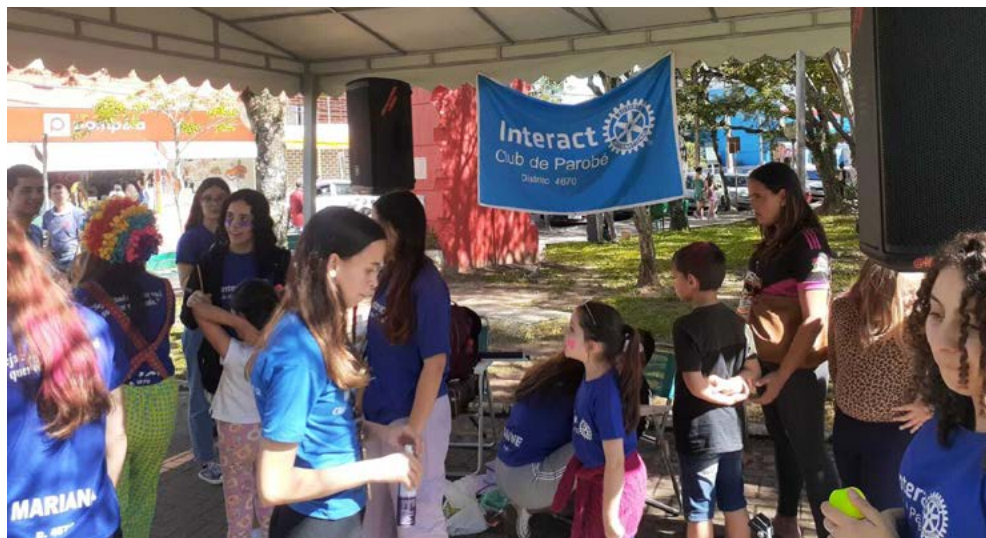
INTERACTIANOS: atividade na praça junto ao marco rotário