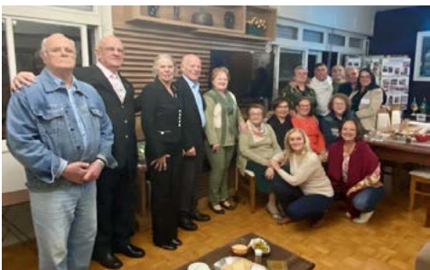
CONFRATERNIZAÇÃO: presença de familiares, amigos e convidados