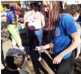
SPRAY: cabelos coloridos