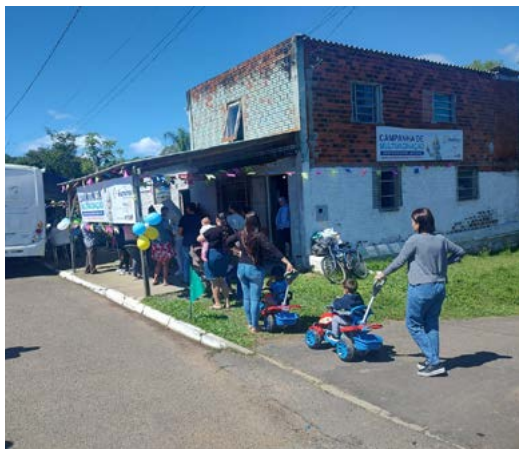
PROCURA: atendeu as expectativas