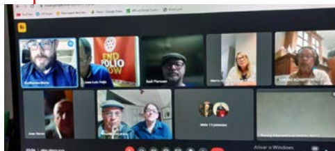
ON-LINE: Rotary para o Rotary