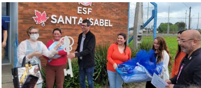
INCENTIVO: Kit Bebê Prefeito leva a chave da cidade