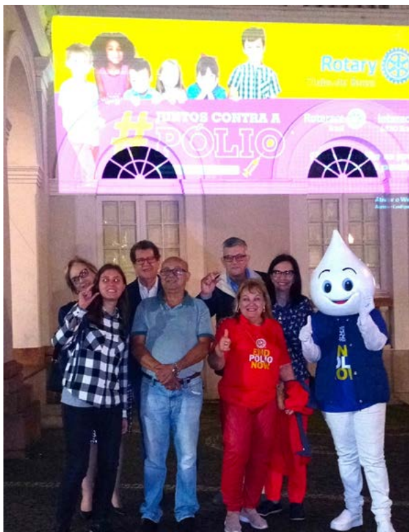
UMA CAUSA: Distritos 4680 e FURPA