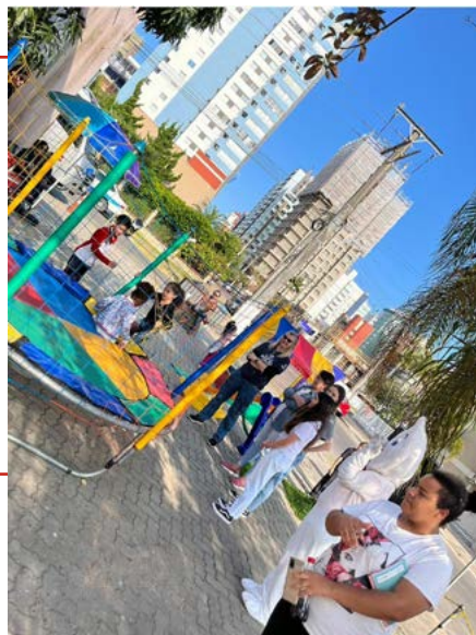
BRINCADEIRAS: alegria depois da vacina