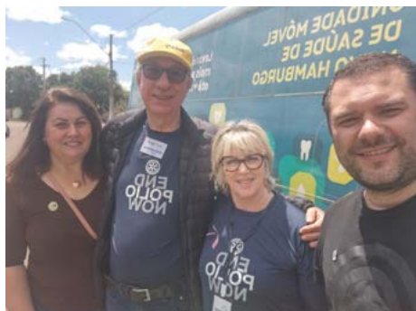
UNIÃO: companheiros do NH-25 de julho