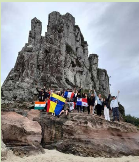
GUARITA: subir é irresistível