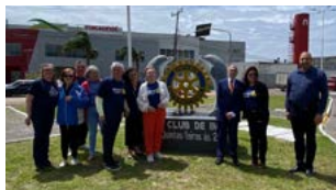
MARCO ROTÁRIO: acesso principal