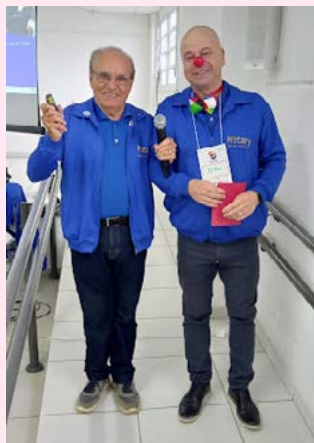
DESCONTRAÇÃO: companheiro marcou o tempo das falas

Com entusiasmo e parafraseando o Presidente de Rotary International 2025-26 Mário César Martins de Camargo, com a expressão “chão de fábrica”, Eliseu fez uma síntese de como tudo pode ser realizado quando o foco estiver sendo trabalhado com o olho no futuro e obedecendo cada etapa que compete e, deve ser seguida, enquanto ativi-