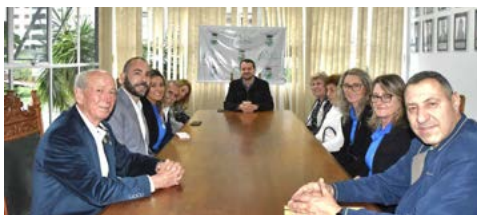
Reunião com o prefeito