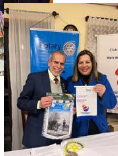
PRESENTES: governador e presidente trocaram flâmulas