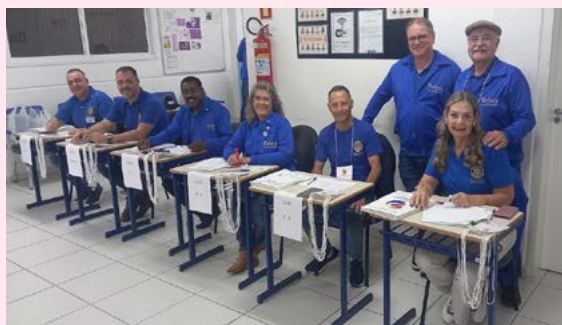
RECEPÇÃO: tudo pronto para o Seminário