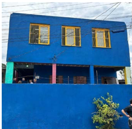
MULTIFUNCIONAL: no coração da Bom Jesus o espaço chama a atenção