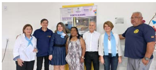
ORGULHO: um trabalho conjunto da comunidade