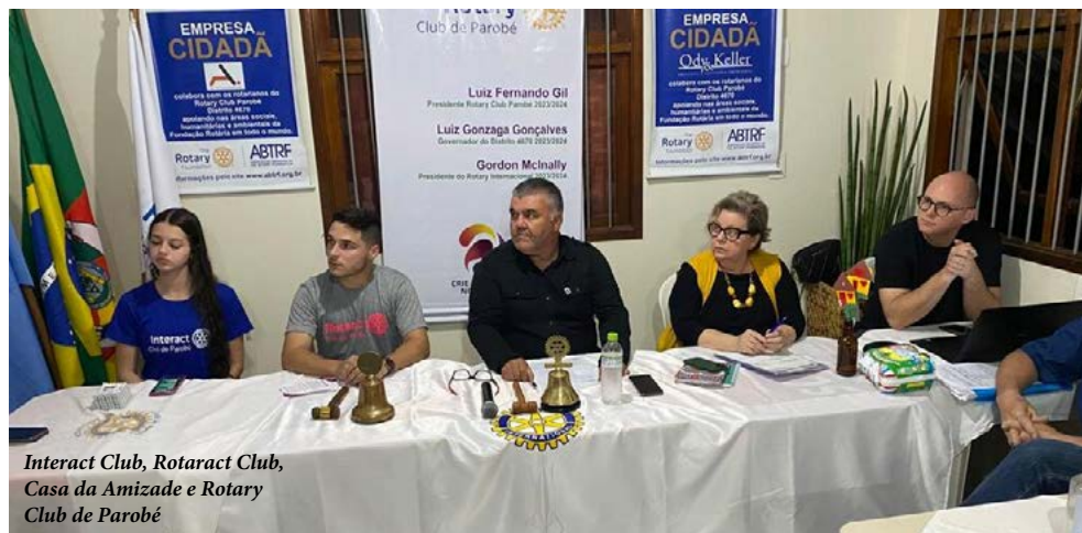
Interact Club, Rotaract Club, Casa da Amizade e Rotary Club de Parobé