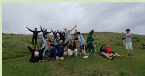
E viva a liberdade!!!!!!