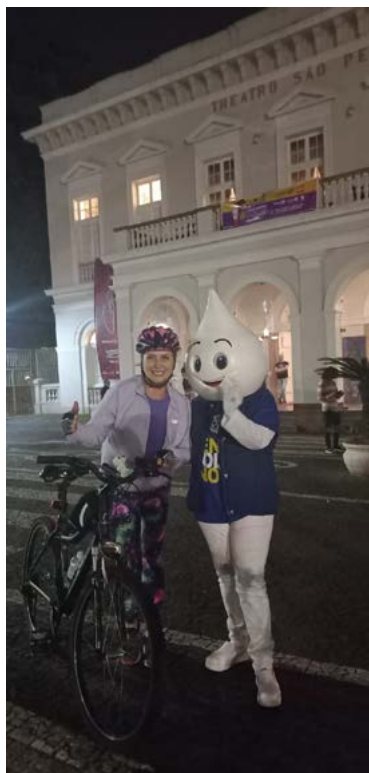
IRRESISTÍVEL: mascote chama atenção de todos