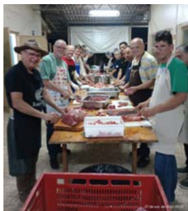
UNIÃO: noite de sexta-feira o carreiro sendo preparado