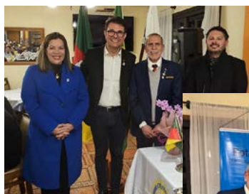
Clube renovou mais um ano como Clube Cidadão