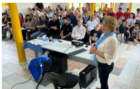
PROJETO: comunidade conheceu o passo a passo da obra