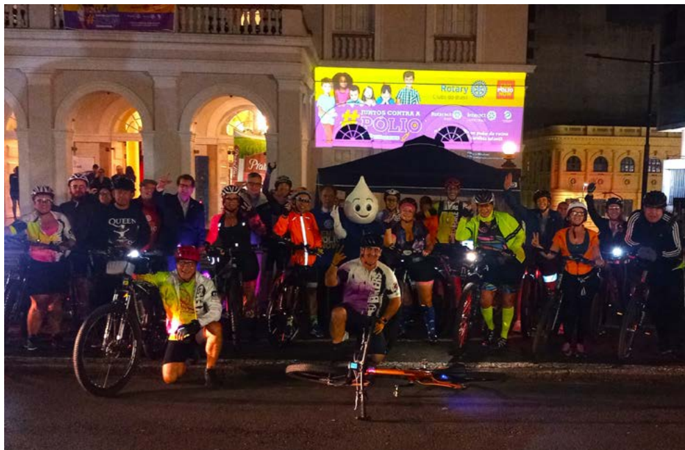
BIKERS POA: passando pela Vigília juntaram-se ao movimento