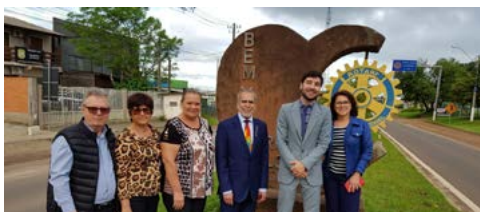
Comitiva do Governador no Marco Rotário