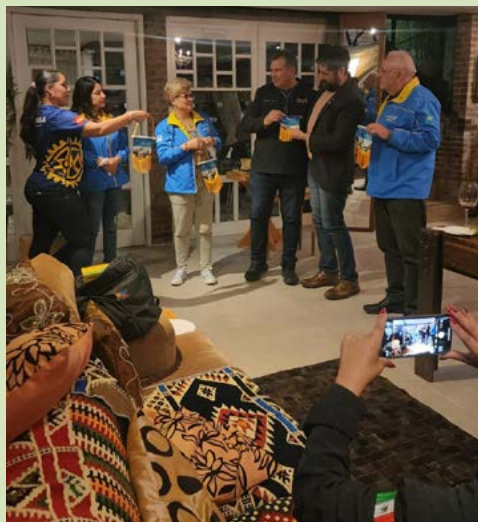
ALEGRIA: sempre é tempo de se divertir