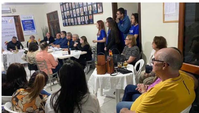
ENCONTRO: clubes alinham projetos

Um encontro para troca de conhecimentos e alinhamento de projetos sociais reuniu a família rotária de Parobé, dia 30 de outubro, na sede do clube rotariano, rua João Esteves, 198. O Interact Club, Rotaract Club, Casa da Amizade e Rotary Club de Parobé fizeram exposição e apresentação de projetos que estão em andamento e nortearam projetos futuros. O objetivo do alinhamento é aumentar a abrangência social dentro das possibilidades de cada clube. O encontro foi considerado uma confraternização de sucesso pelos companheiros.