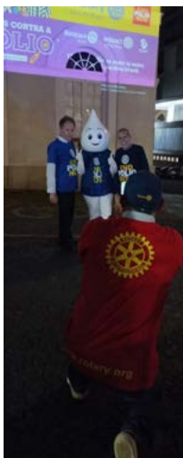
esforços concentrados

Os motivos para o alerta são vários. O principal deles é a baixa cobertura vacinal. Apesar da gravidade das sequelas provocadas pela pólio, o Brasil não cumpre, desde 2015, a meta de 95% do público-alvo vacinado, patamar necessário para que a população seja considerada protegida contra a doença.