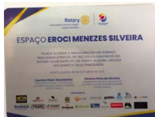
PLACA: homenagem ao trabalho e dedicação

Entre as autoridades rotárias participaram também o Gover-