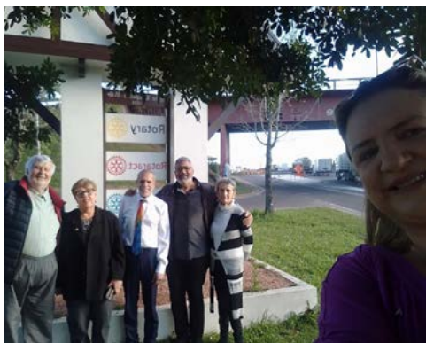
MARCO ROTÁRIO: orgulho dos rotarianos