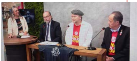
CONSCIENTIZAÇÃO: histórias de vida dos companheiros