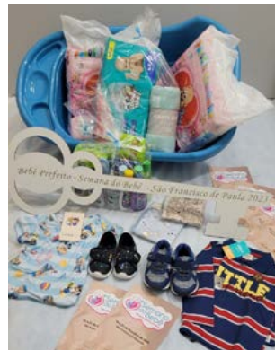
APOIO: itens para o incentivo