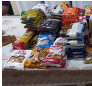
PRESENTES: para alegria de muitos

Foram arrecadados e entregues na Casa de Passagem: