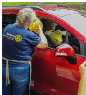
DISTRIBUIÇÃO: entrega no sistema Drive Thru