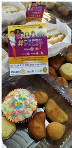
RECADO: vacinar é importante