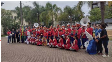
ATRAÇÕES: banda da escola Amadeo Rossi