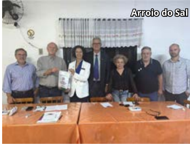
Arroio do Sal