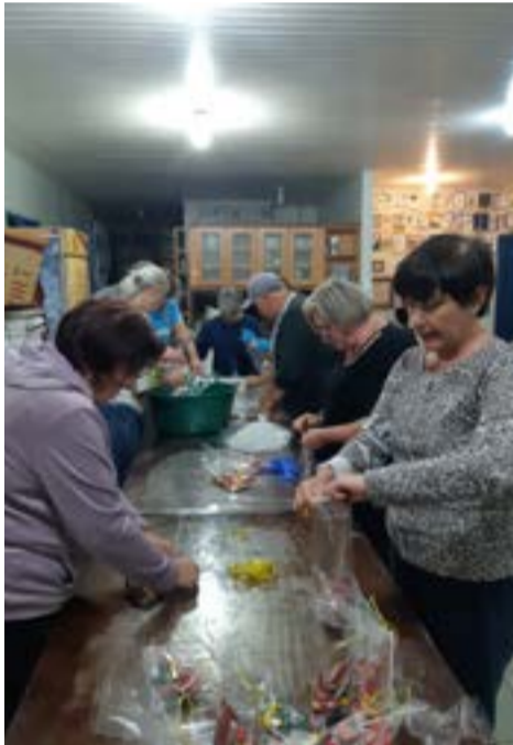
Comissão de Imagem Pública, Rotary Club de Canela.