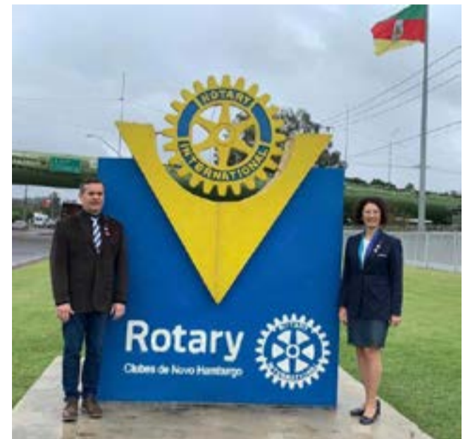
14/09 - Rotary Club de Novo Hamburgo-Monumento