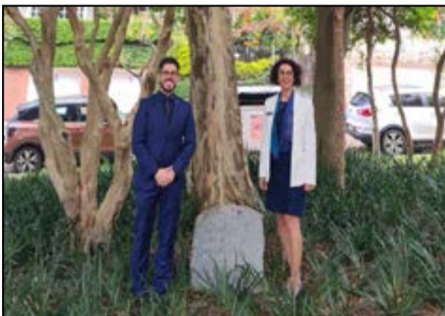
26/09 - Rotary Club de Porto Alegre-Nordeste