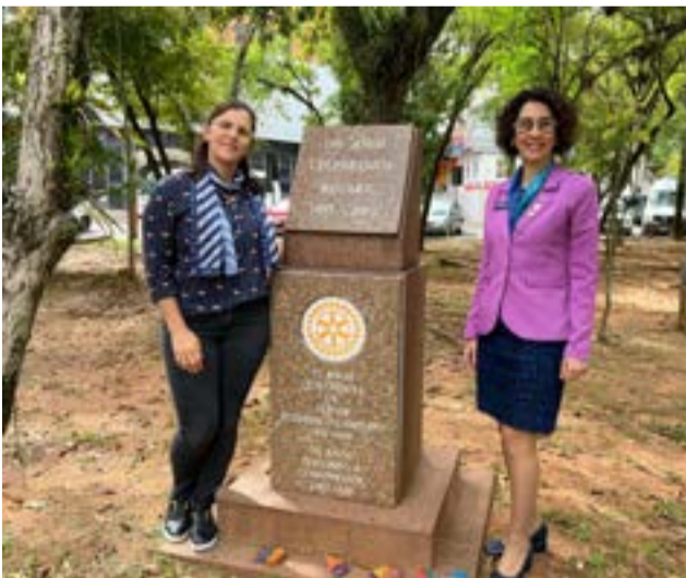
22/09 - Rotary Club de Novo Hamburgo - Acontece