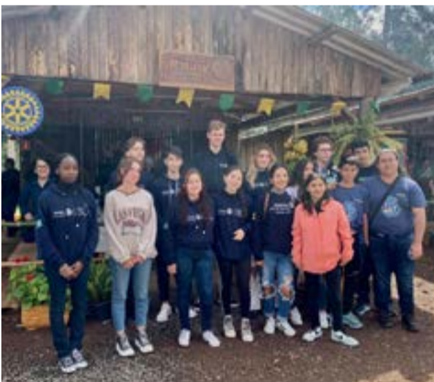
Inbounds no piquete do Rotary Club de Saporanga