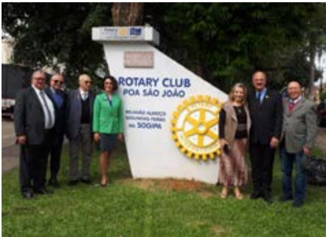
12/09 - Rotary Club de Porto Alegre-São João