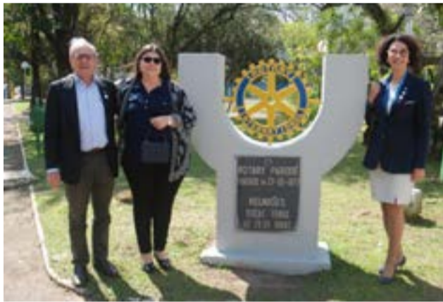
13/09 - RC de Parobé