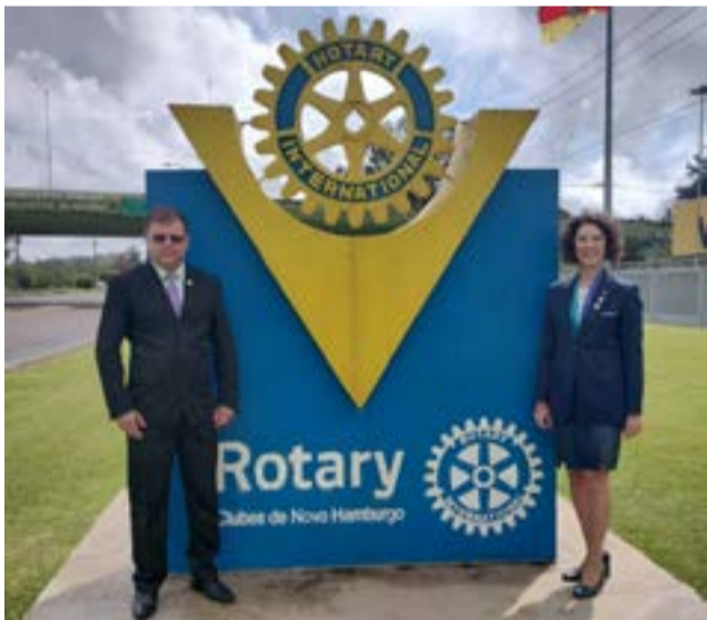
15/09 - Rotary Club de Novo Hamburgo - Oeste