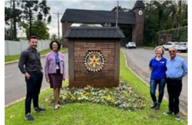
06/09 - RC de Ivoti e Satélite Meio Ambiente