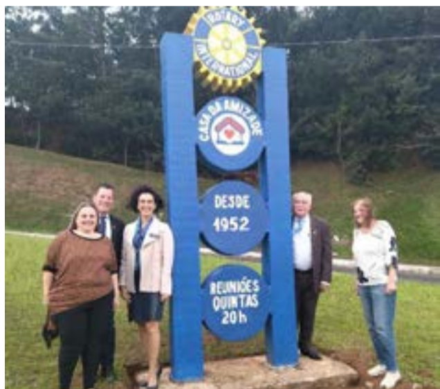
29/09 - Rotary Club de Taquara