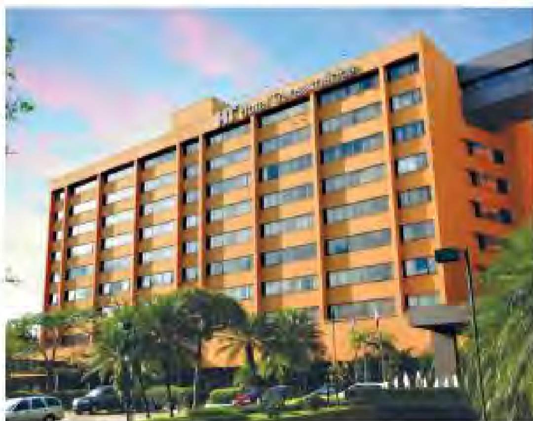
Na foto maior, a avenida Paulista, no coração da cidade que volta a receber o Instituto depois de 21 anos. Acima, a fachada do Hotel Transamerica, sede do evento

Aproveite este que está sendo chamado de Instituto do Reencontro para atualizar seus conhecimentos sobre o Rotary e voltar para casa com ideias de projetos e contatos para futuras parcerias. Além, é claro, de aproveitar a diversão e o companheirismo que só o Instituto pode proporcionar – especialmente em São Paulo, uma das cidades mais globalizadas e vibrantes do planeta. »»