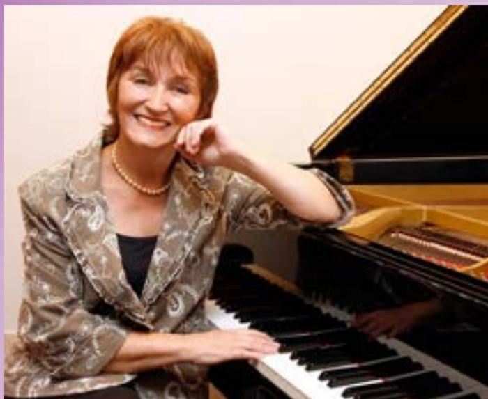
Pianista, com pós-graduação em Virtuosidade em Piano ,