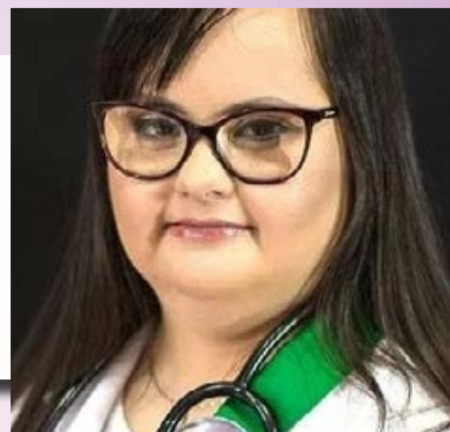
Primeira fisioterapeuta e vereadora com Síndrome de Down do Brasil. Graduada no curso superior de Fisioterapia na Faculdade CNEC, IESA de Santo Ângelo. Em 2020 concorreu para Vereadora, ficando na suplência com 633 votos.

Sua identidade: equilíbrio, disciplina, persistência e dedicação. Nas horas de lazer a fisioterapeuta gosta de escrever poemas, compor músicas, cantar, dançar e malhar. Continua estudando, frequentando cursos em Fisioterapia e participa dos movimentos políticos e sociais da Comunidade de Santo Ângelo. Faz parte das Associações das Famílias Down de Santo Ângelo e AFAD de Porto Alegre. Embaixadora da SEMEARHIS (Startup de Impacto Social voltada para o relacionamento humano, especializada na inclusão assertiva de pessoas com deficiência). Bandeira que sempre defenderá: Preconceito, diferenças e inclusão. Será a porta voz das mulheres, jovens e pessoas com deficiência.