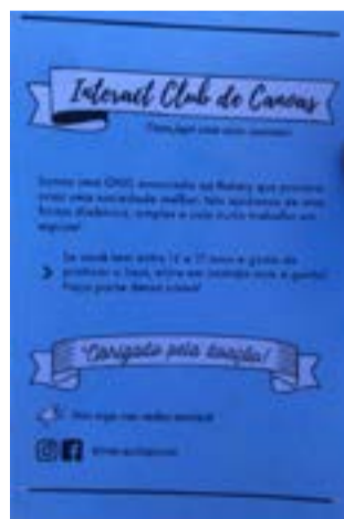
Panfletos foram distribuídos na ação Natal do Bem

da pelo Banco de Alimentos aconteceu no sábado, 11 de dezembro. Foi o 1º Drive-Thru do Natal do Bem, que é realizado simultaneamente em diversas cidades gaúchas.