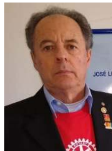
Feijó: doações ajudam a custear as vacinas, transportes e materiais usados para o combate à poliomielite.

O Rotary International tem como parceiros os governos dos países, a OMS-Organização Mundial da Saúde, Unicef, Fundação Bill e Mellinda Gates,