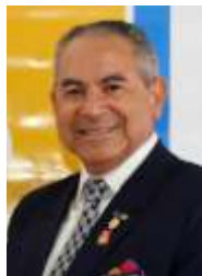
Governador Miguel Dias