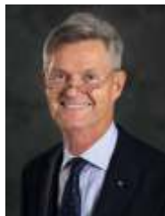
Holger Knaack Presidente, 2020-21

F evereiro, além de ser o mês do aniversário do Rotary (no dia 23), é também dedicado à promoção da paz. E há uma razão para isso: contribuir à paz e à compreensão mundial tem sido uma grande prioridade para nós desde o início.