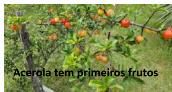
Acerola tem primeiros frutos