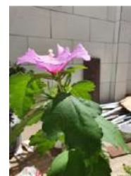
Rosa de Sharon floresce pela primeira vez