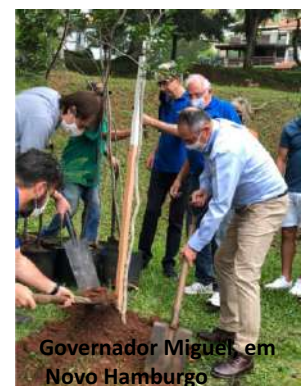
Governador Miguel em Novo Hamburgo