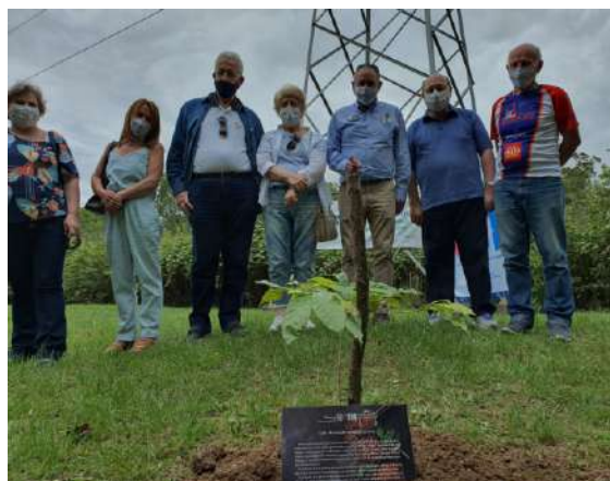
Café, energia para quando a pandemia for embora