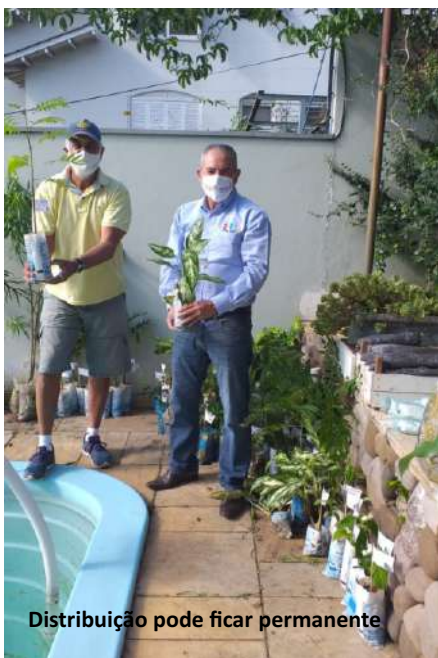
Distribuição pode ficar permanente