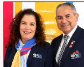
GOVERNADOR 2020-21 MIGUEL BARBOSA DIAS e ESPOSA ELIANE BITTENCOURT DIAS