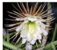
Rainha da Noite