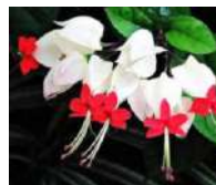
Lágrima de Cristo