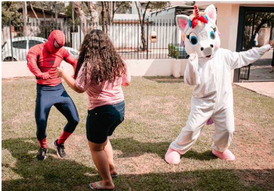
Projeto levou super-heróis e guloseimas para 115 crianças do Lar Colmeia