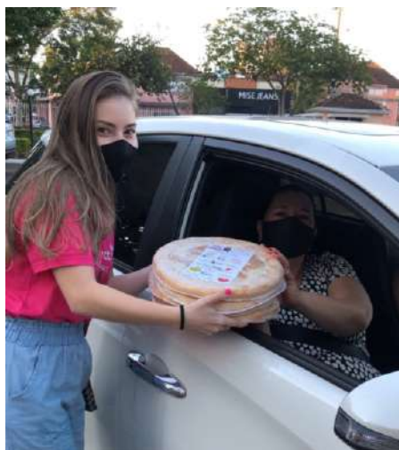
Ação teve renda líquida de R$ 8 mil