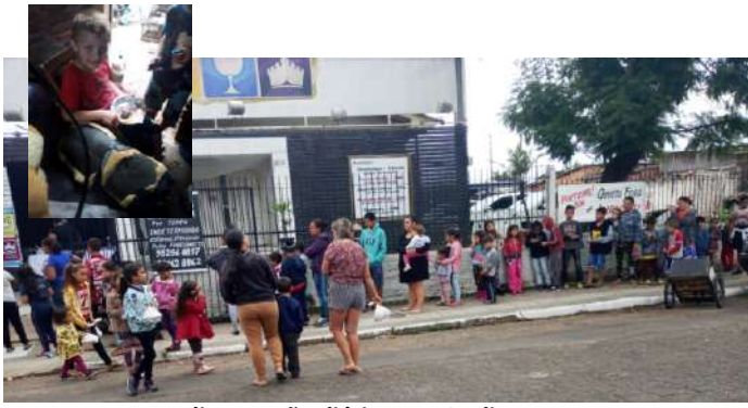
Rotary manteve alimentação diária por 164 dias