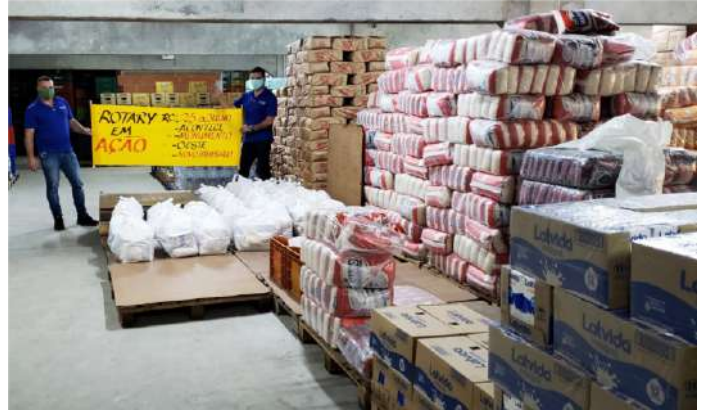
Projeto uniu cinco Rotary Clubs, Rotaract e Interact de N. Hamburgo