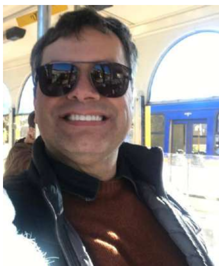
Kleber, São Francisco de Paula