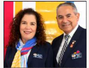
GOVERNADOR 2020-21 MIGUEL BARBOSA DIAS e ESPOSA ELIANE BITTENCOURT DIAS