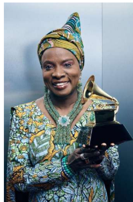
Angélique Kidjo, duas vezes ganhadora do Grammy, foi atração do Dia Mundial contra Pólio

O Rotary já contribuiu com mais de US$ 2,1 bilhões à erradicação da poliomielite desde que lançou o Pólio Plus em 1985, e está empenhado em levantar anualmente US$ 50 milhões para atividades de erradicação. Graças ao acordo de equiparação de 2 para 1 com a Fundação Bill e Melinda Gates, isso significa que, todos os anos, US$ 150 milhões são destinados ao cumprimento da promessa do Rotary de que nenhuma criança voltará a sofrer os efeitos devastadores da poliomielite.