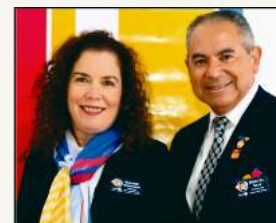
GOVERNADOR 2020-21 MIGUEL BARBOSA DIAS e ESPOSA ELIANE BITTENCOURT DIAS