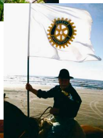
Departamento de Tradições Gaúchas