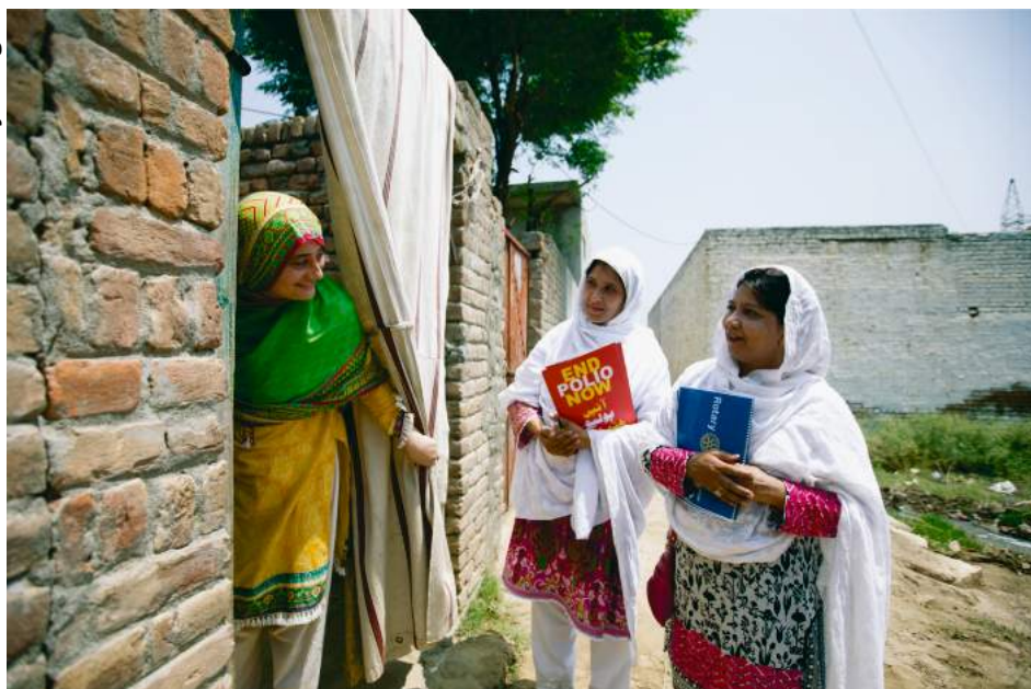
Companheiras do Rotary Club de Islamabad (Paquistão) trabalham pela erradicação da pólio