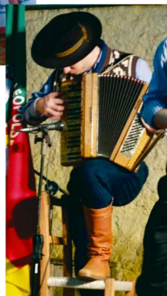
Volta o Festival Rotary Em Cano