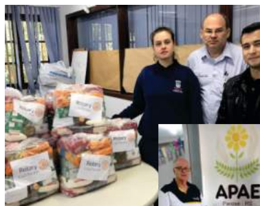
Rotary Club de Parobé

Os que já passaram dos 60 mobilizam contatos virtuais para buscar apoios e os jovens fazem a ajuda chegar onde deve chegar, como é o caso do Porto Alegre Leste que tem provido com cestas básicas famílias bastante necessitadas entre elas, de pais dos alunos da Escola Aldo Locatelli, onde o clube implantou uma horta comunitária. O clube também providenciou máscaras profissionais para o Hospital Conceição e auxiliou a Pequena Casa da Criança e o Educandário São João Batista com utensílios para cozinha industrial.