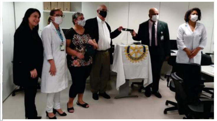
Rotary de Porto Alegre Leste redobrou atenções com instituições normalmente assistidas como o Educandário São João Batista