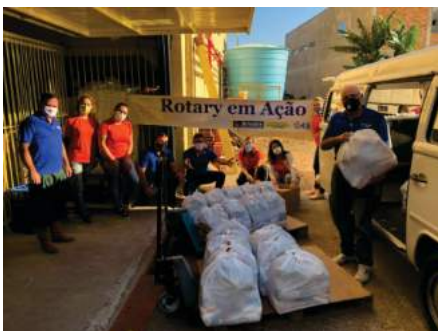
A família rotária trabalha unida em N. Hamburgo. Os jovens levam a ajuda aos necessitados