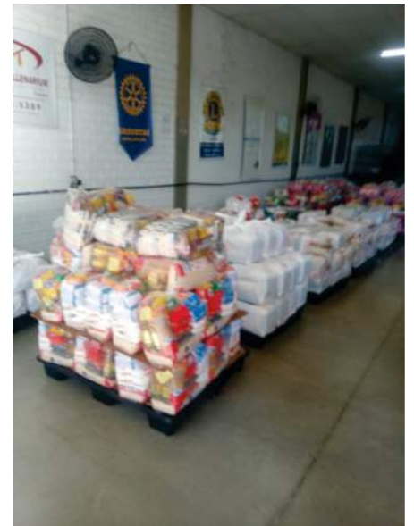
Novo Hamburgo é um exemplo, os quatro clubes, o Rotaract e o Interact uniram seus esforços, até no nome e se identificam apenas com Rotary