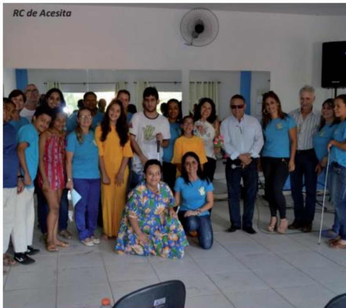
RC de Acesita

de e as parcerias firmadas, em nome de Rotary International. Páginas 4 e 5