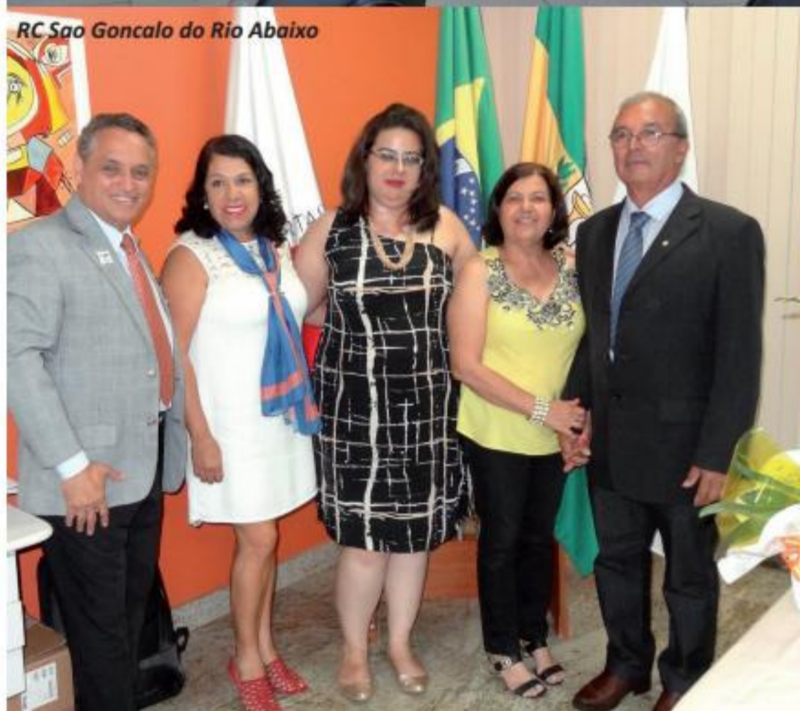
RC Sao Goncalo do Rio Abaixo