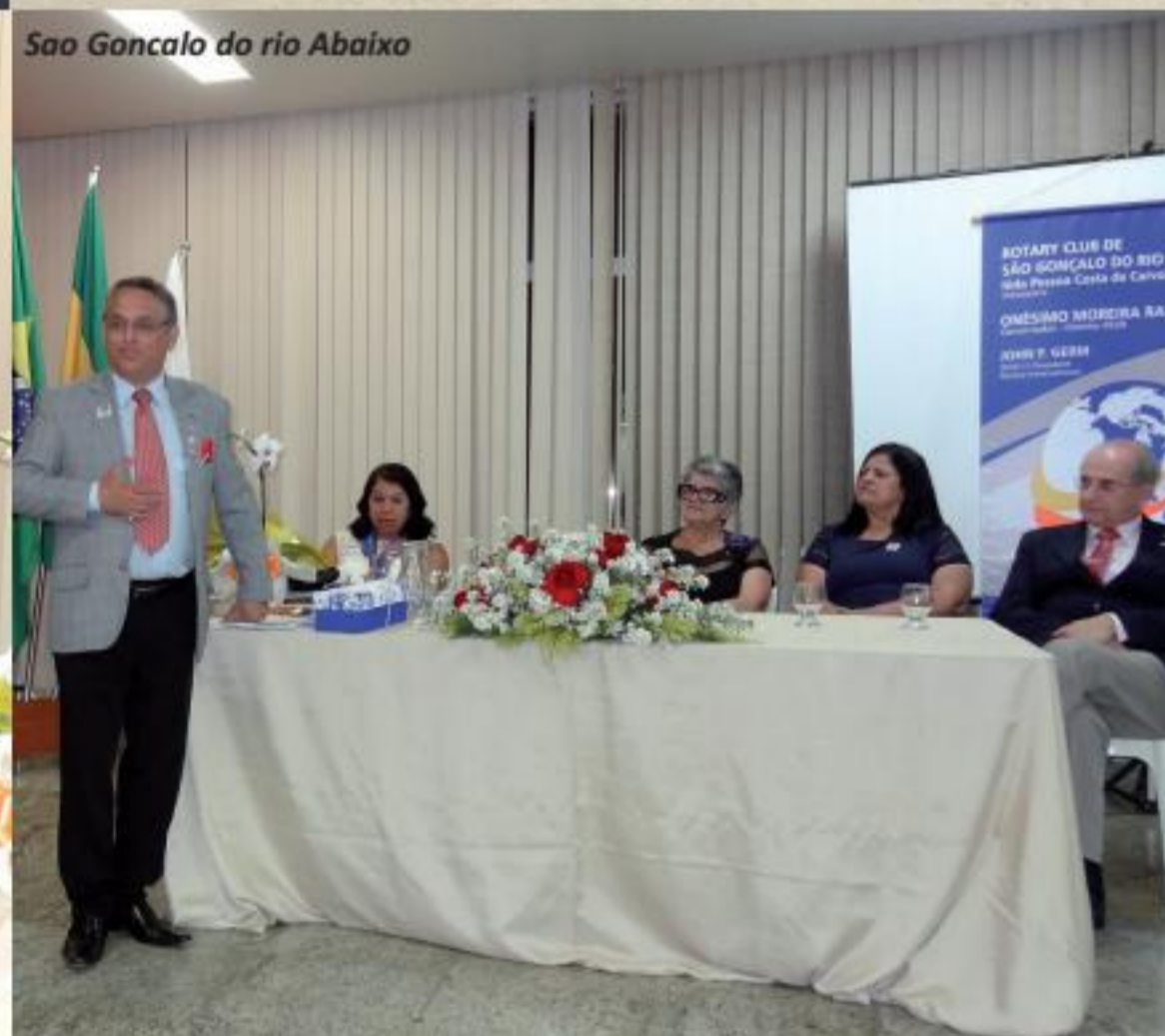
Sao Goncalo do rio Abaixo